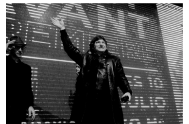
El economista presentó recientemente su película. - Télam -

Esa situación, recordaron, se dio a fines del año pasado, cuando los integrantes de la Corte firmaron una medida cautelar que ordenó al Gobierno nacional que aumentara a 2,95% el monto de la coparticipación para el distrito capitalino. - Télam -