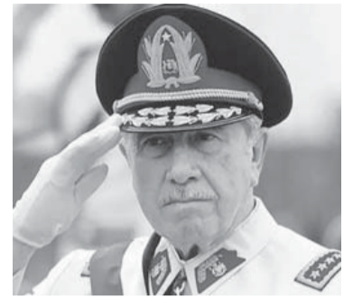
Augusto Pinochet.