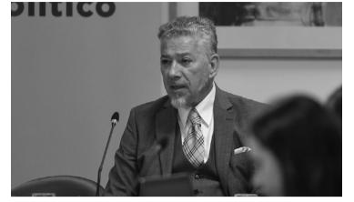
Continúan las audiencias.