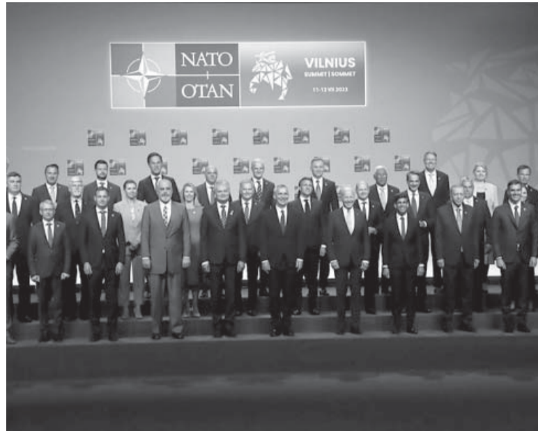
Foto de familia. Los asistentes a la cumbre de la OTAN.

Un despliegue público de enojo de Zelenski durante la cumbre podría renovar las tensiones entre los aliados justo cuando habían empezado a remitir gracias a la decisión de Turquía de retirar sus objeciones a la entrada de Suecia. Stoltenberg aseguró el lunes que el presidente turco, Recep Tayyip Erdogan, les prometió a él y al primer ministro sueco, Ulf Kristersson, que enviará “lo más pronto posible” al Parlamento turco el