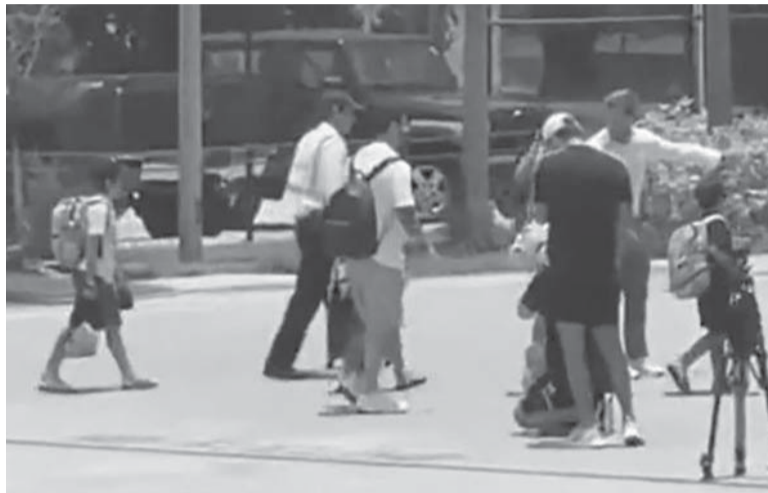
Destino. Los Messi llegaron a Miami en vuelo privado.

"Estamos felices de la decisión que tomamos. Preparados y con ganas de afrontar el nuevo desafío, el nuevo cambio. Mi mentalidad y