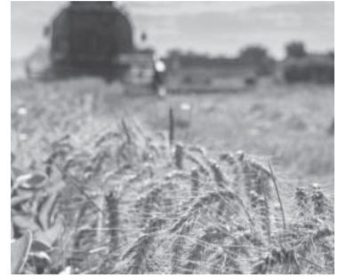
Informe de la Bolsa rosarina de Comercio. - DIB -

La recaudación por ingreso de divisas de la primera mitad del 2023 está en un 10% por debajo del año pasado.