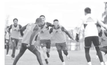
Saborea el título. - River -