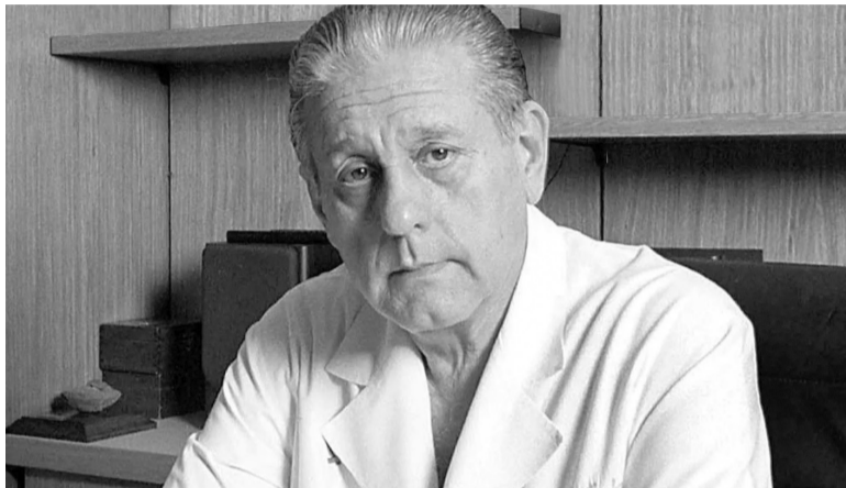
Héroe. El cirujano platense René Favalaro realizó el primer bypass aortocoronario en 1967.

Hace un siglo nació el primer médico que tuvo la capacidad de parar temporalmente el corazón