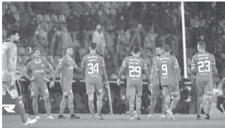
Reprobado. El equipo se fue silbado por la gente.

Árbitro: Ariel Penel. Cancha: Ricardo Enrique Bochini.