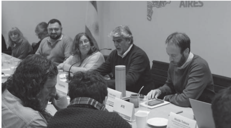
Aceptada. La propuesta provincial fue recibida de buen grado por los sindicatos ya que supera la proyección inflacionaria. - Gobernación -

El encuentro por las paritarias entre las autoridades provinciales y los representantes de los gremios estatales se realizó en la sede del Ministerio de Trabajo bonaerense, en La Plata, y participan funciona-