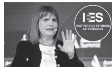
La exministra usaría su instituto como "pantalla". - Archivo -

También aprovechó para dejar un mensaje sobre René Favaloro, al cumplirse 100 años de su nacimiento: "Fue un hombre inmenso. Tuve el placer de conocerlo y ayudarlo en mis años como vicepresidente del Banco Provincia, lo ayudé mucho con su fundación. Era un hombre tan sabio como humilde. Y en algún lugar Favaloro dirá: mi prédica no fue en vano y tuvo sentido", afirmó el Presidente. - Télam -