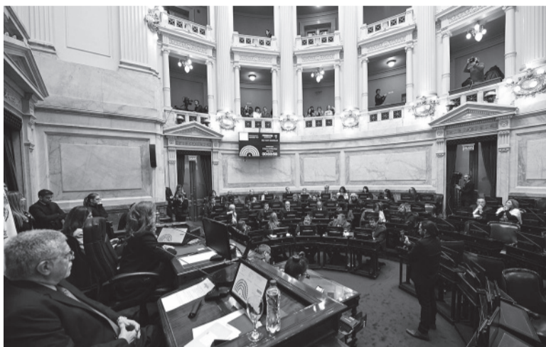
Dardos cruzados. Oficialismo y oposición se acusaron mutuamente de la caída de la sesión.