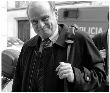
El fiscal Guillermo Pérez de la Fuente.