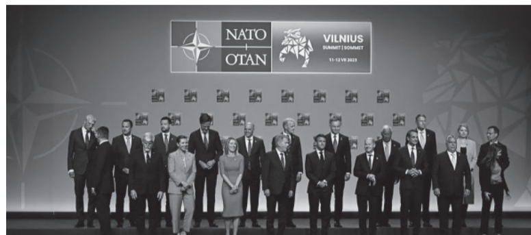
Líderes de la OTAN en la cumbre en Lituania.

Nuevo foro en el último día de la Cumbre de la Alianza Militar en Lituania.