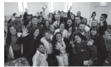
El presidente estuvo en Luján.