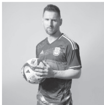
Messi con la camiseta alternativa.

El campeón del mundo en Qatar 2022 es el protagonista de un video comercial de la marca que viste a los seleccionados nacionales junto a David Beckham, uno de los dueños de Inter Miami, su flamante club; el alemán Leon Goretzka; el exfutbolista inglés