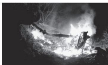
El hecho ocurrió en el estado mexicano de Jalisco.

El atentado se produjo cuando un grupo de oficiales acudió a