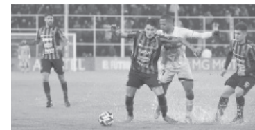
Derrota del "Patrón" en casa.