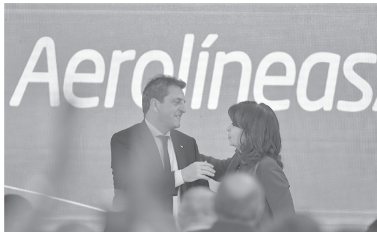
En campaña. La vicepresidenta Fernández y el precandidato Massa. - Télam -

una elección enorme en Santa Fe marcando un punto de inflexión, como lo venimos haciendo en San Luis, en San Juan, en Chaco, en Córdoba. Hay una ola de cambio que viene con mucha fuerza del interior que se va a consolidar el 13 de agosto a nivel nacional y en la provincia de Buenos Aires", sostuvo Santilli, y añadió: "Nosotros le devolveremos la provincia a los bonaerenses. Eso significa que en la escuela los chicos aprendan, y trabajemos para que haya trabajo formal, que te permita tener aguinaldo, vacaciones y acceso a la salud. También iniciaremos una contundente lucha contra el narcotráfico y el delito". - DIB -