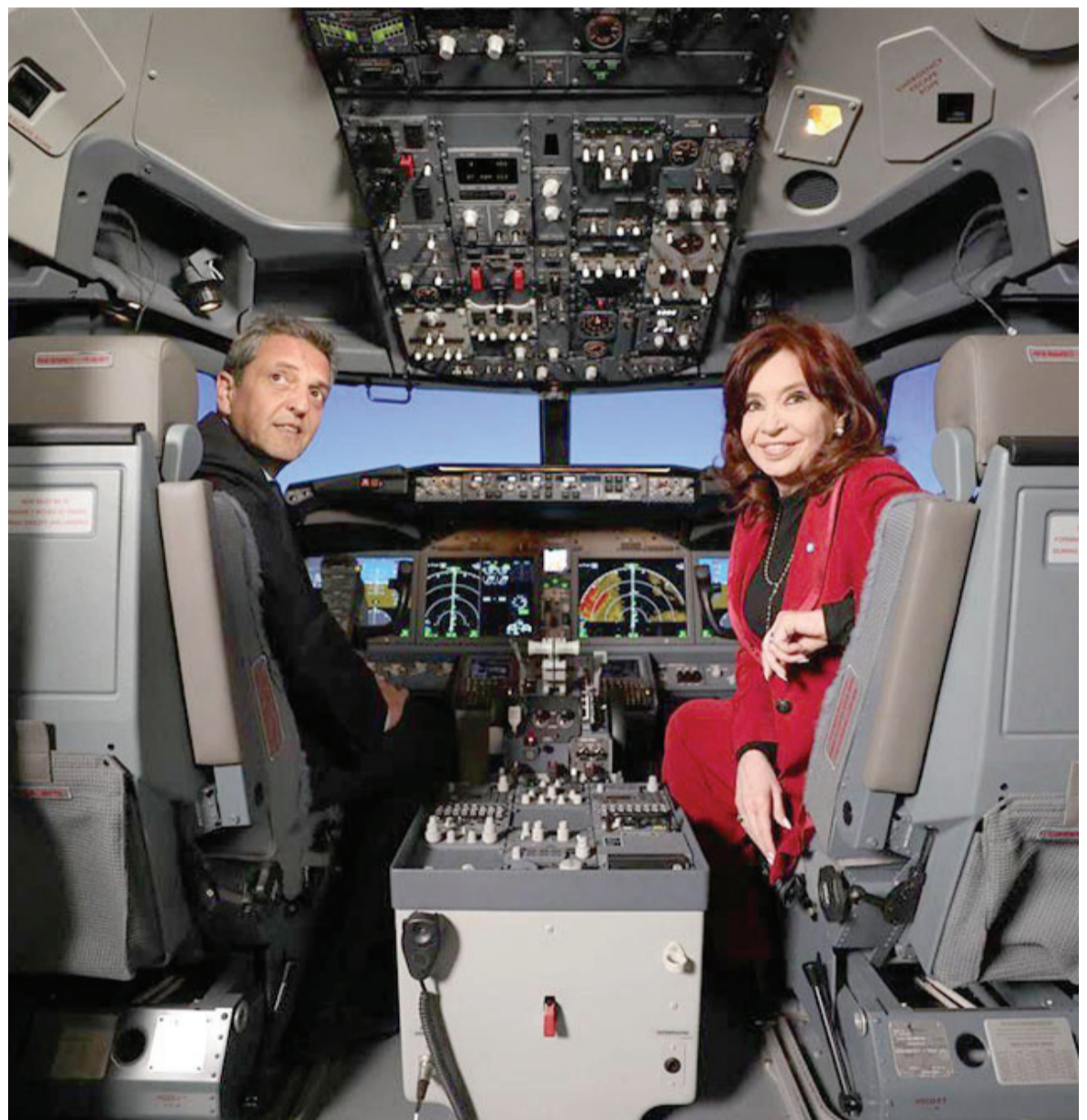
Al comando. Sergio Massa y Cristina Fernández, en el nuevo simulador de vuelo de Aerolíneas.

La vicepresidenta volvió a mostrarse junto al precandidato a presidente en un acto por los 15 años de la reestatización de Aerolíneas. Ambos apuntaron sus críticas contra el jefe de Gobierno porteño, aunque sin nombrarlo. - Pág. 3 -