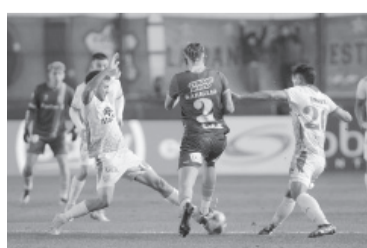
El equipo cordobés pudo volver a sumar de a 3.

Árbitro: Andrés Gariano. Cancha: Julio Grondona.