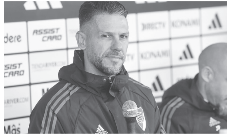
Campeón debutante. El técnico de River brindó sus sensaciones en conferencia.

"No era fácil pero entendí que, si River se decidía por nosotros, era el momento porque había invertido mucho tiempo en capacitarme. Me sentía con capacidad para asumir el cargo, más allá de que como DT uno sabe que se puede ganar, empatar y perder. La pelota a veces entra y a veces sale", reflexionó el