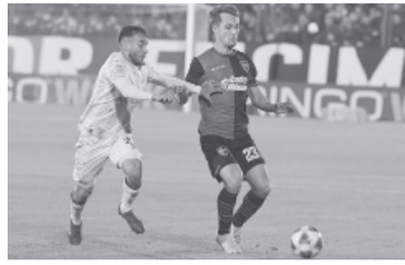
Partido caliente en Rosario.