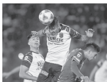
El "Guapo" lo ganó en el final.

Árbitro: Facundo Tello. Cancha: José Dellagiovanna.