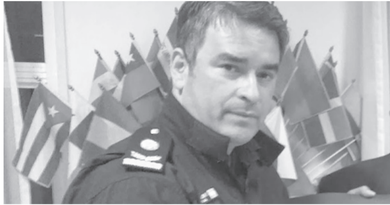
Detenido. El comisario mayor Francisco Centurión se resistió a la detención y terminó herido de un balazo en un tobillo.

Los efectivos policiales se presentaron en la casaquinta de la Calle 1538 al 600, de la localidad de La Capilla, partido de Florencio Varela, propiedad de