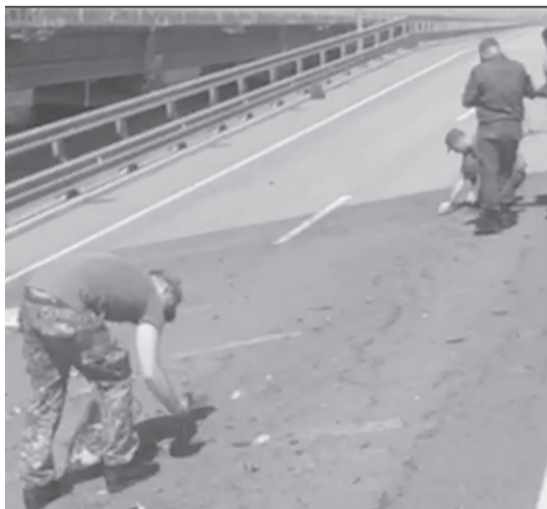
¿Motivo? En plena tensión, drones navales atacaron el puente que une Rusia con la península anexada de Crimea.

Firmado en julio de 2022 en Estambul y ya prorrogado en dos ocasiones, el acuerdo mediado por Turquía y Naciones Unidas que permite a Ucrania exportar sus cereales por el mar Negro posibilitó, durante el año transcurrido, sacar