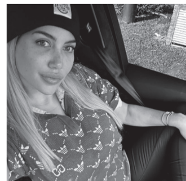
Wanda Nara en su posteo.

"Agradezco a mi familia, a cada amigo y cada uno de ustedes por de-