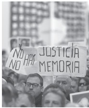
Renovado pedido de justicia.