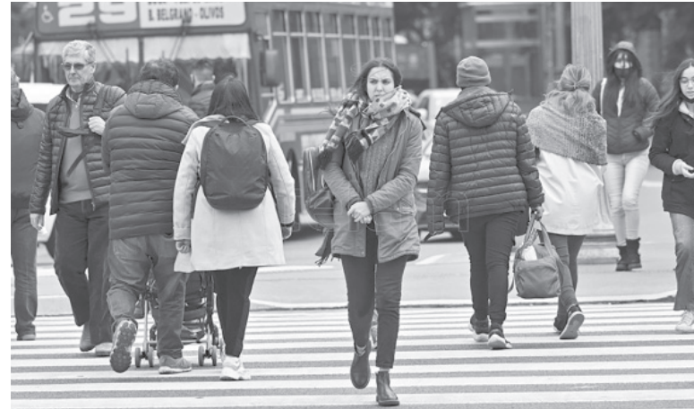
Temperatura. El frío castiga a gran parte del territorio argentino.

La ONU advirtió ayer que el mundo debe prepararse para olas de calor más intensas, en momentos en que varias zonas del hemisferio norte experimentan temperaturas sofocantes que han provocado incendios y amenazan la salud de la población.