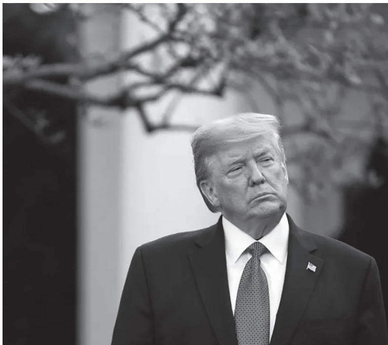
En la mira. El expresidente de Estados Unidos, Donald Trump.

El fiscal Smith investiga los intentos para anular las elecciones de 2020 que condujeron al