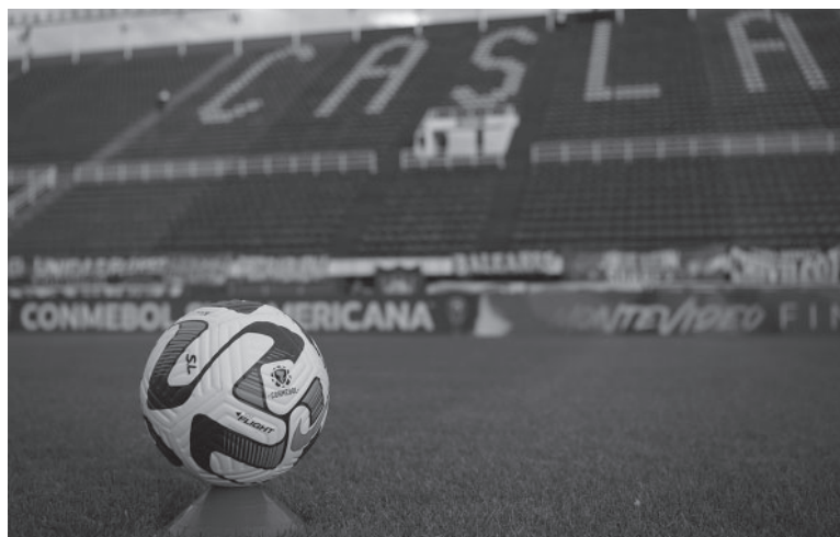
Preparado. El Pedro Bidegain espera por el duelo copero. - San Lorenzo -

El equipo dirigido por Rubén Darío Insúa venció en el cotejo de ida, en Medellín, por 1 a 0 con