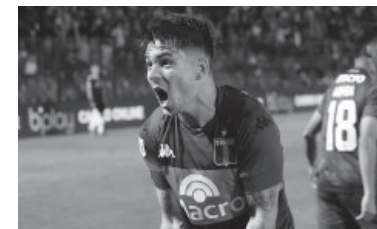
El lateral derecho que pidió Jorge Almirón.