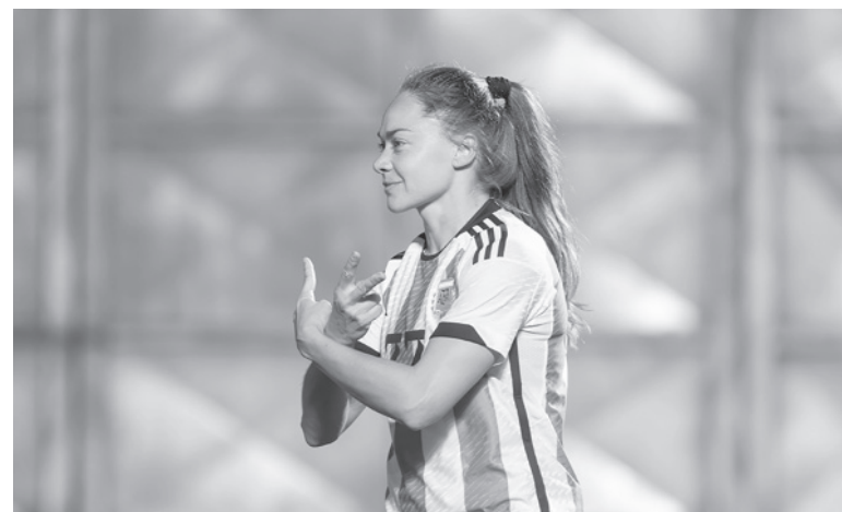
Estefanía Banini, la jugadora argentina de mayor jerarquía.