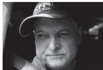
Ricardo Martinelli.

Según Martinelli, que gobernó Panamá entre 2009 y 2014, el proceso en su contra es un "juicio político amañado" y una "persecución política" para evitar que pueda presentarse a las elecciones