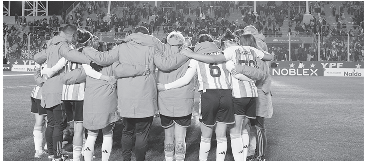
A soñar. La "Albiceleste" comparte Grupo con Italia, Suecia y Sudáfrica. - @Argentina -

Solo por participar de la fase de grupos, cada futbolista se llevará 30.000 dólares. Mientras que a medida que vayan avanzando, la cifra irá en aumento: 60.000 dólares para las que clasifiquen a octavos de final, 90.000 para cuartos, 165.000 para las perdedoras del partido por el tercer puesto,