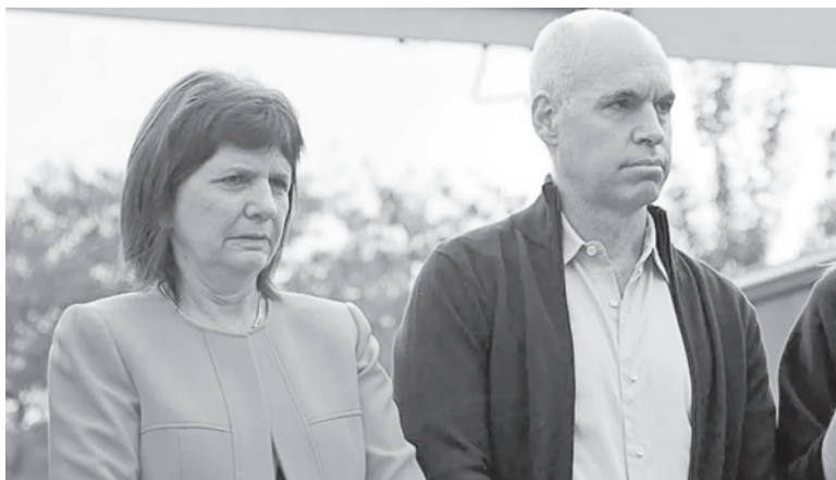
Precandidatos. Patricia Bullrich y Horacio Rodríguez Larreta.

El texto continúa: "No podemos aceptar que declaraciones contra Patricia Bullrich como las del dipu-