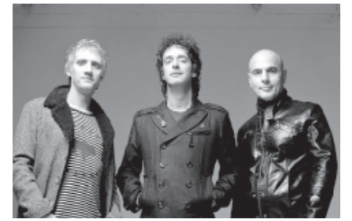
Soda Stereo. - Archivo -