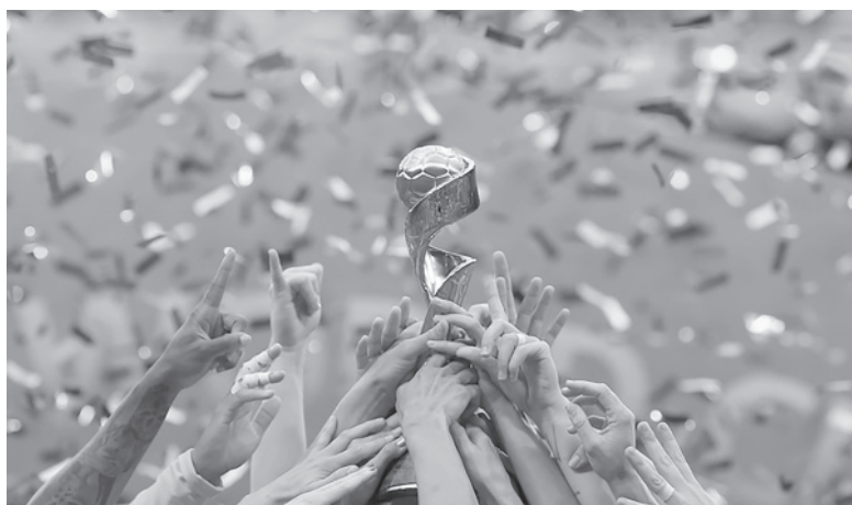
El trofeo por el que lucharán 32 selecciones.

El rosarino se puso la camiseta alternativa que utilizará el equipo dirigido por Germán Portanova en el certamen de Australia y Nueva Zelanda, que está inspirada en los paisajes de la Argentina.