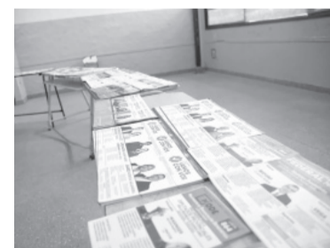
La Libertad Avanza, de Milei, presente en 116 comunas.

La pelea opositora también merece un capítulo, y allí Avanza Libertad le saca una ventaja a la izquierda. Pese a las denuncias y algunas bajas, la fuerza de Javier Milei tiene oficializadas listas en 116 distritos, con