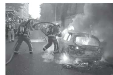
Noches de disturbios.