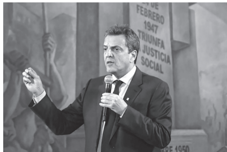
Elocuente. El también ministro de Economía reconoció que en la presente gestión los salarios no lograron recuperarse.

Massa admitió que “hay compañeros nuestros desilusionados o a lo mejor decepcionados”, situación que atribuyó a que “si bien creció 33 meses consecutivos el ingreso al trabajo, los salarios no