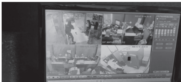
El atraco. Todo quedó registrado a través de cuatro cámaras de seguridad interna. - captura de video -

Según las imágenes, a las 10.03 ingresaron dos de los delincuentes encapuchados y con pasamontañas, quienes amenazando con dos armas largas interceptaron a un empleado de la seguridad privada del banco y lo trasladaban hacia una habitación