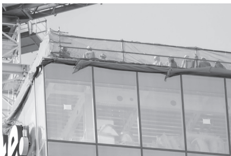
Escena. El hombre atacó desde la terraza de un rascacielos en obra.

construcción fueron testigos de cómo el tirador entró al edificio dispuesto a dispararle a todo el mundo. Entre los heridos se encontraba un oficial de policía, que pudo llegar a la ambulancia con la ayuda de sus colegas. "Esta terrible situación no podría haber llegado en peor momento, cuando el mundo tiene sus ojos puestos en nosotros. Es terrible, sobre todo porque nunca antes habíamos tenido un incidente como éste", declaró el alcalde de Auckland, Wayne Brown, a la cadena de televisión local TVNZ. La policía desplegó un gran operativo policial en la zona y pidió que la gente se quede en sus casas y evite pasar por el centro de la ciudad.