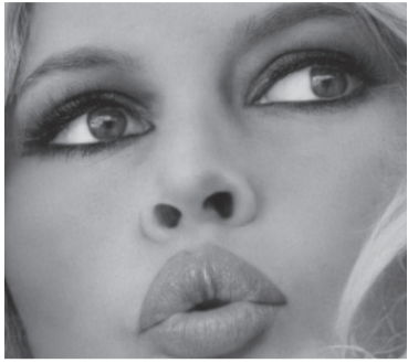
La diva Brigitte Bardot.