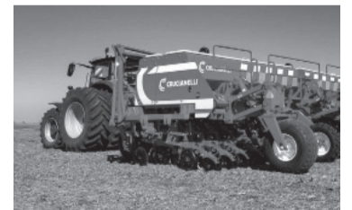
Una sembradora.