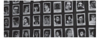
Hoy se conocerá la identidad.