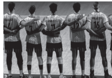
Derrota 0-3 en cuartos.

Más allá de la dolorosa caída, el seleccionado nacional recordará esta edición de la Liga de las Naciones