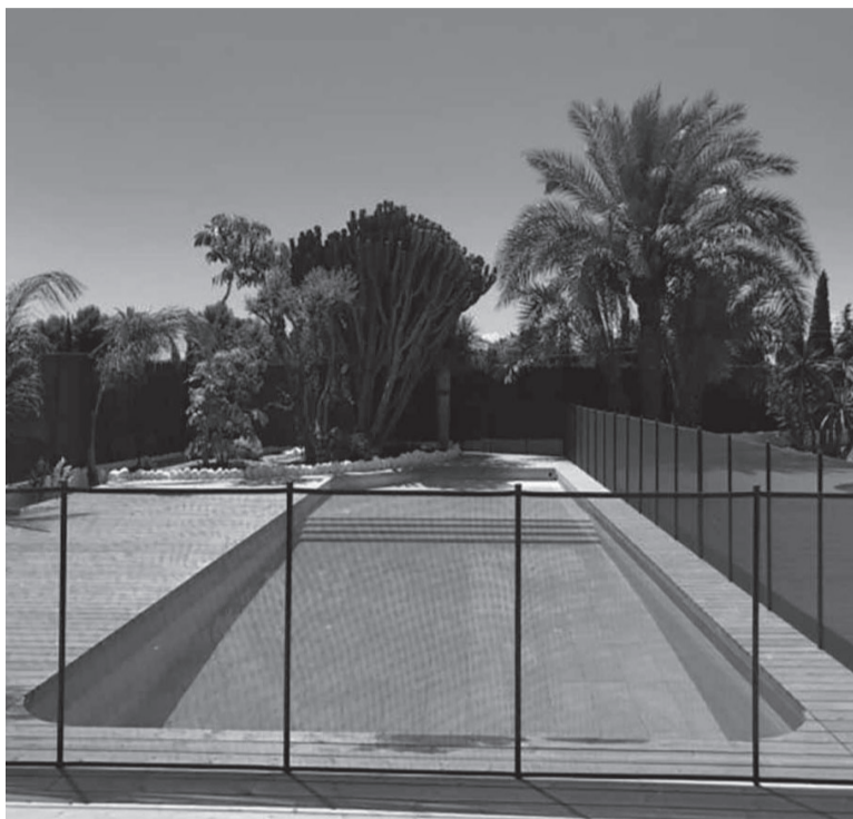
No subestimar. Diez centímetros de agua es suficiente para que un bebé o un niño o niña se pueda ahogar. - Archivo -

“Respecto de los más chiquitos es importante enfatizar que aunque nosotros tengamos un cerco bueno con un buen broche, cuando estamos en un sitio que no conocemos es fundamental que lo recorramos, que veamos si no hay pozos destapados, si no hay piletas en el lugar o predios vecinos sin cerco, etc.”, describió. Y continuó: “Es bastante común el ahogamiento en el momento que se están bajando los bolsos o cuando hay muchos adultos que están cuidando y en definitiva no está cuidando nadie; por eso siempre insistimos en que haya un adulto designado sin distractores, es decir, que no esté mirando el celular, por ejemplo”. - DIB -