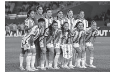
La Selección cayó 1-0 ante Italia en el debut.

El equipo de Germán Portanova, número 28 del ranking FIFA, dejó todo en el encuentro ante las duras europeas (16°) pero sufrió los ataques de su rival, en especial en el complemento, y no logró sumar puntos frente a 30.889 espectadores. Germán Portanova, téc-