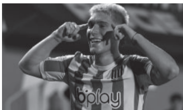
B. Rollheiser. - Internet -