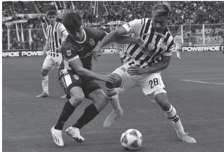
Se descuidó. Talleres dejó pasar la chance para finalizar segundo.

Los citados por el DT son buena parte de los integrantes habituales del representativo argentino, a excepción