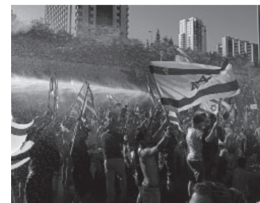
Protestas en Israel.

Las protestas han atraído el apoyo de todos los estratos políticos y sociales, tanto de izquierda como de derecha, grupos seculares y religiosos, activistas por la paz y reservistas militares, así como trabajadores manuales y del sector tecnológico crucial para la economía del país.