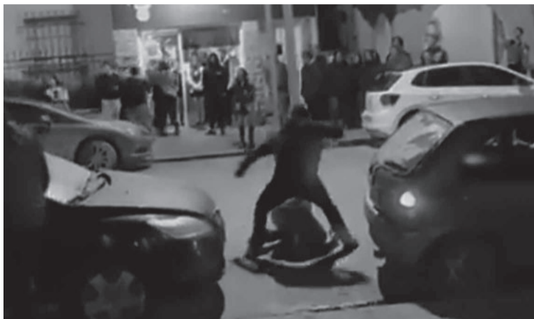
En el piso. El momento en que uno de los patovicas ataca. - Captura de video-

"El Departamento Ejecutivo puso a disposición de la Justicia y de los organismos de seguridad la información recolectada con el fin de que