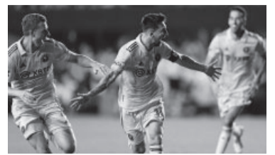
El "10" festeja su primer gol en Miami.