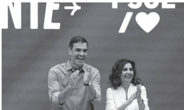
Saliente. El presidente del Gobierno español, Pedro Sánchez.

Sánchez festejó en la noche del domingo el mucho mejor desempeño electoral que el esperado que tuvo el PSOE, que frustró el escenario más pronosticado por los sondeos: que el