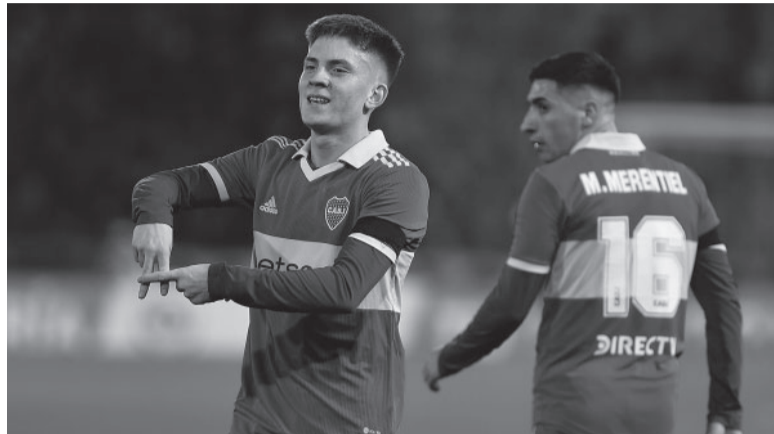
Otro gol. El juvenil "xeneize" festeja otro tanto en Primera División.

Boca derrotó ayer a la noche a Newell's por 2-1, en partido válido por la 26ta. y penúltima fecha del