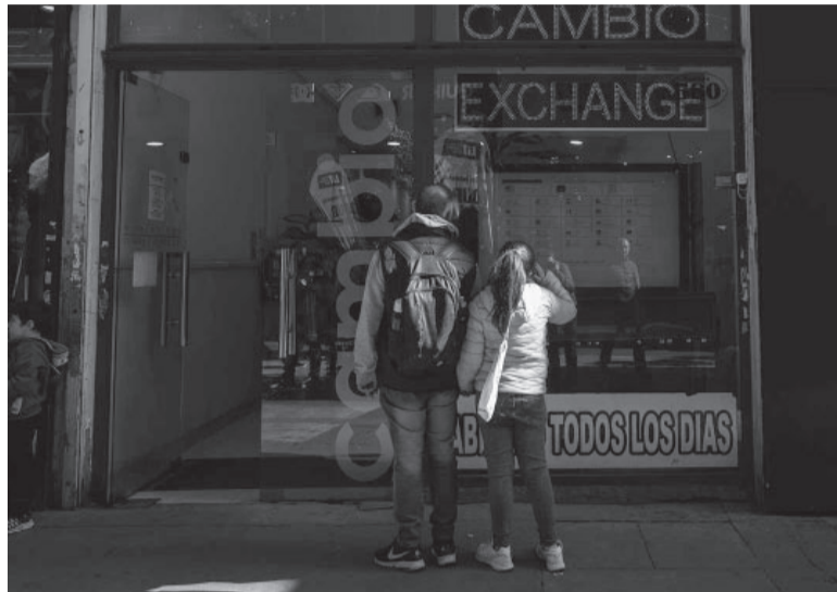
Escalada. La divisa norteamericana ya avanzó $ 58 en julio. - Xinhua -

Los bonos soberanos en dólares subieron ayer hasta 3,8%, alentados por el principio de acuerdo técnico entre el Gobierno nacional y el Fondo Monetario Internacional (FMI), merma que tuvo su correlato en el riesgo país, que retrocedió 3% y volvió a ubicarse debajo de los 2.000 puntos. Así, el bono Global 2035 subió 2,22%, el Global 2041 ganó 2,60% y el que vence en 2046 cedió 3,33%. Los más cortos, el Global 2029 subió 3,84% y el Global 2030, trepó 2,04% y el que vence en 2038 sumó un 2,16%. En este contexto, el precio promedio de los Globales ascendió a los US$ 33,7 frente a los US$ 33,13 del viernes. Por su parte, el riesgo país -medido por el JP Morgan- cayó 3,02%, al quedar en 1.960 puntos básicos. - Télam -