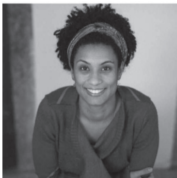
Marielle Franco.

impulso en febrero, cuando la policía federal comenzó a trabajar en el caso, por orden del ministro Dino, quien aseguró que esa declaración “permitirá sin duda” llegar al o a los responsables intelectuales del crimen.