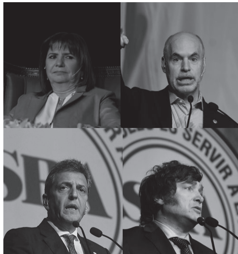
Al campo. Lunes de exposición en el Predio de Palermo.

A su turno, Bullrich -adversaria interna de Larreta- propuso avanzar en una “austeridad absoluta en el Estado” para generar “inversión y producción en el campo” y remarcó que “Argentina tiene que tener un cambio estra-