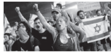
58 detenidos en Tel Aviv.

La aprobación de una medida clave de la reforma judicial impulsada por el Gobierno de Benjamin Netanyahu intensificó ayer la crisis en Is-