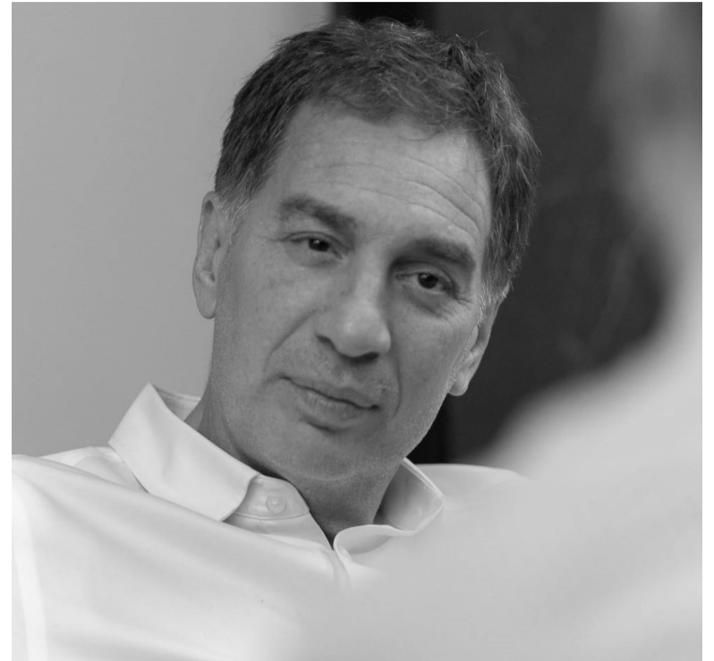
Reprobado. El elegido por Horacio Rodríguez Larreta para ser su mandamás en la provincia fue tajante respecto del mandato de Axel Kicillof.