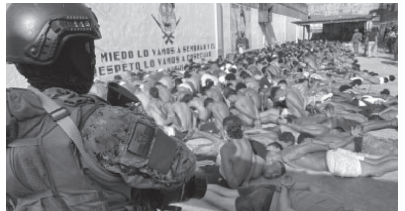
La situación carcelaria en Guayaquil es alarmante.

"La misión es poder restablecer el orden en este centro de privación a fin de precautelar la vida, la salud,