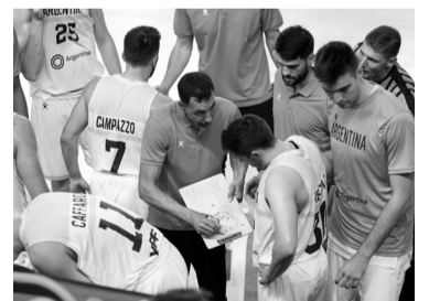
El equipo se prepara para el Preclasificatorio Olímpico. - CABB -

Por su parte, el bonaerense Sebastián Báez (64) se estrena recién hoy por la ronda inicial cuando confronte contra el noruego Casper Ruud (4), primer preclasificado del torneo. - Télam -