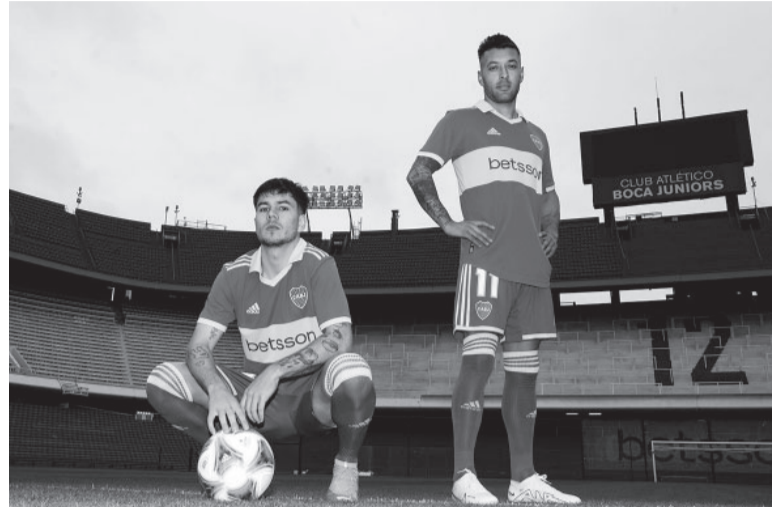
En sociedad. Las dos caras nuevas del “Xeneize”.

La novela de la llegada de Edinson Cavani a Boca entra en una etapa de definición y todo indica que será con final feliz, como esperan Juan Román Riquelme, vicepresidente del club de la Ribera, y