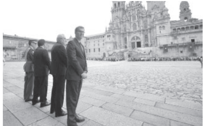
Obstinado. Alberto Núñez Feijóo, referente del PP.

El PSOE logró 122 bancas y sus aliados de izquierda Sumar, 31, por lo que juntos suman 153.