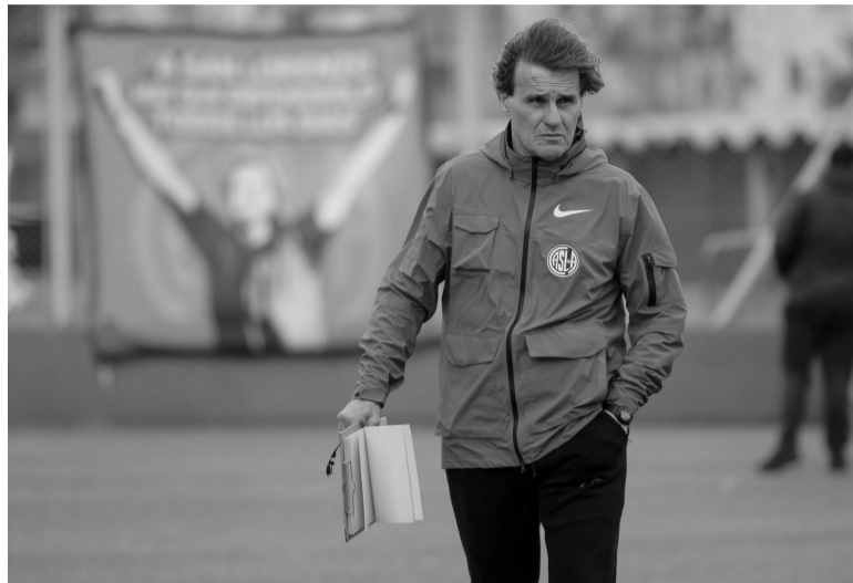
Lo mejor. Insúa vuelve a poner su once ideal. - CASLA -

Excursionistas, de la Primera C, y Almagro -de la Primera Nacional- juegan hoy por los 16avos de final de la Copa Argentina y el ganador será rival de Boca en la próxima fase del torneo. El partido se disputará desde las 18 en el estadio "Nuevo Francisco Urbano" del Deportivo Morón, será arbitrado por Pablo Dóvalo y televisado por TyC Sports. Excursionistas llega al cruce ante Almagro tras eliminar sorpresivamente a Gimnasia. Por el torneo de la Primera C, los del Bajo Belgrano se ubican en cuarto lugar. Almagro no gana desde hace cuatro fechas en la Primera Nacional y viene de empatar como local sin goles ante San Martín de Tucumán. - Télam -