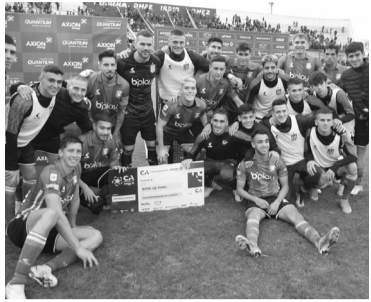
Boletó a octavos.