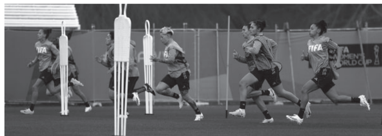
El equipo de Portanova, obligado a ganar.

Las arqueras y el resto de las jugadoras que entraron en los úl-