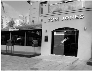
El boliche donde se produjo la agresión.