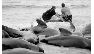
La manada de ballenas piloto falleció.

Australia.- Las 97 ballenas pilotos varadas en una playa del oeste de Australia murieron a pesar de los desesperados intentos de rescate, informaron ayer las autoridades locales. La manada de ballenas piloto -también conocidas como 'calderones'- fue detectada el martes en la playa Cheynes, a unos 400 kilómetros al sureste de Perth. Cincuenta y una de ellas murieron durante la noche del martes al miércoles. Unos 250 voluntarios se sumaron a 100 expertos en vida silvestre en una lucha en vano para salvar al resto de la manada durante la jornada del miércoles. - Télam -