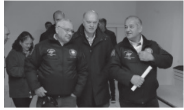
Dura respuesta para el candidato bullrichista.