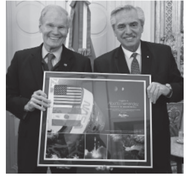
Fernández recibió al norteamericano.