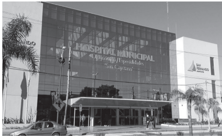
Irreversible. La niña ingresó fallecida a la guardia del Hospital San Cayetano. - Archivo -

El fiscal dispuso la aprehensión de la madre y el padrastro por "homicidio" e indicó que se lleve a cabo la autopsia al cuerpo de la niña. De acuerdo con los resultados preliminares de la necropsia, que llegaron al mediodía a manos del fiscal, la causa de muerte fue politraumatismos por golpes que provocaron una "falla multiorgánica". Los dos detenidos serán indagados por el fiscal en las próximas horas.