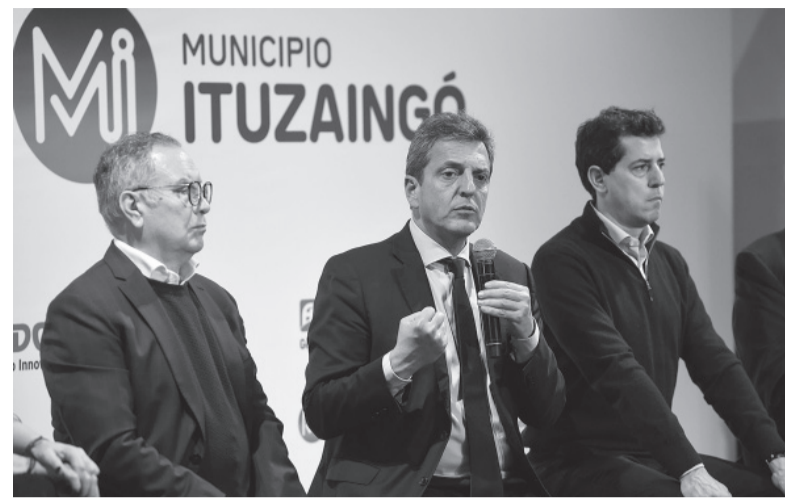
Desafío. El equipo técnico que Sergio Massa acordó condiciones. - Telam -

En el caso de los sectores de menores ingresos, Nivel 2 y Nivel 3 (el 70% de la población) aclaró que la suba tarifaria “estará muy por debajo de la inflación”, que de junio a junio rondó el 114%. “Lo importante es cuidar a los sectores de bajos ingresos hasta que haya una recomposición salarial”, remarcó Royon. - DIB -