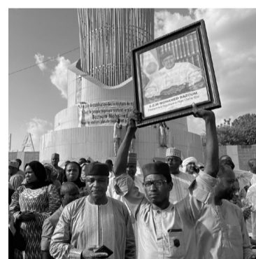
El Gobierno llamó al pueblo a rechazar la insurrección. - Internet -

La detención de Bazoum, de 63 años, amenaza esfuerzos de Occidente de estabilizar la región africana del Sahel, donde se han registrado varios golpes de Estado en los últimos años. Mali y Burkina Faso, vecinos de Níger por el oeste, han sufrido cuatro golpes de Estado desde 2020, y ambos enfrentan una ola de atentados y ataques de los grupos islamistas radicales Al Qaeda y Estado Islámico.