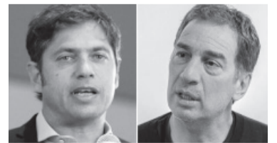
Virtual ventaja de 2,4% para el actual gobernador. - DIB -

De acuerdo al resultado de la encuesta, el 25,8% de los encuestados dijo que tiene decidido su voto, mientras que el 47,6% aún no lo decidió, lo que podría ser clave en el proceso del 13 de agosto. - DIB -