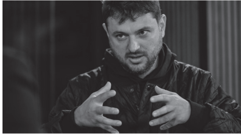
Austero. El militante y líder del Frente Patria Grande aseguró que en su hogar conviven cinco personas.

"No he hecho votos de pobreza, pero me gusta -parafreando la frase popularizada por Patricio Rey y sus Redonditos de Ricota del tema 'Un poco de amor francés'- que 'el lujo es vulgaridad', lo tengo muy