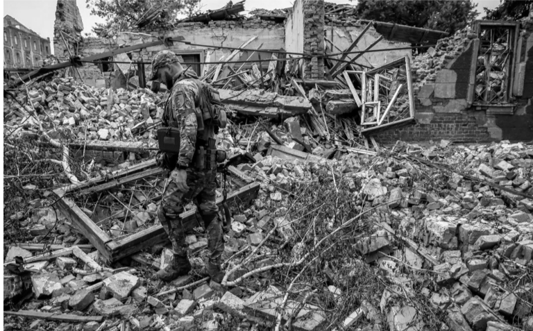
Resistencia. Las filas rusas lograron repeler el avance de las tropas ucranianas.

Un avance hacia Melitopol, que está ubicada sobre el mar de Azov, al este de Crimea, podría dividir en dos a las fuerzas rusas y cortar las líneas de suministro hacia unidades ubicadas más al oeste. Actualmente, Rusia controla toda