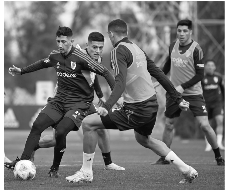
Cierre. Vuelven los titulares para el capítulo final. - CARP -

La "T" viene de empatar en dos goles como local de Gimnasia, en un partido que ganaba 2-0 pero que la visita igualó en una gran