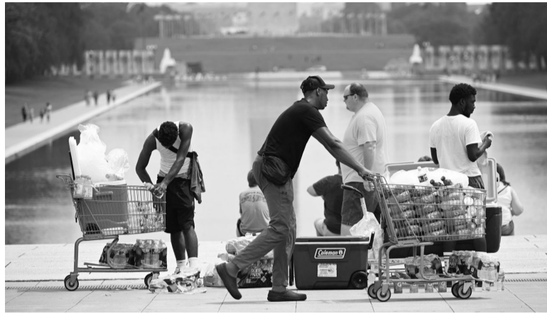
Rompemarcas. Las temperaturas estuvieron relacionadas con olas de calor en amplias zonas de América del Norte, Asia y Europa.

Los efectos del calentamiento debido a la actividad humana fueron concretos en estas últimas semanas: incendios en Grecia y Canadá, temperaturas extremas en el sur de Europa, África del Norte,