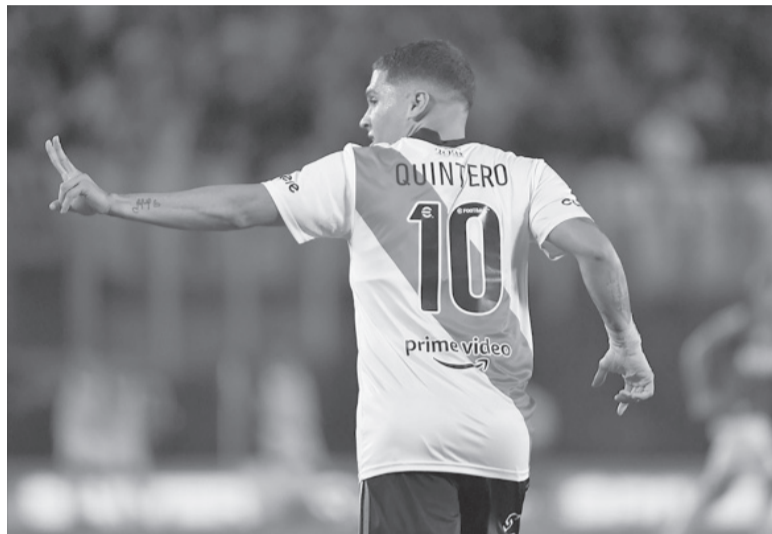
Refuerzo de jerarquía. Es la cuarta incorporación para el equipo de Gago.

cancha enfrentados en la recordada final de la Copa Libertadores de América entre River y Boca, disputada en Madrid, partido que terminó 3 a 1 a favor del "Millonario".