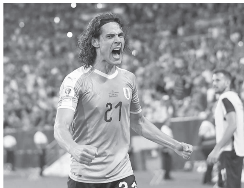
Ilusión uruguayo. El "Xeneize" recibirá al goleador.

La estadística del uruguayo muestra números impactantes en sus clubes anteriores: 200 tantos en 301 partidos con París Saint-Germain (2013-2020), 104 gritos en