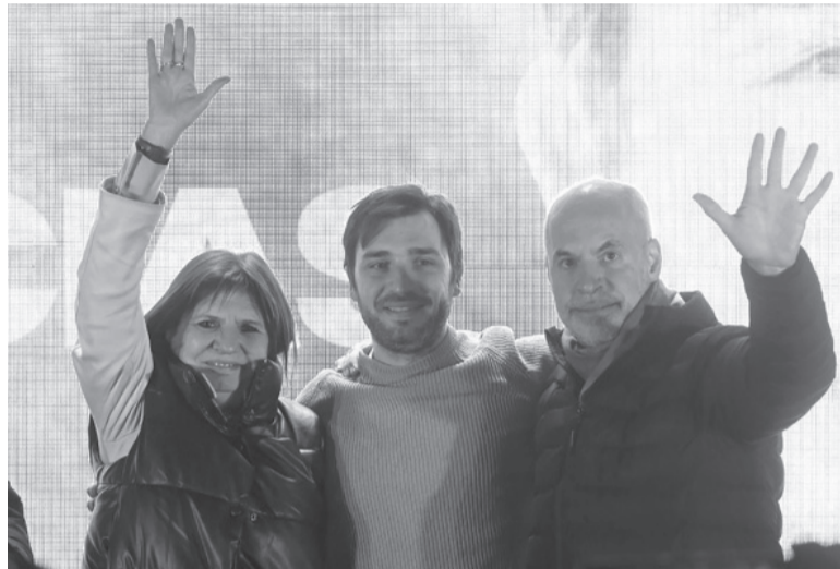
Unidad. "Nacho" Torres junto a los precandidatos Patricia Bullrich y Horacio Rodríguez Larreta.

A la medianoche, Torres subió al escenario acompañado de los precandidatos presidenciales de Juntos por el Cambio, Horacio Rodríguez Larreta y Patricia Bullrich. Torres pidió "disculpas a todos los que están en vilo", "avergonzado" por la demorada del escrutinio. "Hoy Chubut tiene un nuevo Gobernador", sentenció. "Quieren confundir. Después de 20 años vamos a terminar con la desidia en esta provincia", afirmó el autoproclamado gobernador electo. "Apelan a la trampa y a la mentira. Nosotros tenemos los