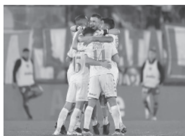
El "Globo" consiguió su segundo triunfo consecutivo.