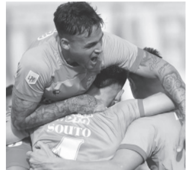
"El Arse" festejó en casa.

El "Sabalero" fue un equipo sin respuestas anímicas ni futbolís-