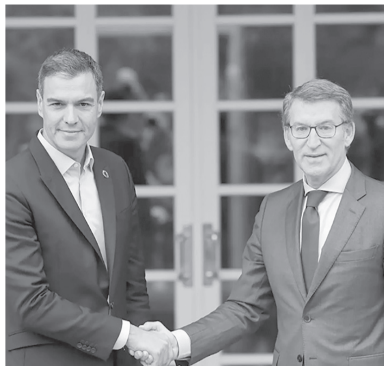
Las partes. Pedro Sánchez (izq.) y Alberto Núñez Feijóo.

La Junta Electoral rechazó volver a revisar los votos que emitieron los españoles en el extranjero, tal y como solicitaron los socialistas que buscaban recuperar el escaño perdido, alegando que no hay ninguna señal de "posibles irregularidades", en una resolución divulgada por el PP en Twitter.