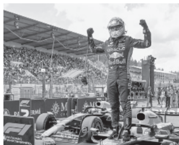
El neerlandés se encamina a un nuevo título.

Las plazas de puntuación restantes en Bélgica, entre el cuarto y décimo lugar, las ocuparon Hamilton (Mercedes); el español Fernan-