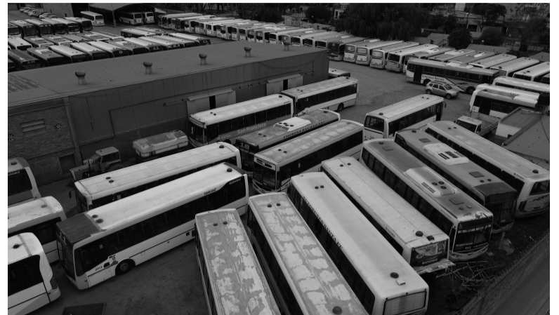
Caos. La medida, de alcance nacional, ocasionó complicaciones para al menos cuatro millones de trabajadores.