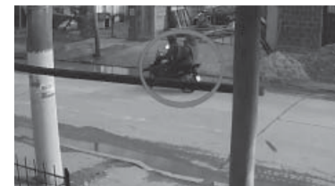
Analizan cámaras. - Captura de video -