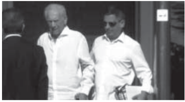
El Nobel peruano junto a su hijo.