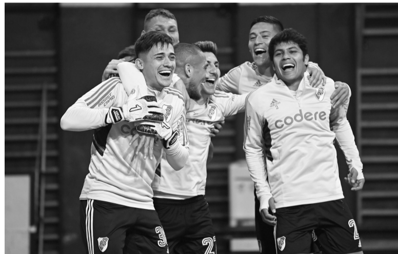
Sonrisas. Buen clima en el entrenamiento.

Demichelis tiene previsto repetir la formación que llega de vencer a Colón de Santa Fe en Núñez, después de apelar a la rotación en el juego anterior ante Barracas Central. Tras asegurarse el pase a octavos de final de la Copa Libertadores, River no