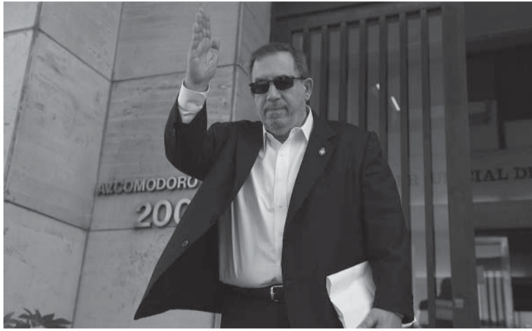
Proceda. El influencer y panelista, tras cumplir con la citación durante una hora en el quinto piso de Comodoro Py.

“Si no pagan y se hace una publicación con Milei, se encargan de decir que esa publicidad no es