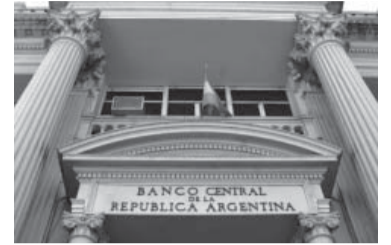
Los resultados representan una mejora del REM anterior. - Télam -

Así lo publicó el Banco Central en su Relevamiento de Expectativas de Mercado (REM).