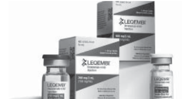
Un medicamento contra el Alzheimer.