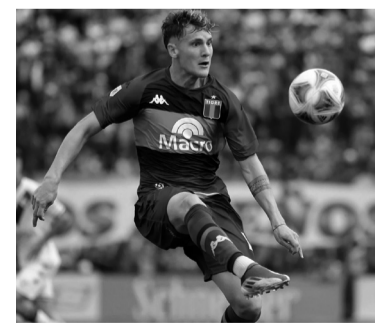
El actual Tigre busca destino. - Internet -

había comenzado su carrera en inferiores de Boca donde fue transferido a Milán en el 2019 con 17 años en seis millones de euros. - Télam -