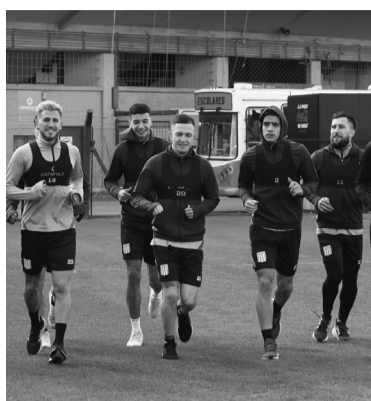
Rivalidad en el Hirschi. - @Racing -

Estudiantes, por su parte, tiene 38 puntos y también desea ingresar a las copas del año próximo.