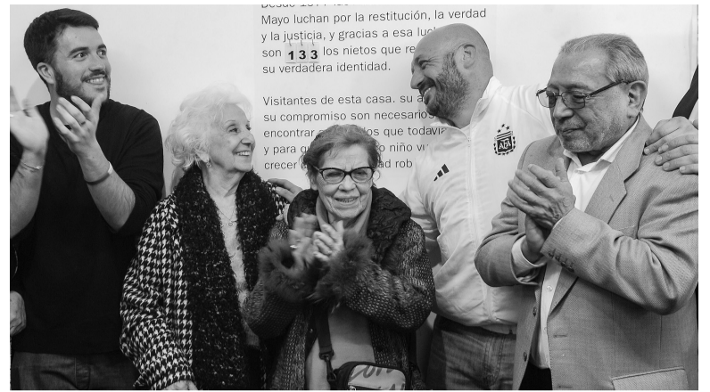
Esperanza. Estela de Carlotto, junto a la familia del nieto recuperado.

Sobre la recuperación de la identidad, señalaron que el nieto 133 "fue anotado como hijo propio