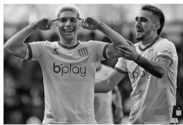
Dos de los goleadores de la tarde.