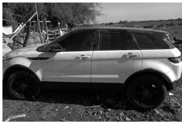
El vehículo del presunto estafador fue entregada ayer.

Luego, hallaron una segunda herida en la espalda del lado izquierdo, que le afectó el pulmón izquierdo y salió por la zona izquierda del tórax.