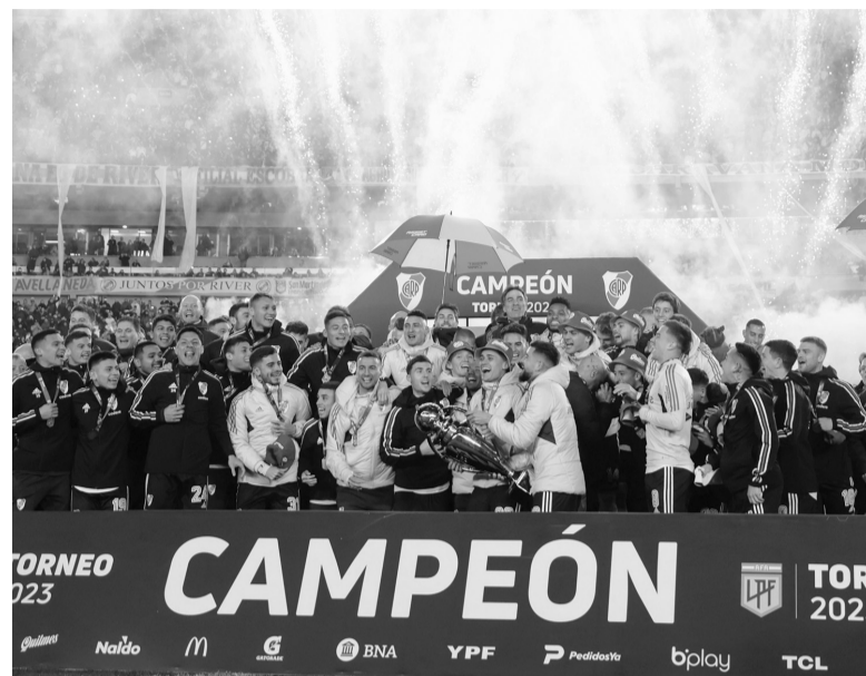
Coronación. Un nuevo trofeo se suma a las vitrinas.