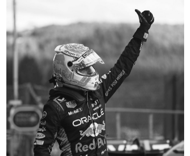
El "poleman" penaliza cinco lugares. - Max Verstappen -