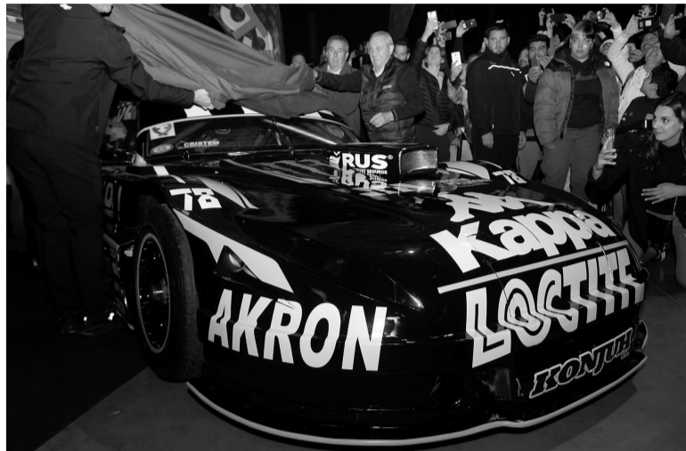
Lista. La "Chevy" que usará el "Titán" en el coliseo porteño.