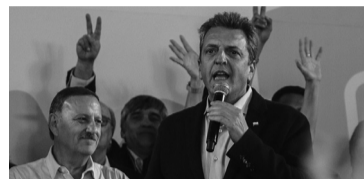
El ministro de Economía, en La Rioja.

Por pedido de Sergio Massa, el ministro-candidato de Unión por la Patria (UP), la "caravana militante" que iba a recorrer hoy distintos barrios de La Matanza fue pospuesta, en principio para el sábado próximo, dependiendo de la agenda del principal postulante presidencial del frente oficialista. En la actividad también tenían