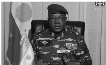
Francia advirtió que no reconoce a las nuevas autoridades.

La junta militar advirtió a su vez en un comunicado que enfrentará "cualquier intervención militar extranjera".