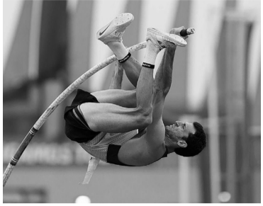
El garrochista santafesino.