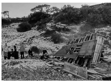
A Torres (42) lo buscan con un helicóptero.

Torres lleva con él un intercomunicador satelital (del tipo Inreach) que le permite enviar mensajes predeterminados o mails desde cualquier lugar, sin necesidad de contar con señal telefónica, y que indica la posición georreferenciada del aparato cada vez que se lo enciende.