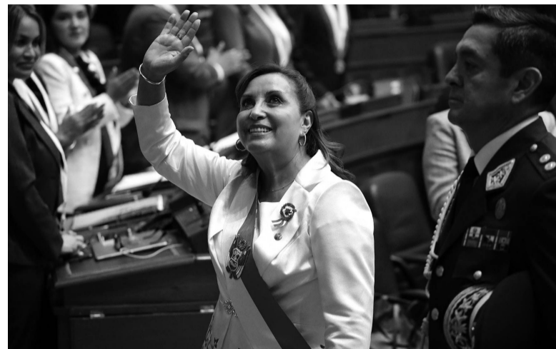
Questionada. La mandataria, que asumió el cargo al ser la vice del destituido Pedro Castillo, tiene poca aceptación popular.

"La democracia permite el derecho a la protesta, pero la democracia también permite y reclama