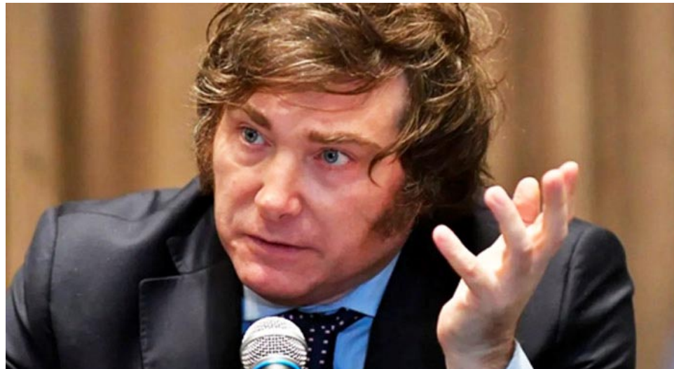
Javier Milei parece mirar el futuro, no sin preocupación.

Aunque Milei diga hoy que está en condiciones de asumir la máxima responsabilidad al