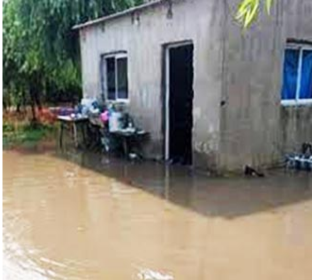
Sector de una de las calles del barrio Fátima, con larga experiencia en padecimientos.