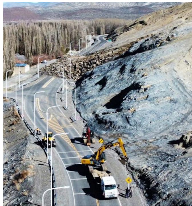
charlas, explicaciones y temas abordados.