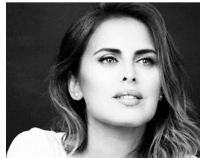
Silvina Luna, tenía sólo 43 años.

La mala noticia: Ayer pasado el mediodía se informó sobre la muerte de Silvina Luna, actriz y modelo que llegó al conocimiento de la gente a partir de Gran Hermano. Su belleza era notable, pero quiso mejorar su aspecto y eso terminó siendo causal de una enfermedad que le costó la vida. La suya es una de esas muertes que sale de lo cotidiano y debiera servir de experiencia. La pena de hoy se atenuará con el paso del tiempo, aunque la muerte solo existe en el olvido. Ojalá que su sacrificio y su dolor no sean en vano.