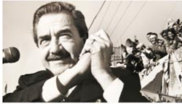
Gobierno a Don Hipólito Yrigoyen.

También sucedió en setiembre, en este caso el 6 del noveno mes de 1930, se produjo el golpe de Estado que desalojó del