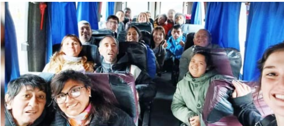
Los concurrentes del Centro de Día Municipal participaron de la Feria del Libro acompañados de profesores y coordinadora. Disfrutaron una divertida jornada recreativa en el espectáculo de Rudy Güemes.

SE OFRECE niñera y servicio doméstico por la mañana, con referencias comprobables muy buenas. Responsable. Comunicarse al 2342- 531568.