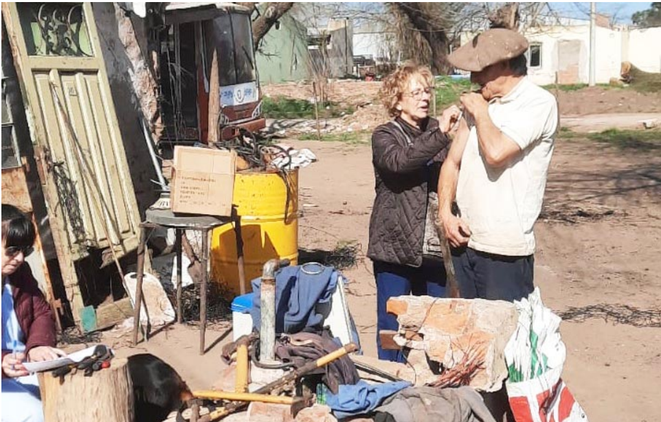
Días pasados se realizó una nueva jornada de vacunación, esta vez en el interior del Partido, en la localidad de O'Brien. La misma estuvo a cargo de Atención Primaria de la Salud (APS) con su personal y equipos de la Unidad Sanitaria. Se colocaron 109 dosis y se contactaron 71 personas.