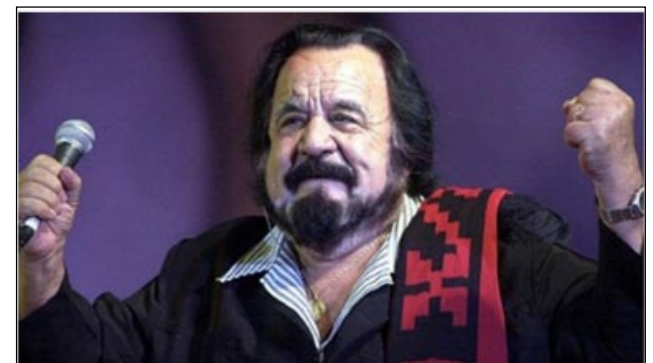
Letra de SI SE CALLA EL CANTOR (Creación de Horacio Guarany)

El recorrido de la trayectoria de Tita será el mejor modo de no olvidarla. La voracidad del tiempo se lleva casi todo, menos a quienes guardamos en el corazón.