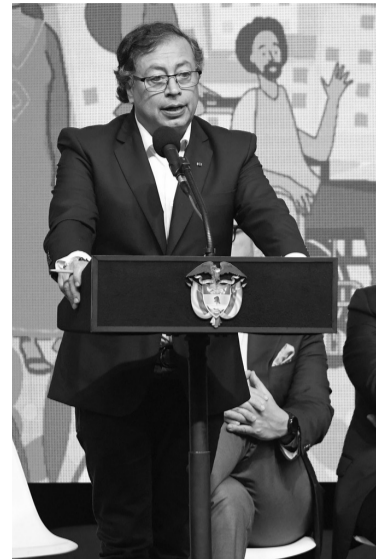
"Paz total", promesa de campaña de Petro.

Fue acordado entre el gobierno de Gustavo Petro y el Ejército de Liberación Nacional.