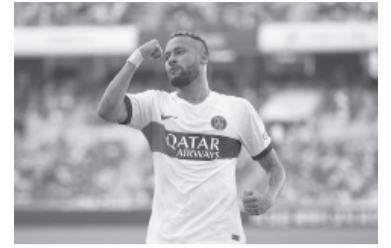
Puño apretado para "Ney". - PSG -