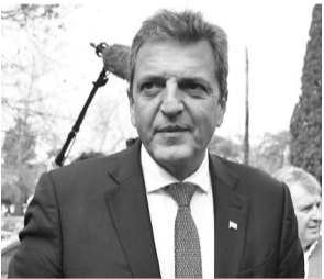
El ministro Massa.

"Hay una cosa especulativa sobre todo de algunos sectores que primero apostaron a que Argentina no iba a poder afrontar su deuda en pesos y lo logró; que no iba a poder cerrar su situación de acuerdo con el Fondo y lo logró; que no iba a poder transitar el daño que la sequía le hacía a la economía argentina por perder US$ 21 mil millones de exportaciones y con el régimen de administración del comercio exterior lo venimos transitando y llevando, sin frenar el nivel de actividad. Y el último bastión que les quedó es ir a la especulación sobre el dólar blue", analizó el ministro de Economía, Sergio Massa en una charla con los medios en Córdoba. - DIB -