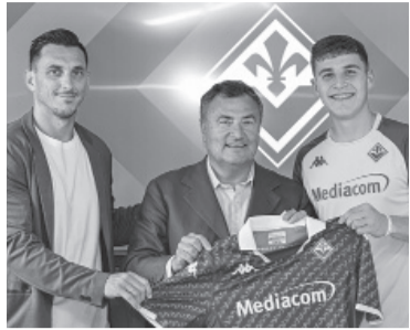
El mediocampista de 20 años. - Fiorentina -