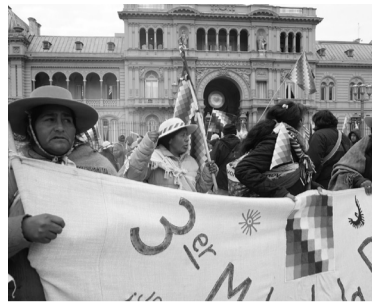
El Tercer Malón de la Paz.