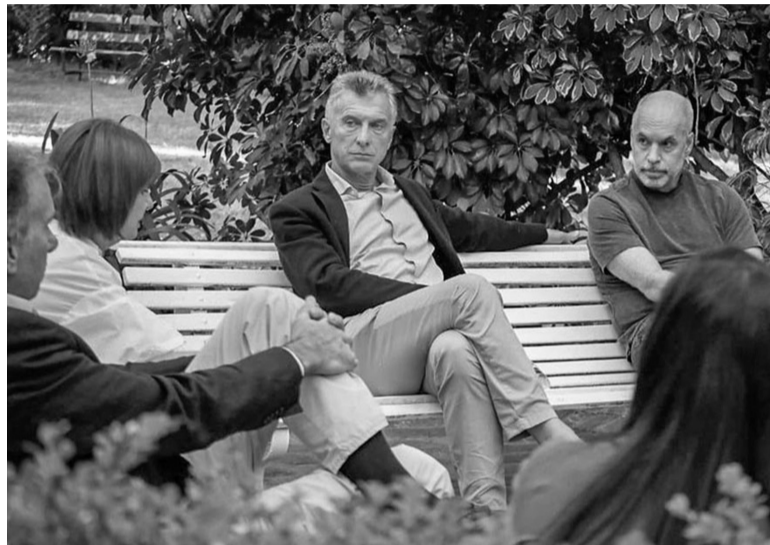
Otros tiempos. Macri, Larreta y Bullrich, en momentos de menor tensión.

Consultada respecto de la polémica, Bullrich les restó importancia a los apoyos expresados públicamente tanto por Vidal como por Facundo Manes en favor de su contrincante interno, y acudió a una chicana al señalar que son "solo dos votos". "Nuestra decisión es estar con la gente. Vamos a ganar por más que dos votos, así que estamos tranquilos", añadió la exministra de Seguridad macrista durante una recorrida por el partido bonaerense de Olavarría, donde estuvo acompañada por su precandidato a gobernador de la provincia de Buenos Aires, Néstor Grindetti.