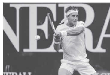
El platense batalló durante más de 3 horas. - ATP -

El bonaerense, cuartofinalista este año en Roland Garros, juga-