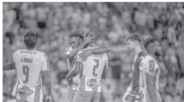
Endeble. El equipo de Gago quedó complicado para la revancha.

En el primer tiempo anotó para los locales Cristian Zapata, mientras que en la segunda etapa