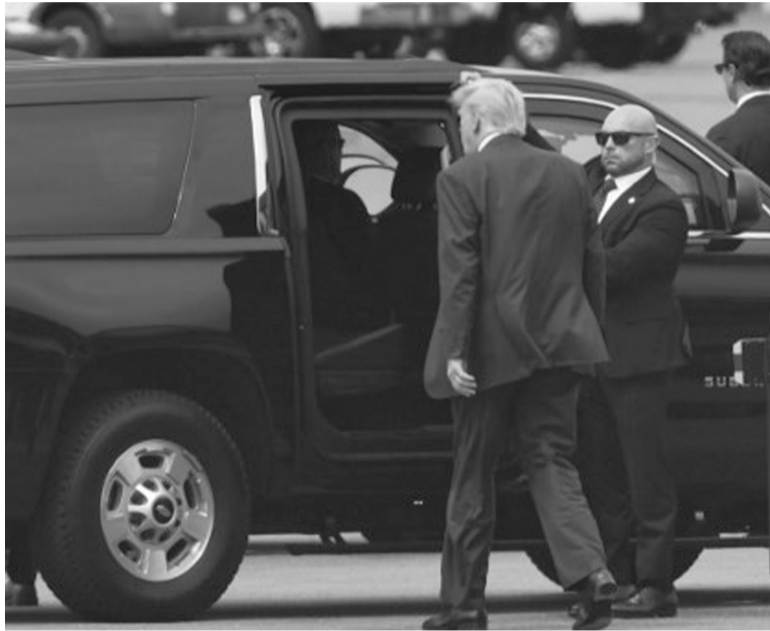
Arribo. Trump se presentó con puntualidad para la audiencia.

Trump se presentó con puntualidad para la audiencia, cuyo comienzo estaba previsto para las 16 (las 17 en la Argentina), y, tal como ocurrió en las otras dos comparecencias que tuvo este año por acusaciones