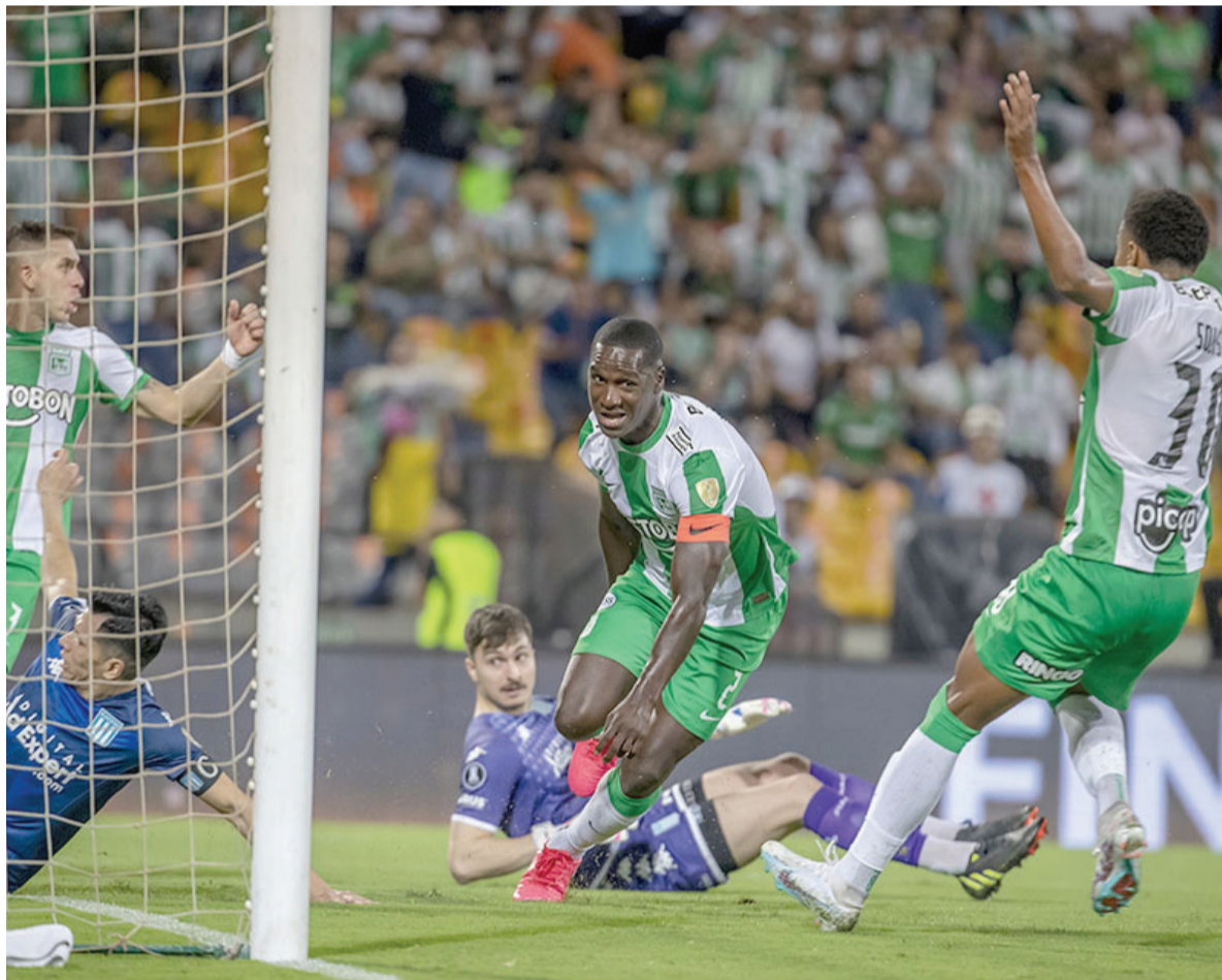
- Conmebol -

Los anuncios de Economía representarán un alivio fiscal para más de 1 millón de trabajadores. La escala actual, vigente desde mayo, establecía que las remuneraciones brutas mensuales no debían superar los $ 506.230 para estar exentas. - Pág. 3 -