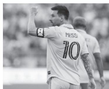
El capitán argentino festeja en su nuevo club.

Este lunes comienza la cuenta regresiva del partido debut frente a Ecuador, el jueves 7 de septiembre en el Monumental, donde la “Scalo-