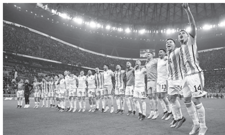
Cuenta regresiva. La Selección Nacional volverá a jugar en el país.

De los habituales convocados se espera por la recuperación del