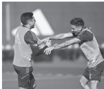
Risas en el entrenamiento del domingo.

Aunque, la duda sigue siendo Pablo Solari, que ingresó en el segundo tiempo y fue autor de los dos