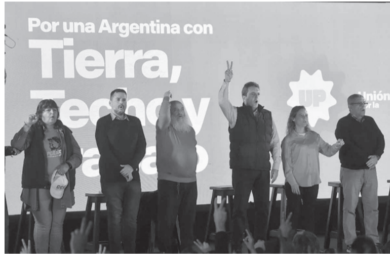
En Caballito. Massa, a la cabeza de un acto junto a movimientos sociales.

“No vamos a esperar al 10 de diciembre para poner en marcha el monotributo productivo. A fin de agosto lo vamos a poner en marcha en un gran trabajo con todos los movimientos sociales, con un DNU. Lo primero que tenemos que hacer