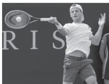
"El Peque" suma confianza.

El Masters 1.000 de Toronto, que inicia la gira sobre superficie de cemento previa al US Open, cuarto y último Grand Slam del año que se jugará en Nueva York desde el 28 de agosto, repartirá premios por 7.622.925 dólares y tiene como máximo favorito al número 1 del Mundo, el murciano Carlos Alcaraz.