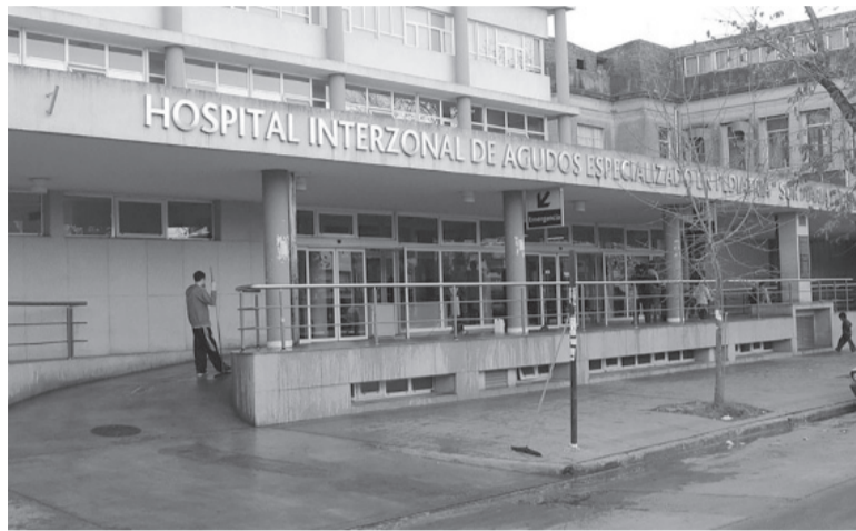
De referencia. El Hospital de Niños Sor María Ludovica de La Plata.

Un hombre de 73 años comenzará a ser juzgado en los tribunales de Santa Fe, acusado de abusar sexualmente de su hija durante casi 30 años, informaron fuentes judiciales. El acusado, cuyas ini-