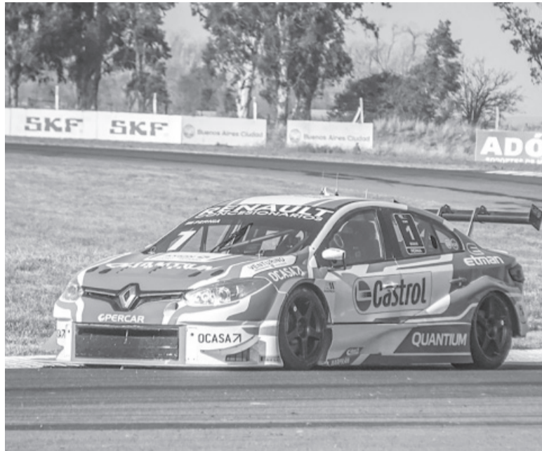
Imparable. Pernía es el campeón vigente y líder actual del torneo.

En tanto, en la primera final de la jornada, el cordobés Marques