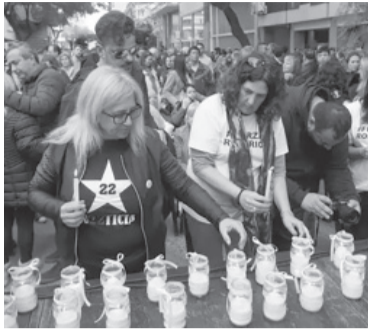
Acto en la calle Salta 2141.