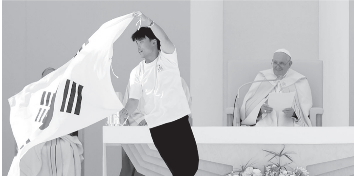
Hasta la próxima. Francisco cerró el encuentro de Portugal y anunció el de Corea del Sur.

Durante la homilía del domingo, el Papa se dirigió a los jóvenes que durante toda la semana