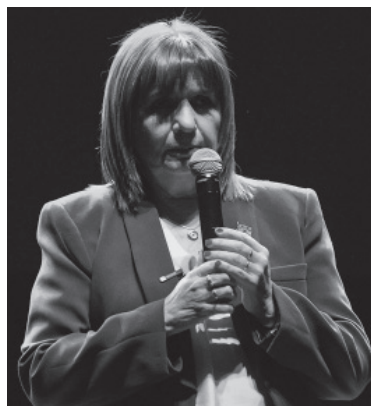
Bullrich, en Córdoba.

Los vecinos, amigos y familiares de Morena Domínguez se concentraban también en la Plaza Giardino, ubicada en la calle San Vladimiro 5540 de Lanús, para