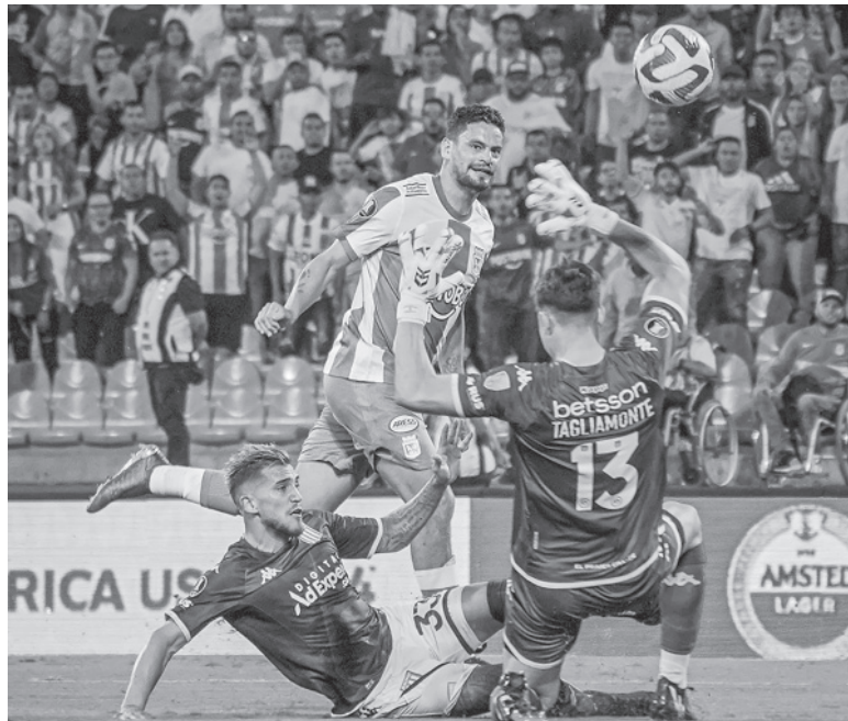
Cambiante. Racing perdía por tres, se acercó, pero volvió a pecar en el final.