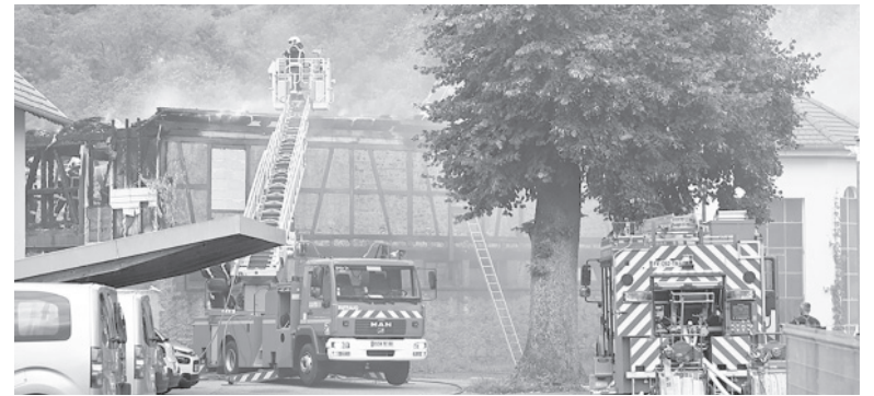
Incendio en un albergue de vacaciones.

Las víctimas del siniestro serían un cuidador y 10 adultos con discapacidad mental leve.