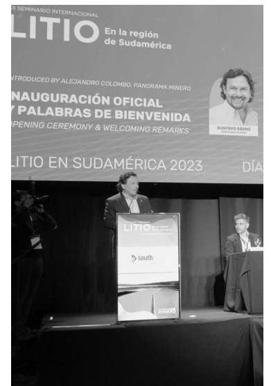
XII Seminario Internacional del Litio en Sudamérica.