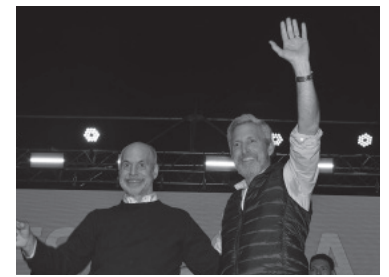
Larreta estuvo en Paraná.