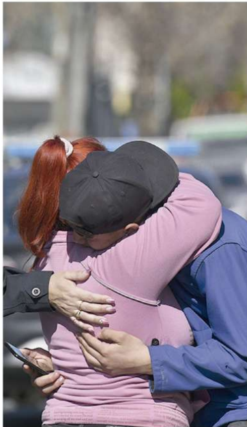
Marcha y dolor. Con choques con la policía, los vecinos se manifestaron en la comisaría 5ta y en el municipio.