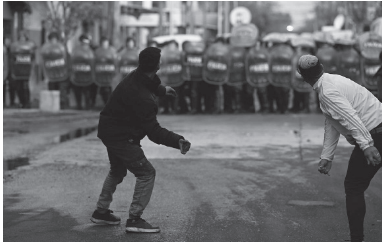
Incidentes. Vecinos de Lanús se acercaron a la comisaría 5ta. donde estaban alojados los presuntos asesinos.

pedir justicia y más seguridad en la zona.