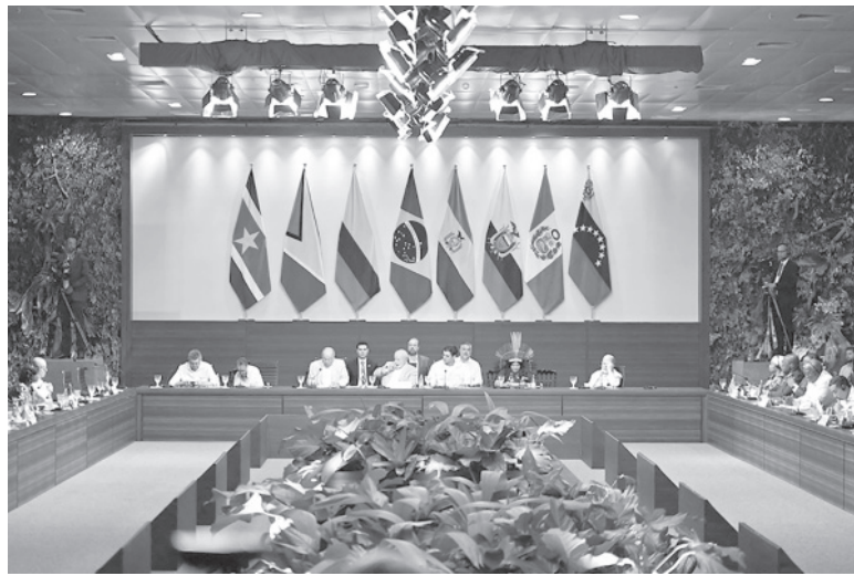
Brasil. Líderes de los países amazónicos en el cierre de la cumbre.

Lula y los demás líderes de los ocho países de la Organización del Tratado de Cooperación Amazónica (OTCA), que comparten territorio de selva, anunciaron ayer una alianza contra la deforestación, aunque sin