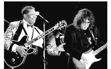
BB. King junto a Pappo.

A partir de allí, Norberto "Pappo" Napolitano y B.B. King entablaron una relación de mutuo cariño y respeto, que los reunió varias veces más en el escenario y que incluso tuvo momentos de intimidad familiar, como cuando la leyenda estadounidense fue a la casa del artista argentino en el barrio porteño de La Paternal a comer los famosos fideos que preparaba su madre.