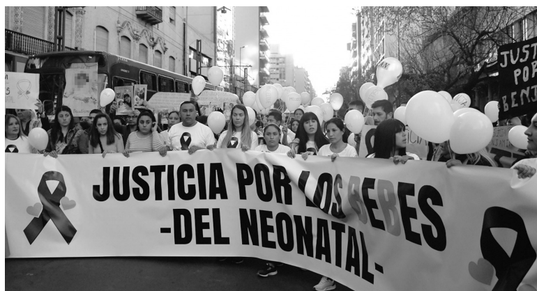
Manifestación. Las familias de las víctimas renovaron el reclamo para el esclarecimiento y justicia de esas muertes.