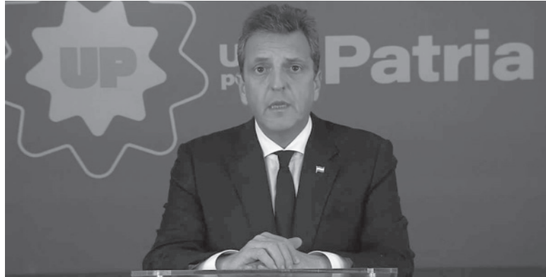
Pre-PASO. El titular de Hacienda afirmó que la Argentina “No es una sociedad fracasada”. - Captura de video -

El ministro señaló que “no somos esa sociedad fracasada de la que hablan ellos, no somos un país de mierda, somos un país que puede