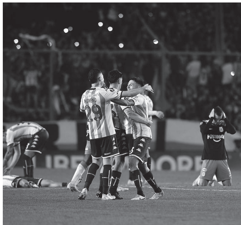
Cosa juzgada. Final del partido, Racing ganó 5-4 la serie.

Lo que siguió hasta el final fue un partido vibrante e intenso, típico de Copa Libertadores, con Racing tranquilo por la diferencia