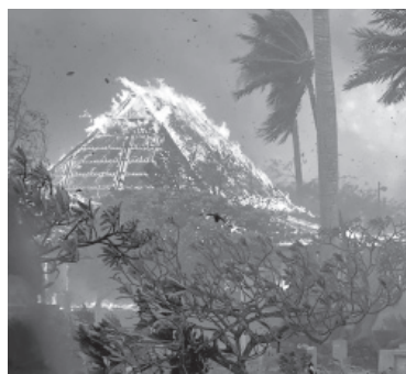
El condado de Maui, afectado. - CNN -

El presidente de Estados Unidos, Joe Biden, declaró ayer el estado de "catástrofe natural" para Hawái como consecuencia de los voraces incendios forestales que se desataron hace más de una semana, avanzan sobre la isla de Maui y provocaron la muerte de al menos 36 personas. Esta declaración permitirá liberar una importante ayuda federal para el archipiélago. Los focos ígneos comenzaron a primera hora del martes y pusieron en peligro viviendas, empresas y servicios públicos, así como a más de 35.000 personas en la isla de Maui, donde está Lahaina, informó en un co-