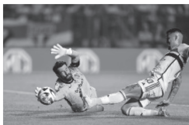
Luciano, 2-0 y serie liquidada. - Conmebol -

San Lorenzo quedó eliminado de la Copa Sudamericana al perder