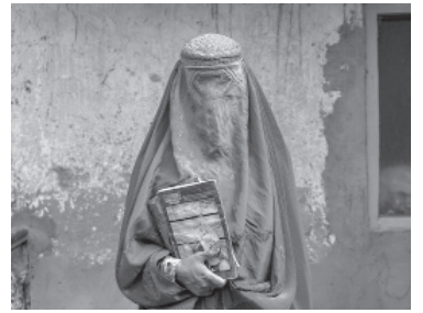
Destrato talibán hacia las mujeres. - Internet -

Afganistán.- El trato dado a las mujeres por el Gobierno talibán de Afganistán debería ser declarado "crimen contra la humanidad", afirmó el enviado de Naciones Unidas para la Educación, el ex primer ministro británico Gordon Brown. Desde su regreso al poder en agosto de 2021, las autoridades talibanas han tratado sistemáticamente a las mujeres de manera cruel y brutal, denunció el enviado. "Es probablemente la violación de derechos humanos más odiosa, más viciosa, más completa" que existe actualmente en el mundo, y a la que están sometidas "millones de niñas y mujeres en Afganistán", subrayó Brown, informó la agencia de noticias AFP. - Télam -