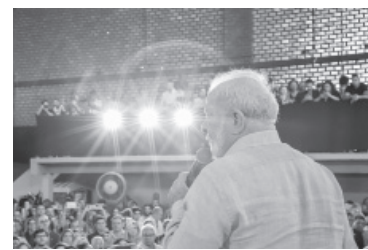
El mandatario lo calificó de "gatillo fácil".

"La policía tiene que saber diferenciar entre un delincuente y un pobre que caminar por la calle", aseguró el presidente durante un acto en Río de Janeiro, donde inauguró junto al gobernador Cas-