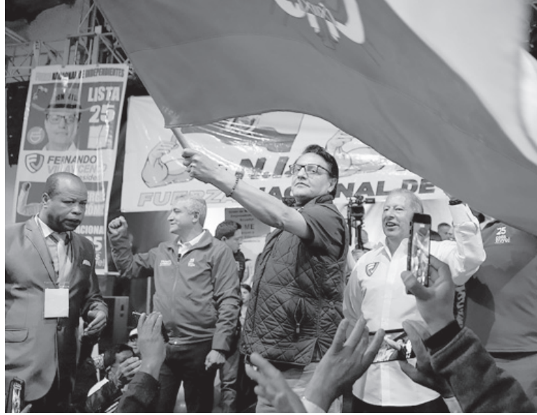
Cuenta regresiva. El periodista fue ultimado por sicarios a menos de dos semanas de las elecciones.

Villavicencio, de 59 años, fue baleado en la noche del miércoles al salir de un encuentro con simpatizantes en un colegio de Quito, en medio de una ola de violencia criminal en Ecuador atribuida a