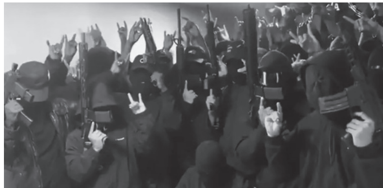
Los Lobos, presuntos autores. - Captura de video -

La autenticidad del video, sin embargo, fue puesta en duda por el expresidente Rafael Correa y por una ONG, entre otros usuarios en redes sociales, que aseguran que se trata de un video viejo con un audio falseado. - Télam -