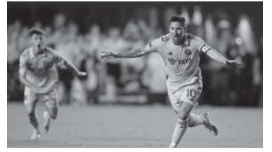
Messi, ahora en Inter Miami.