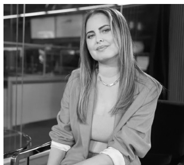
La modelo, internada. - Archivo -