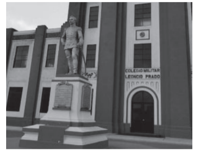
El frente del Instituto Leoncio Prado.

“Esta práctica (...) atenta contra la protección constitucional que