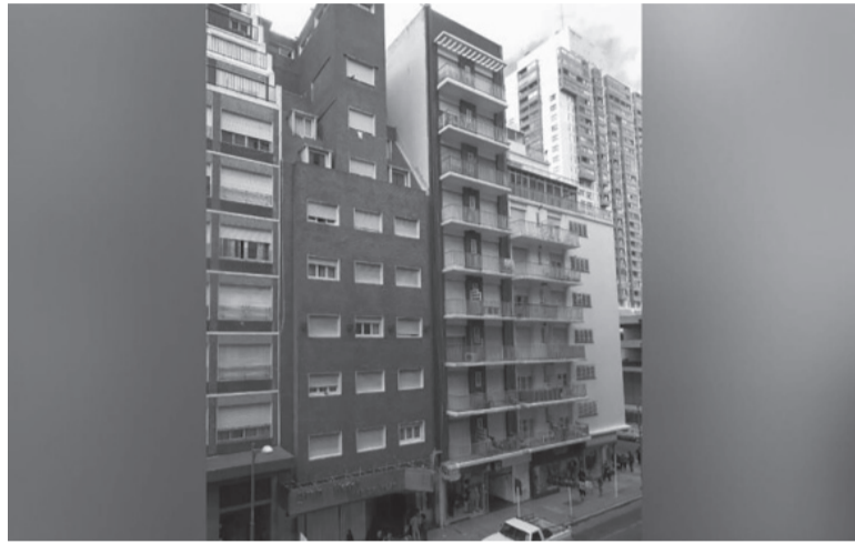
Lugar del hecho. El Gran Hotel Mar del Plata está ubicado en la calle Rivadavia 2235, de la ciudad balnearia.

Arévalo también dijo que se descarta, a prima facie, que la hayan empujado. “Si bien esta-