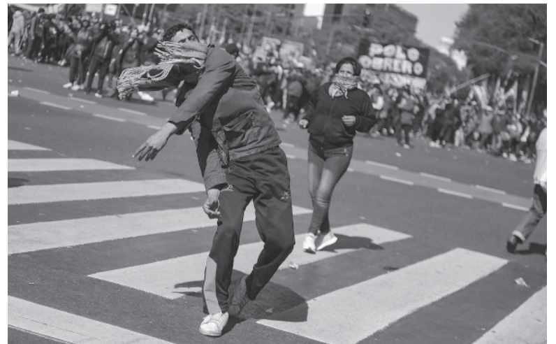
Tensión. El grueso de la movilización transcurrió sin inconvenientes, pero sobre el final llegó la violencia.

Cuando las piedras dejaron de ser arrojadas, una veintena de miembros de la Infantería de la policía porteña rodeó el edificio atacado. Y un grupo de al menos