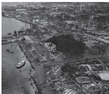
Muchos ciudadanos se arrojaron al agua para protegerse.

Los militares desplegaron tres helicópteros para ayudar a combatir los incendios, con los que se arrojaron 570.000 litros de agua para controlar los incendios, in-