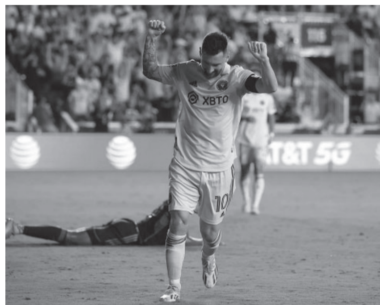
Nunca falta. Cuando se iba el partido, llegó el gol de Leo.

se, Cagliari y Juventus de Italia, Queens Park Rangers de Inglaterra, Olympique de Marsella de Francia, Fenerbahce de Turquía, Flamengo de Brasil y Universidad Católica de Chile. En este mercado de pases, Independiente ya incorporó a Federico Mancuello (ex Puebla de México), Alexis Canelo (ex Quilmes, proveniente de Tijuana de México) y Felipe Aguilar (ex Lanús). Con la llegada del jugador chileno y la vuelta del préstamo de Lucas González, ya son cinco los refuerzos que tiene a sus órdenes Ricardo Zielinski. El “Rojo” comenzará la Copa de la Liga Profesional como local contra Colón por la Zona 1. - Télam -