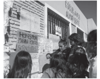
La Escuela Almafuerde.