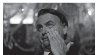
Los cuatro lotes fueron retirados un día antes de su último día.

“Las investigaciones realizadas indican que Jair Mesias Bolsonaro y su equipo utilizaron el avión presidencial para sacar del país los bienes de alto valor malversados, llevándolos a los Estados Unidos”, dice un extracto de la decisión del juez del Tribunal Supremo Federal (TSF)