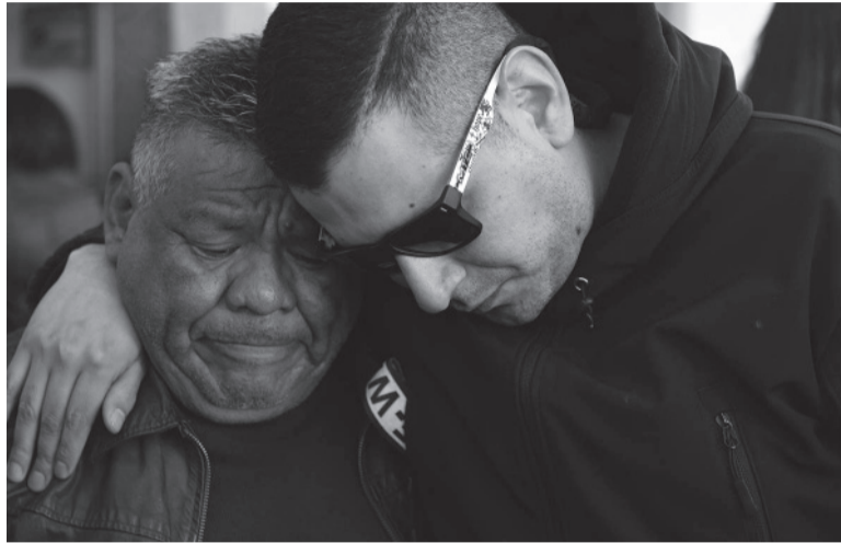
Velorio. Familiares, amigos, colegas y alumnos despidieron con dolor al médico.

Las fuentes consultadas indicaron que si bien por ahora no se concretó ninguna detención, la UFI 7 de Morón, a cargo del fiscal