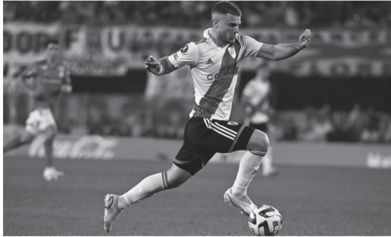
Agradecido. Así se fue el goleador del último torneo local. - CARP -