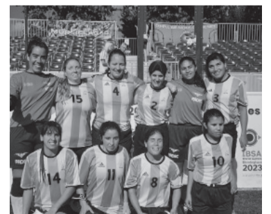
Vencieron 2-1 a Japón en la final.