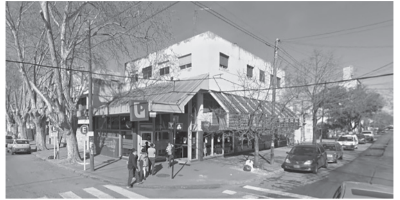
Tras 28 allanamientos cayó parte de la banda que intentó asaltar un banco de La Plata.

Se trata de una organización que había irrumpido con armas y chalecos antibala en la sede bancaria.