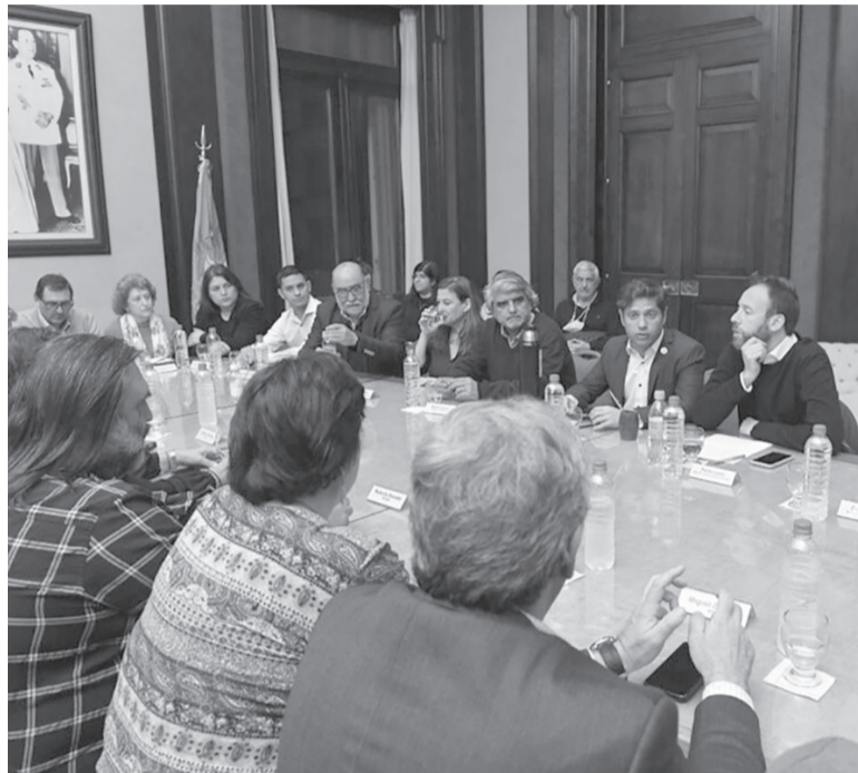
Sobre la mesa. Los gremios estatales reclaman ser convocados.

Entre los estatales, también se expresó la Federación de Gremios Estatales y Particulares bonaerense (Fegepba). La misma le mandó una nota al ministro de Trabajo, Walter Correa, en la que requirió por un "urgente llamado a la mesa de paritaria salarial" para "adelantar el acuerdo establecido para el mes de septiembre del incremento del 15% a la liquidación de los salarios del mes de agosto". Asimismo, desde otro sindicato