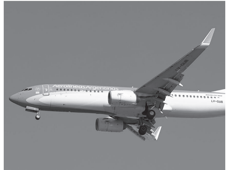
En discusión. Kirchner planteó que el objetivo es “proteger lo conseguido y ahuyentar a los ‘fantasmas privatizadores’”.

“Entendemos -continuó Rossi al hablar con Radio 10- que Argentina necesita un Gobierno de unidad nacional, porque nos enfrentamos a una situación de un espacio político que viene a romper todas las tradiciones políticas”. De esta forma, se expresó en línea con lo manifestado con el candidato presidencial Sergio Massa, quien en una entrevista con el diario Clarín señaló que, de ganar las elecciones, “sin dudas buscaría un Gobierno de unidad nacional e integrar un gabinete con radicales y con peronistas que hoy están en el PRO”. - DIB -