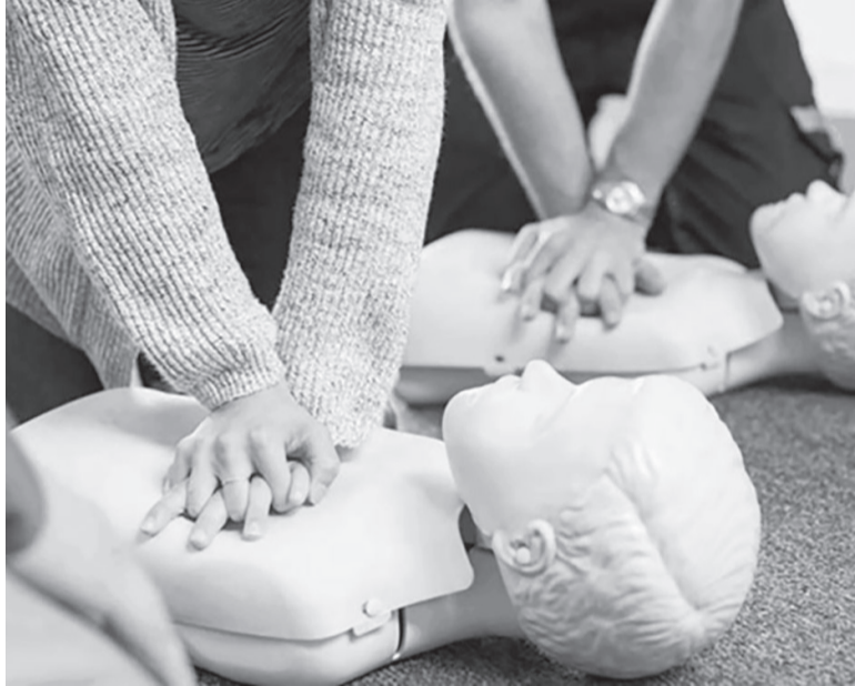
Capacitación. Una ínfima porción de la población está entrenada en maniobras de RCP.

del Consejo de Arritmias de la Sociedad de Cardiología, explicó que la mayoría de las veces la muerte súbita “ocurre secundaria a una arritmia, es decir que el corazón deja de latir normalmente y empieza a temblar. A ese temblor la medicina lo denomina fibrilación ventricular. Cuando tiembla, el corazón no puede contraerse y, entonces, no puede bombear sangre y así la víctima pierde el estado de conciencia y se desploma”.