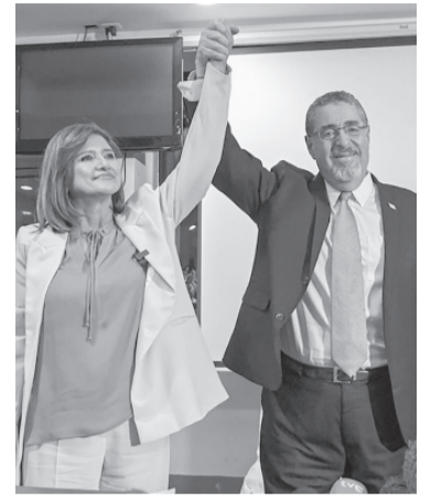
Bernardo Arévalo y la vice electa Karin Herrera.