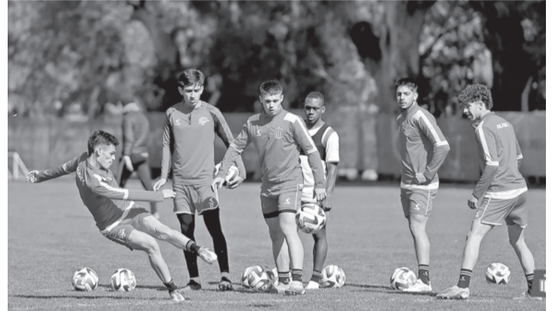
Último entrenamiento. Con la mente en la Sudamericana. - @EdelpOficial -

Árbitro: Jesús Valenzuela. Cancha: Neo Química Arena. Hora: 21.30 (DSports).