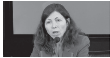
Batakis, ministra entre Guzmán y Massa.