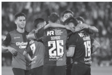
La "Lepra" comenzó con el pie derecho. - @Newells -

Newell's venció 2-0 a Central Córdoba, de Santiago del Estero, en un interesante encuentro jugado ayer a la noche en el estadio Coloso Bielsa, del Parque Independencia de Rosario, por la