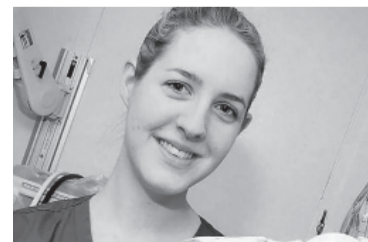
Lucy Letby.

Un tribunal británico condenó a prisión de por vida sin posibilidad de liberación a la enfermera hallada culpable de los asesinatos de siete recién nacidos y otros seis intentos de homicidio, un fallo histórico con una pena muy poco frecuente en la legislación inglesa debido a la “gravedad excepcional” de los crímenes. Lucy Letby, de 33 años, quien se negó a estar presente en la audiencia final celebrada en un tribunal de Manchester Crown, en el norte de Inglaterra, fue sentenciada a una pena considerada muy poco frecuente en