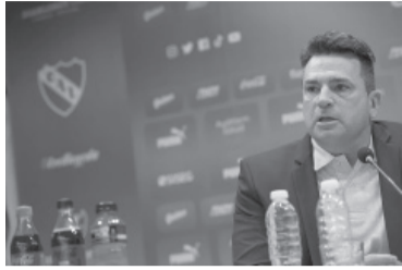
Duró solo unos meses.