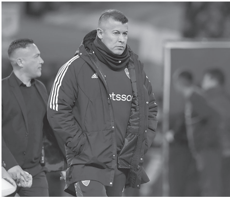
Interrogantes. El DT "xeneize" con indecisiones para el miércoles.

piensa que estos jugadores serían titulares inamovibles: Sergio Romero, Nicolás Figal, Marcos Rojo, Frank Fabra, Valentín Barco, Cristian Medina, "Pol" Fernández, Luis Advíncula y Cavani.