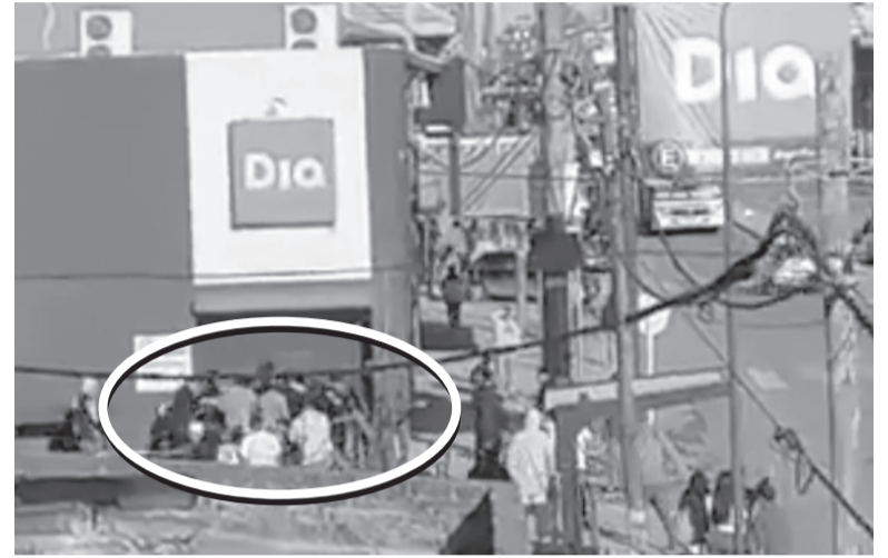
En redes. Patricia Bullrich publicó un video en su Twitter. - Captura de video -

Por su parte, el ministro de Seguridad bonaerense, Sergio Berni, dijo ayer: "Hoy lo llamativo es que durante el día empezó una cam-