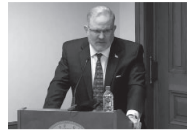
Scott Hall.