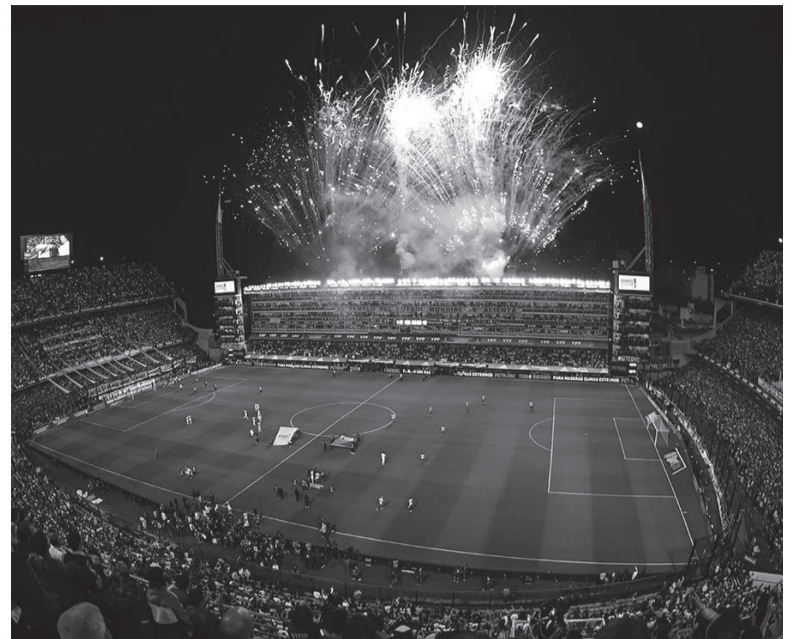
Escenario. El Alberto J. Armando ante una nueva noche de Copa.

Árbitro: Wilton Sampaio (Brasil) Cancha: Alberto J. Armando. Hora: 21.30 (Fox Sports y Telefé).