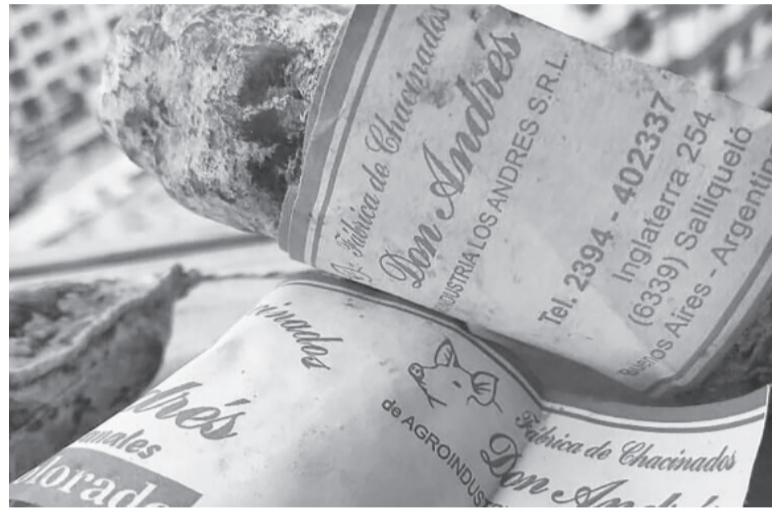
Positivos. La triquinosis es una enfermedad parasitaria causada por larvas y parásitos. - DIB -

El brote de Salliqueló, por el que se emitió una alerta epidemiológica el lunes 7 de agosto, abarcó a ese municipio y a Adolfo Alsina, Bahía Blanca, Coronel Suárez, Puán y Saavedra. El mismo