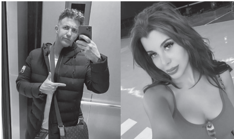
Citada. Charlotte Caniggia desmintió tener vínculo con "Lechuga".

de la Policía de la Ciudad sostuvo que el empresario lo citó en una oficina de Puerto Madero, "muy ostentosa, donde había muchas computadoras, con chicos haciendo 'trading'", que según dichos de la propia víctima "se la había prestado Charlotte Caniggia", conocida mediáticamente por haber participado en distintos programas de televisión.