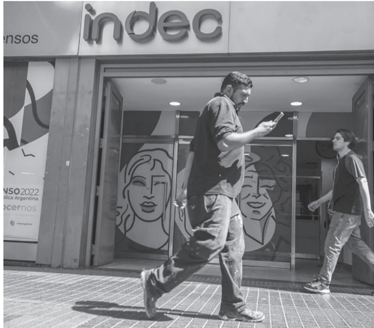
Para arriba. Los productos nacionales tuvieron un incremento del 7% en julio. - Archivo -

El intercambio comercial durante julio cerró con un déficit de US$ 649 millones, por encima del resultado negativo de US$ 484 millones registrado en igual mes del año pasado, informó ayer el Instituto Nacional de Estadística y Censos (Indec). En julio, las exportaciones sumaron US$ 6.060 millones, un 22,4% menos que en el séptimo mes del año pasado, mientras que las importaciones sumaron US$ 6.709 millones, con un retroceso del 19,1% interanual. La retracción del 22,4% en las exportaciones se explicó esencialmente al impacto de la sequía sobre la producción del sector agropecuario. - Télam -