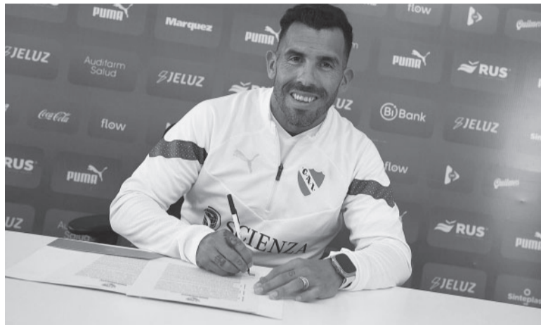
Día 1. Contrato por un año, con opción a rescindir en diciembre. - CAI -

"Porque en este momento no se puede hablar de proyecto, y hacerlo es no entender la situación