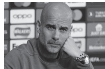
Volverá después de la fecha FIFA.