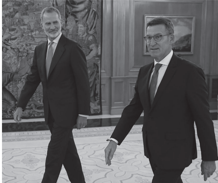
Ronda de consultas. El rey Felipe VI y el titular del Partido Popular (PP), Alberto Núñez Feijóo.

Ayer por la tarde el monarca le comunicó su decisión a la presidenta del Congreso, Francina Armengol, quien hizo pública la información al salir de esa en-