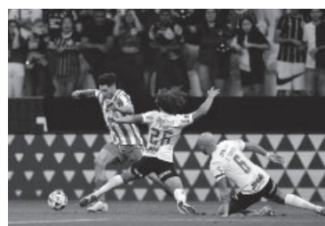
Sosa, el mejor del equipo argentino.

El "Pincha" hizo un buen partido en Brasil, pero pagó caro una desatención en una pelota parada.