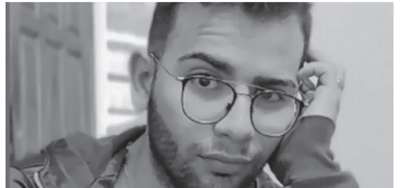
César Sena más los cuatro imputados seguirán detenidos. - Archivo -

El fallo fue dado a conocer ayer por el femicidio de Cecilia Strzyzowski.