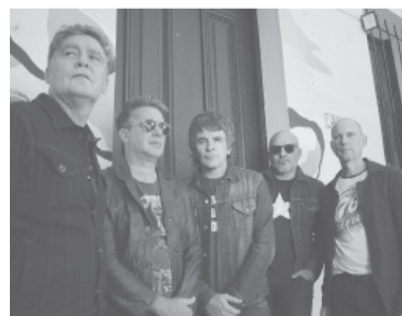
La banda de Castelar llega a la capital provincial.

Según detalló el medio Ecos Diarios de Necochea, se registró la muerte de un número no determinado de lobos marinos de la colonia local y la presencia de otros con visibles síntomas de enfermedad. - DIB -