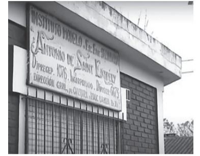
Colegio Saint Exupery. - Captura de video -