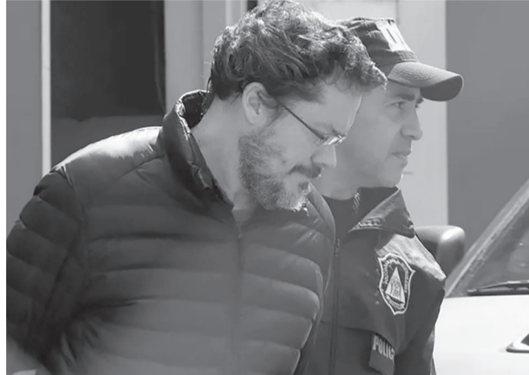
Hijo menor. A un año del doble crimen del matrimonio Del Rio.

Tal como solicitaron el 17 de julio pasado en su requerimiento