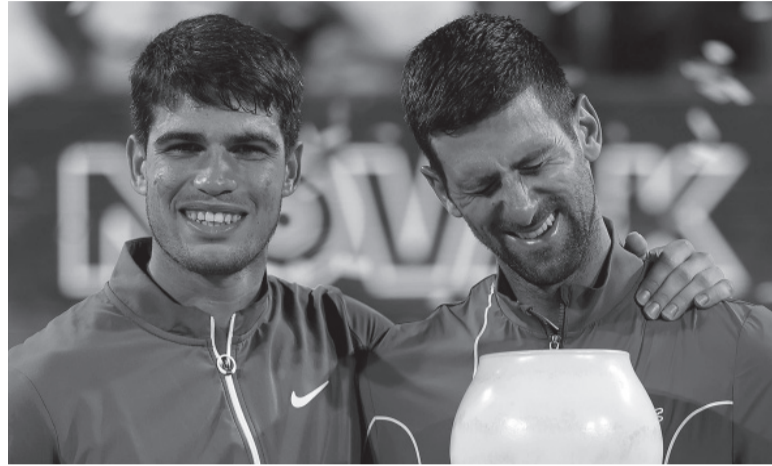
Candidatos. Alcaraz y Djokovic, el 1 y el 2 del mundo.

Francisco Cerúndolo, ubicado en el puesto 20 del ranking ATP, y Tomás Martín Etcheverry (32) enfrentarán en la primera ronda a ju-