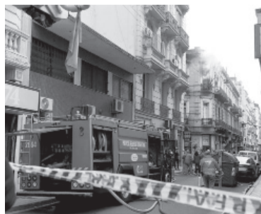
Rescate a una mujer de 65 años.

El foco ígneo se desató en el segundo piso de un edificio de tres plantas ubicado en la esquina de las calles Bartolomé Mitre y Libertad, a donde arribó también personal de Policía y del Sistema de Atención Médica de Emergencias (SAME).