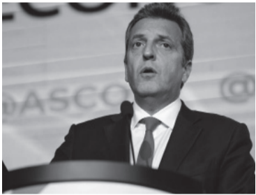
El ministro de Economía, tajante.

El ministro de Economía y candidato a presidente por Unión por la Patria, Sergio Massa, afirmó ayer que "la discusión de fondo es si Argentina es un país primarizado o industrial", al referirse a la elección presidencial de octu-