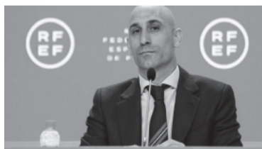
Rubiales tuvo una conducta repudiable.

FIFA no ofrecerá más información sobre este procedimiento disciplinario hasta la adopción de una decisión final sobre el mismo", aclaró la máxima entidad en un comunicado.