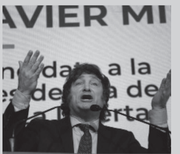
El líder La Libertad Avanza.

"El origen de la decadencia, lo hemos sistematizado como lo que definimos como el modelo de la casta: dicen que 'donde hay una necesidad nace un derecho', el problema radica es en que las necesidades son infinitas y si hay un derecho alguien lo tiene que pagar y los recursos son finitos", diagnosticó el libertario. El diputado fue el encargado