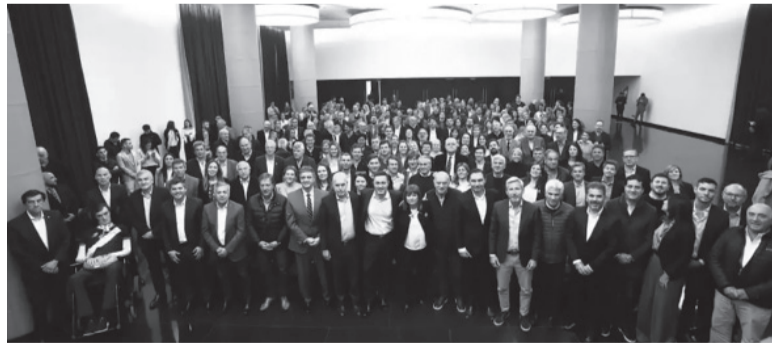
La candidata, junto a 300 representantes del PRO.

La candidata a la presidencia de la Nación por Juntos por el Cambio, Patricia Bullrich, reunió a los principales dirigentes del espacio, incluido Horacio Rodríguez Larreta, y selló una foto de unidad de cara a las elecciones generales del próximo 22 de octubre. Mauricio Macri no estuvo pero dejó un gesto en twitter. En sus redes sociales, Bullrich publicó un breve texto que tituló "Le exigimos al kirchnerismo que cuide a los argentinos". "No regalemos el poder", arengó fuertemente Bullrich, en relación con la amenaza que