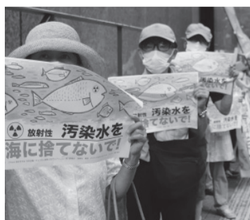
Protestas contra la decisión nipona.

Golpeada por un terremoto de magnitud 9,0 y un tsunami posterior el 11 de marzo de 2011, la planta sufrió fusiones en los núcleos que liberaron radiación, lo que resultó en un accidente nuclear de nivel 7, el más alto en la Escala Internacional de Eventos Nucleares y Radiológicos. La planta ha estado