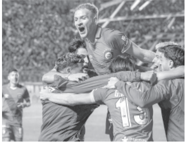
El "Bicho" quiere un nuevo triunfo.