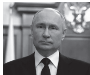
El presidente de Rusia, Vladimir Putin.

Yevgueni Prigozhin, que lideró en junio una sublevación contra el Ejército ruso, falleció en el accidente.