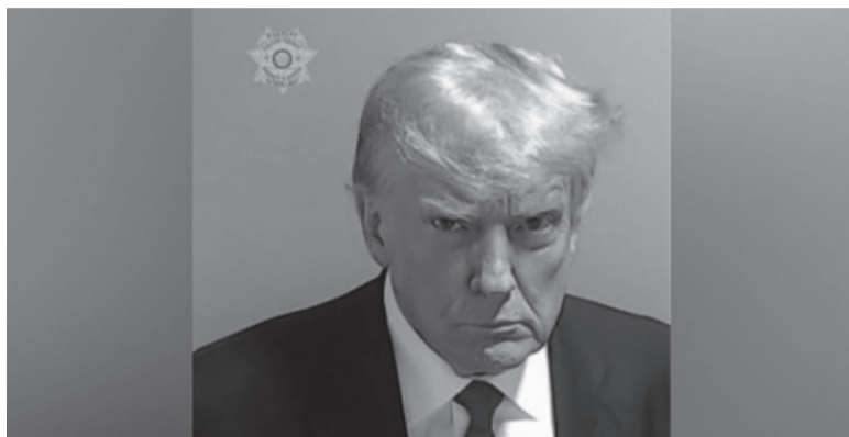
Inédito. El expresidente Trump, fichado en la cárcel de Fulton.

la sede policial y prisión de Atlanta fue acompañada por un fuerte operativo policial y acordonamiento de la zona, que impidió el acceso al complejo carcelario mientras duró el procedimiento. El fichaje incluyó la impresión de sus huellas dactilares, las dos clásicas fotografías de frente y perfil, el escaneo ocular para la identificación biométrica y algunos datos personales.