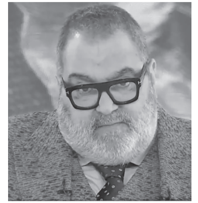
El periodista ingresó al Favalaro.