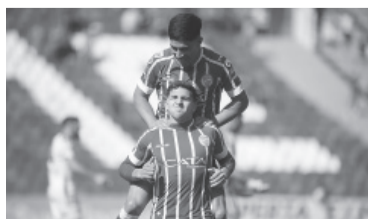
Festejo "Tomba" en Mendoza.

Central Córdoba, que sumó su sexto tropiezo consecutivo (incluidos cuatro encuentros por el anterior torneo de la LPF) - Télam -