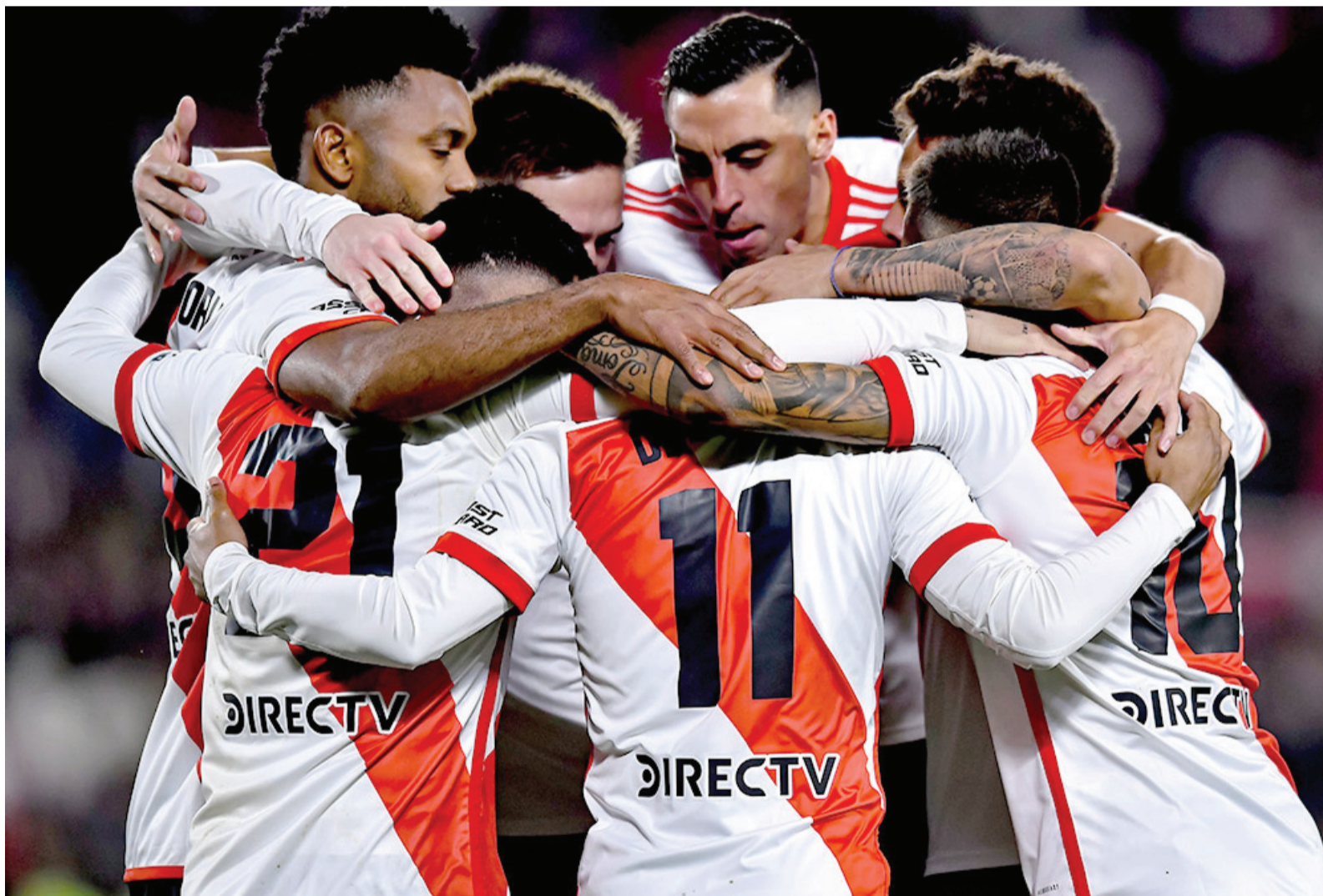
Una aplanadora. River goleó 5-1 a Barracas Central en el cierre del domingo.