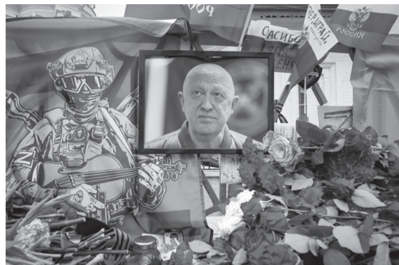
Altar. Conmoción por la muerte de Yevgueni Prigozhin.