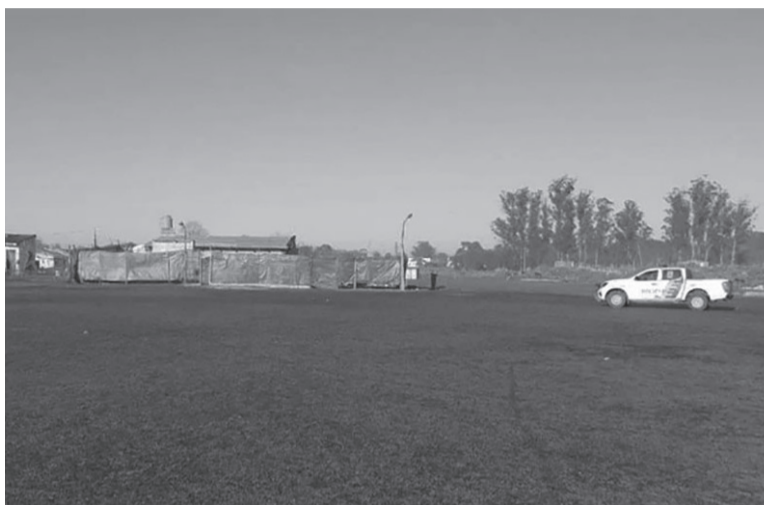
El lugar. El hecho se produjo en el fondo de una propiedad en el barrio Parque Hermoso. - La Capital -

Fuentes de la investigación informaron que un llamado al 911 alertó minutos después de las 7 de la mañana sobre ruidos de disparos en el predio ubicado en avenida Mario Bravo y Andrés Mac Gaul. En ese contexto, personal de la Subcomisaría Parque Hermoso y la Comisaría 16ª acudieron al lugar, en el cual encontraron vainas servidas, botellas de vino, rastros de sangre, "signos de arrastre", una carabina, dos envoltorios con cocaína y un teléfono celular. Luego de eso, los efectivos rodearon el perímetro del inmueble, donde fueron hallados los cuerpos en el