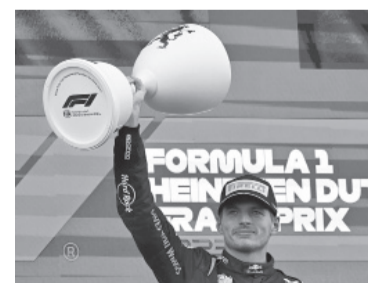
El conductor de Red Bull llegó a las nueve consecutivas. - Télam -

"Después de un sábado complicado pudimos mejorar bastante. El auto andaba bien en las rectas y tenía algunos inconvenientes en los sectores trabados. Pero, por suerte, lo pudimos aguantar hasta el final", consideró Girolami, en declaraciones a TyC Sports. - Télam -