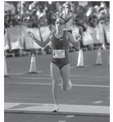
La atleta marplatense rumbo a la meta.