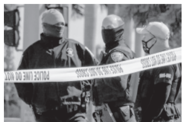
El atacante se suicidó.