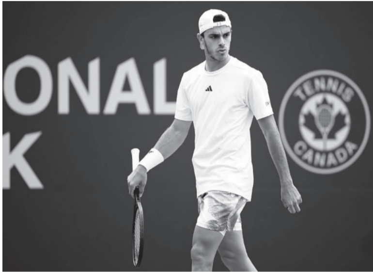
Calienta motores. Cerúndolo buscará su primer triunfo.

Pero Rossi tuvo menos suerte en la segunda carrera de domingo, la que se erigió en la número 600 en el historial del Stock Car, luego de 44 temporadas de trayectoria.