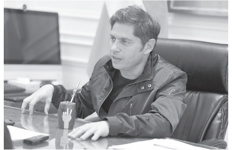
En estudio. El Gobernador y el anuncio del ministro Massa.

El Gobernador también se refirió a la posible implementación de la suma fija en municipios y señaló que "muchos jefes comunales acompañarán las medidas nacionales". "Cuando un intendente tenga una dificultad, lo escucharemos", agregó en referencia a la posible asistencia de Provincia a gobiernos locales. Por otro lado, ante la consulta de la agencia DIB, fuentes gremiales señalaron que "viene avanzando" una "posible