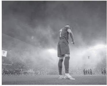
Venía de un triplete. - Al Nassr -