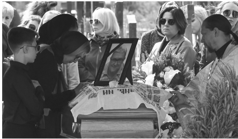
Intimidad. La despedida al jefe del grupo paramilitar ruso.

Horas antes de conocerse la información sobre el funeral del jefe de Wagner, el Kremlin informó que Putin no tenía previsto asistir a la ceremonia. “La presencia del presidente no está prevista, no tenemos información específica sobre los funerales”, manifestó el portavoz del Kremlin, Dmitri Peskov. “La