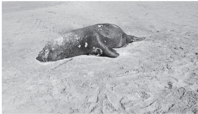
Caso. El ejemplar fue hallado muerto en la localidad de Las Gaviotas.

A partir de los brotes registrados en las colonias de lobos marinos de Mar del Plata y Necochea, el Municipio de Villa Gesell, a cargo de Gustavo Barrera, estableció en los últimos días un protocolo para evaluar y monitorear la situación en el distrito, desplegar tareas de prevención y control, y analizar posibles respuestas ante emergencias.