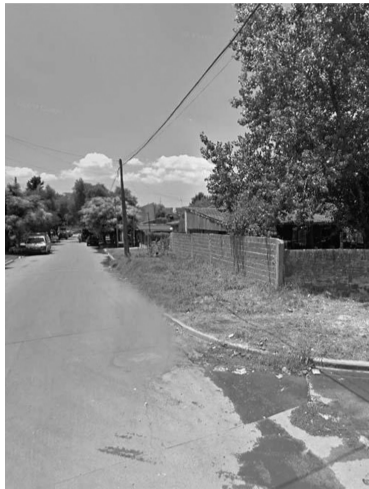
La esquina de Villa Ariza, partido de Ituzaingó, donde fue baleado un supuesto ladrón.

De acuerdo a las primeras averiguaciones de los efectivos policiales de la zona, el supuesto ladrón, al ver que el conductor estaba armado, quiso escapar y comenzó a correr, aunque fue perseguido y baleado en la cabeza, a metros de un establecimiento donde se festejaba un cumpleaños infantil, dijeron los vecinos.