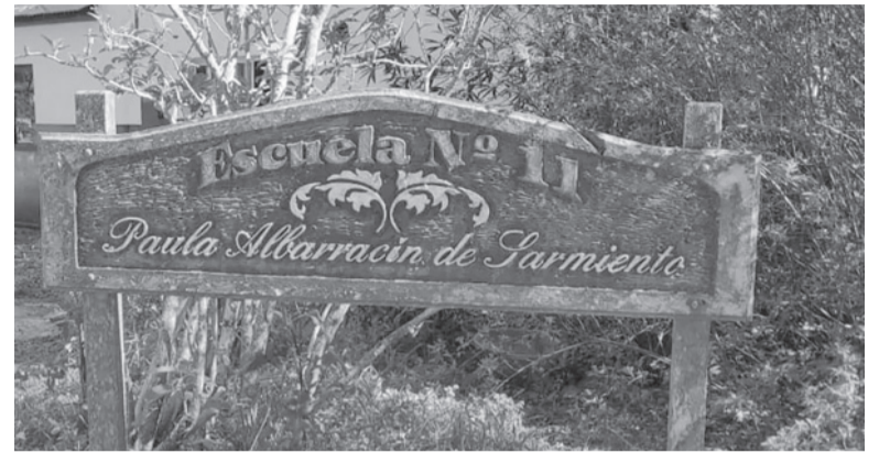
Personal policial aprehendió al atacante en la escuela. - Urgente24 -

El hecho ocurrió en la Escuela N° 11, dentro de un barrio cerrado de Escobar.