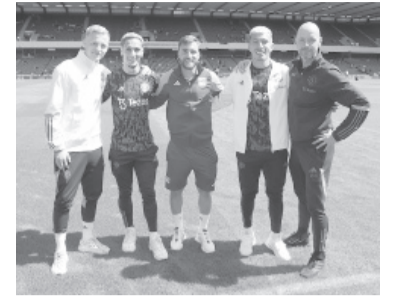
El lateral, pretendido por Ten Hag. - @nico_taglia -