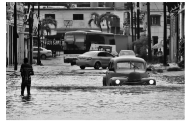
El paso de Idalia por Cuba.