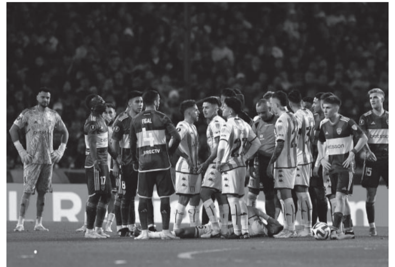
Todo o nada. Uno seguirá en carrera, el otro quedará eliminado. - Twitter -

El resto del equipo será el mismo que Almirón paró en la ida y además respetará el esquema táctico de tres defensores cen-