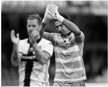
El arquero italiano. - @gianluigibuffon -