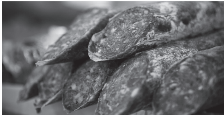
Positivos. La triquinosis es una enfermedad parasitaria que afecta al ser humano y a otros animales.

Los casos confirmados pertenecen a los municipios de Junín, Chivilcoy y Lezama. En tanto, los brotes se detectaron en Chivilcoy,