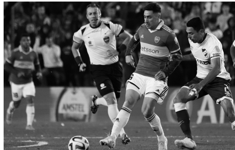
Paridad. Serie abierta entre el "Xeneize" y el "Bolso".

Colocó en el medio a Jorman Campuzano con Alan Varela, a Cris-