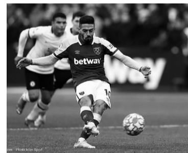
Viene de jugar en el West Ham de Inglaterra.

“No depende tanto de nosotros. Somos optimistas que en las próximas horas o días se pueda concretar. Lo del ‘Pity’ es un interés de