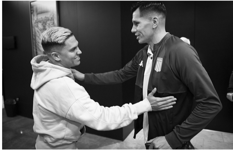
Compañero nuevo. Mientras tanto, llegó Quintero. - Racing -