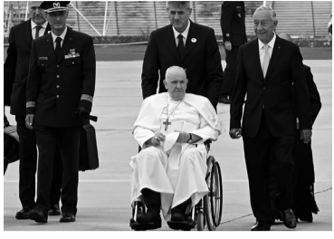
El papa Francisco en Portugal.