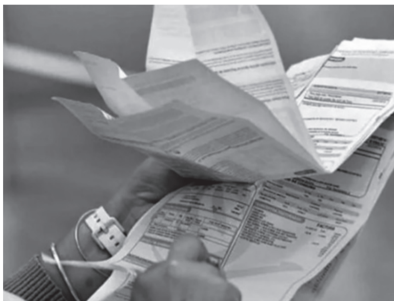
AMBA. Las tarifas subieron muy fuerte también para las clases medias y los comercios.

Diversos usuarios expresaron su descontento en las redes sociales como consecuencia de las subas, con un caso que de abonar $ 11.414,3 pasaron a pagar $ 57.752,96. Otro usuario señaló que su factura subió de $ 28.000 a $ 84.000 y que la empresa le informó que se duplicó el kilovatio