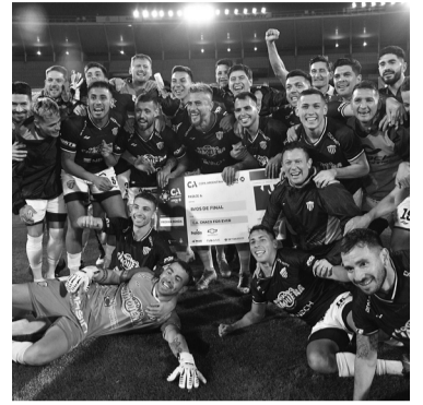
Dieron el batacazo.