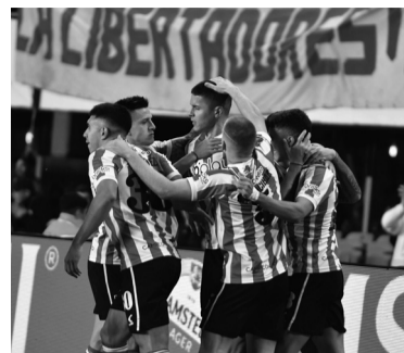
3-0 en la ida.