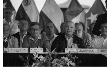
La sociedad incluida en el proceso de paz. - Web -