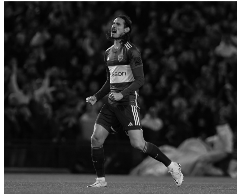
"Uruguayo, uruguayo". Primera gran ovación para el delantero.

Árbitro: Pablo Dóvalo. Cancha: Ricardo Enrique Bochini. Hora: 16.30 (TNT Sports).