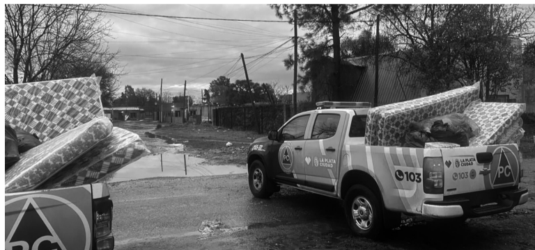
Se realizaron ayer alrededor de 500 asistencias.