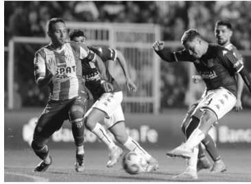
Paridad en Santa Fe.