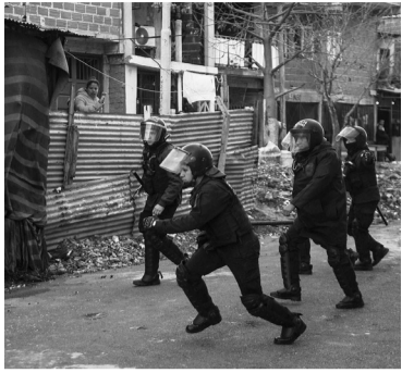
El lugar estaba deshabitado.