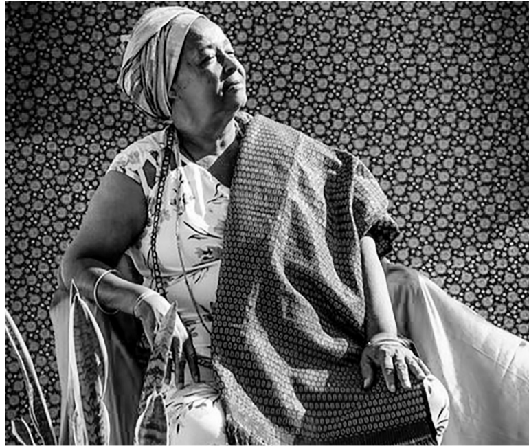
Dolor. La mujer estaba amenazada de muerte por su labor social.

La ministra de Igualdad Racial designada por el presidente Luiz Inácio Lula da Silva, Anielle Franco, vinculó el caso a la violencia religiosa, ya que los asesinos invadieron el terreiro, como se llama al espacio