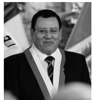
Soto promovió una ley... que lo favorece. - Archivo -

República Dominicana.- El número de personas fallecidas por la explosión registrada el lunes en una zona comercial del sur de República Dominicana se elevó a 28 luego de que se registró la muerte el jueves por la noche de un hombre que estaba internado en un hospital que había sido víctima del estallido, informaron ayer las autoridades locales. Según la prensa local, el hombre fallecido en la terapia intensiva del hospital regional Juan Pablo Pina de San Cristóbal había ingresado con quemaduras en el 98% del cuerpo y todavía no pudo ser identificado. La explosión se registró el lunes de tarde en San Cristóbal, a 24 km de la capital dominicana Santo Domingo, y las causas del siniestro aún están siendo investigadas. - Télam -