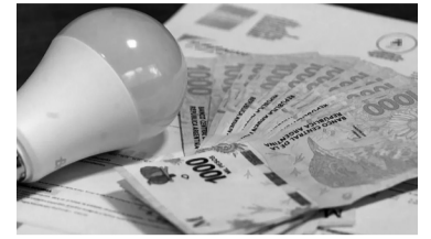
Las facturas de luz, más cargadas. - Internet -