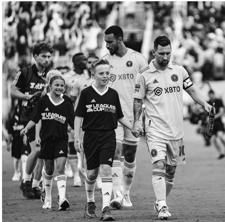
Único. El guía de la franquicia de La Florida. - InterMiami -

Inter Miami avanzó a la final de la Leagues Cup después de vencer en fila a Cruz Azul de México (2-1), Atlanta United (4-0), Orlando City