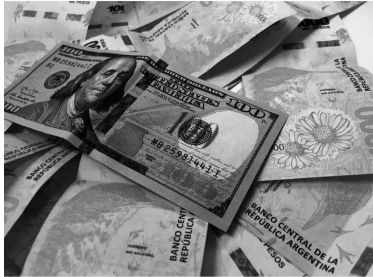
Pausa. Las últimas dos ruedas de la semana le dieron un respiro al crecimiento del informal.

En la bolsa de comercio el dólar Contado con Liquidación (CCL) consolidó su precio por arriba de los $700 y el MEP subió