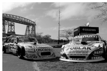
"La Máxima" en suelo porteño.

Canapino, cuatro veces campeón (2010, 2017, 2018, 2019), arribó en las últimas horas al país y volverá a tripular un Chevrolet del equipo JP Carrera. El piloto bonaerense, que está interviniendo en