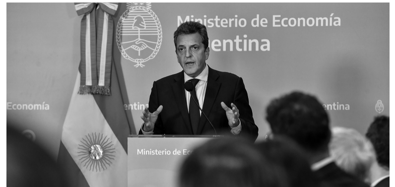
Fuerte. El reclamo del ministro de Economía no pasó inadvertido.

Frente a las propuestas de Javier Milei de avanzar en profundas reformas educativas en la escuela pública y recorte del Estado, Massa destacó: "Llegó el momento de que aquellos que creemos que el Esta-