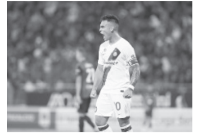
El "Toro" sigue imparabile. - @Inter_es -