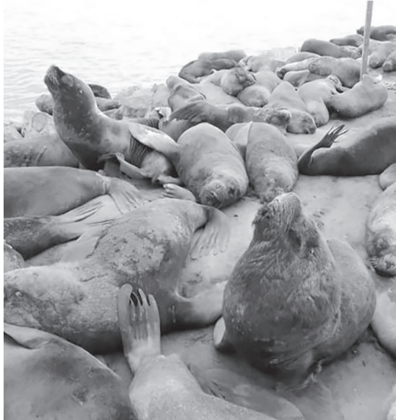
Mortal. El virus "es muy agresivo y se transmite con rapidez".

"Se piensa que el virus bajó por el (Océano) Pacífico, afectó a colonias de lobos marinos de un pelo en Chile, pasó a Argentina por Tierra del Fuego y alcanzó a otras provincias como Río Negro, donde hay una gran colonia de estos animales. Ahora hay lobos infectados a lo largo de toda la costa bonaerense", aseveró. Los síntomas que manifiestan los lobos marinos infectados por Influenza Aviar Altamente Patógena (IAAP) H5 son muy notorios: presentan temblequeo, convulsiones, se los ve deprimidos, casi sin movimiento, y al poco tiempo mueren, indi-