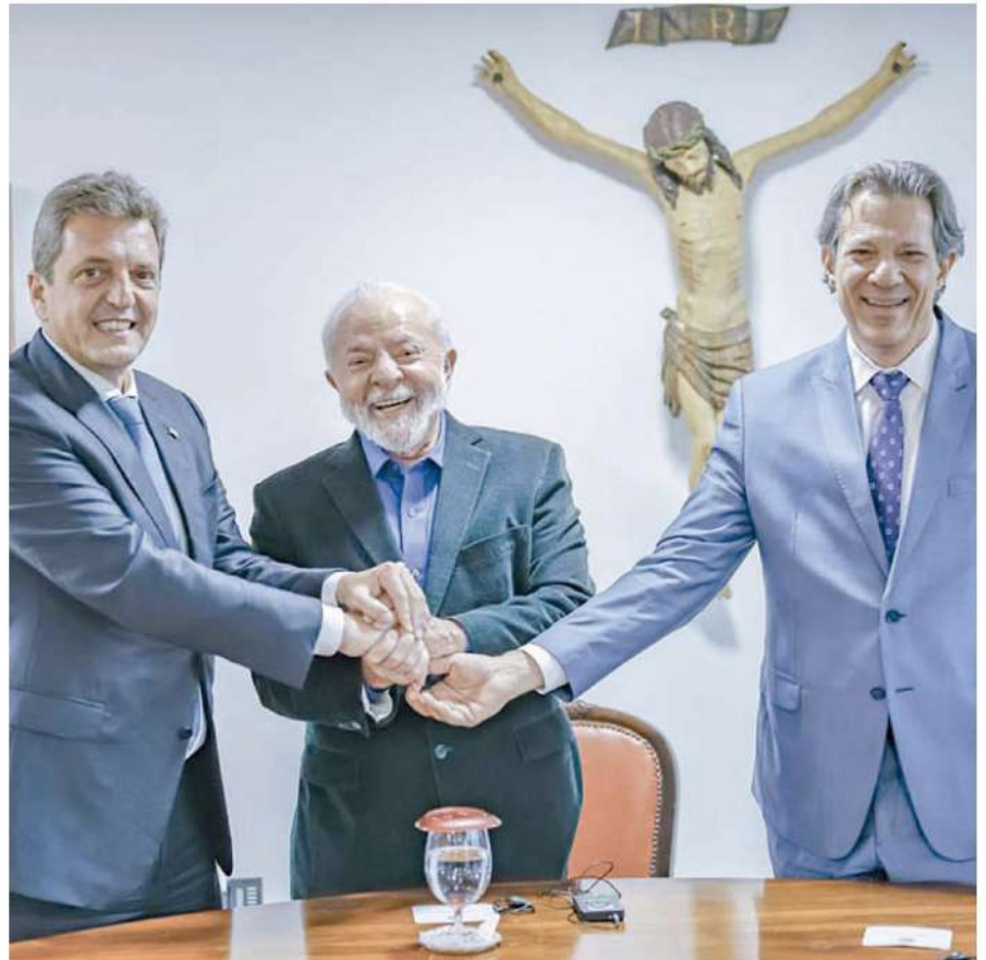
Recepción. Sergio Massa junto a su par brasileño, Fernando Haddad, y el presidente Lula Da Silva. - Economía -

Es para evitar tener que hacer uso de dólares o yuanes de las reservas. El sistema está destinado, principalmente, a mantener el flujo comercial de dos de los sectores en los que la vinculación existe entre ambos países: automotor y alimentos. - Pág. 3 -