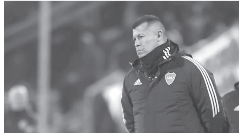
Con expectativas. El DT ante un desafío clave.

Martínez, de 30 años, se lesionó en la vuelta ante Atlético Nacional de Colombia, en el que la Academia remontó la derrota 4 a 2