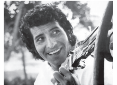
Víctor Jara.