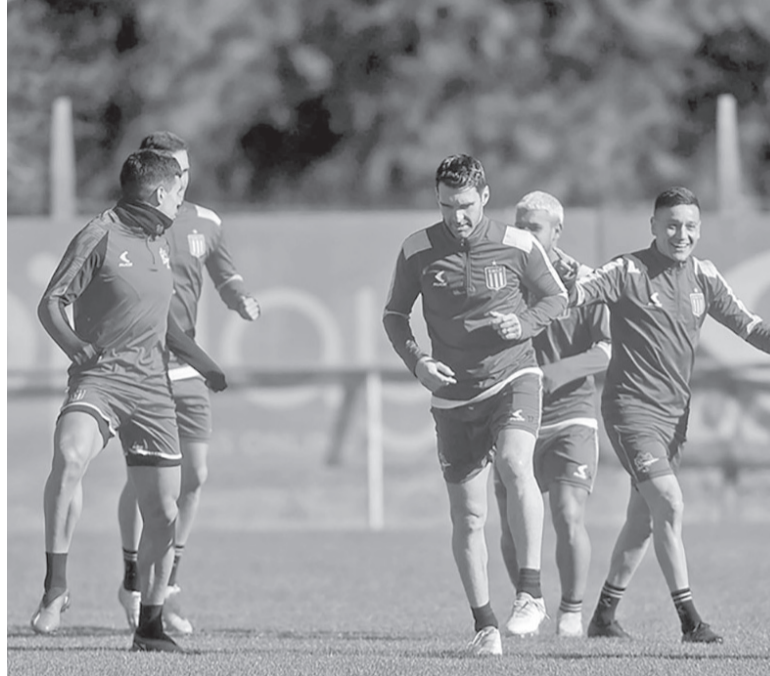
Enfocados. El "León" quiere seguir rugiendo.