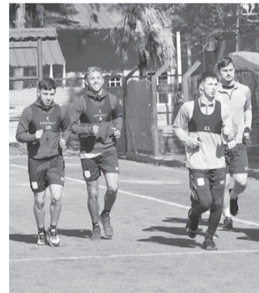
Racing quiere meterse en semifinales.

Los tres jugaron el domingo en Junín en la derrota por 1-0 ante Sarmiento: Janson y Zeballos estuvieron desde el inicio, mientras que Merentiel ingresó en el segundo tiempo por el ex Vélez. - Télam -