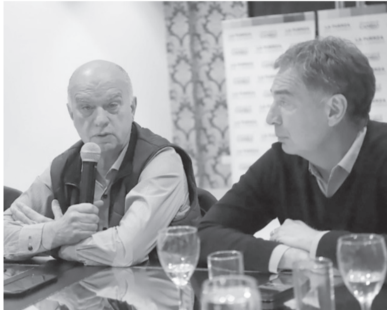
Pos PASO. El candidato a gobernador, Grindetti, con su rival en la interna. - JxC -

De esta manera, Santilli se mostró a disposición de la campaña de la candidata presidencial de JxC, Patricia Bullrich, quien buscará en las próximas horas sumar a Horacio Rodríguez Larreta, Facundo Manes y María Eugenia Vidal a las recorridas por el territorio bonaerense para así crecer electoralmente en este distrito clave. Grindetti y Santilli, más allá de la competencia