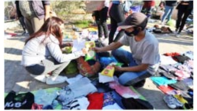
Argentina recurre al trueque ante la crisis económica.

Obra de pavimento en nuestra ciudad. El anuncio de una propuesta ya casi finalizada abarca las calles Combate de San Lorenzo y otras arterias circundantes.