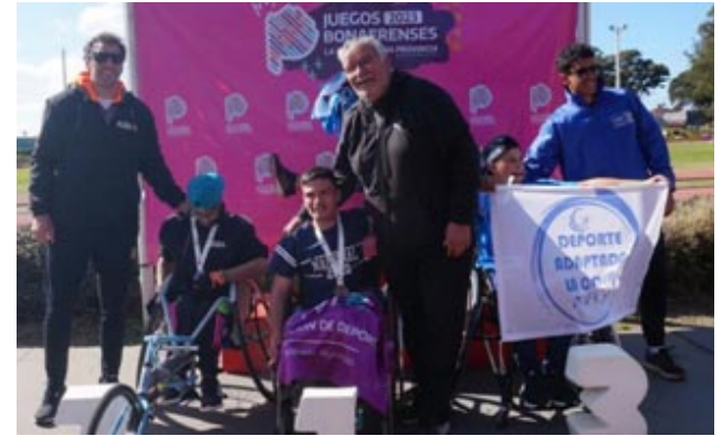
el vecindario ha preparado una bandera que expresa "Nos alegra tu sana obligación de ganar".

Tomás vive en la calle Mendoza del barrio Villa Cano y todo