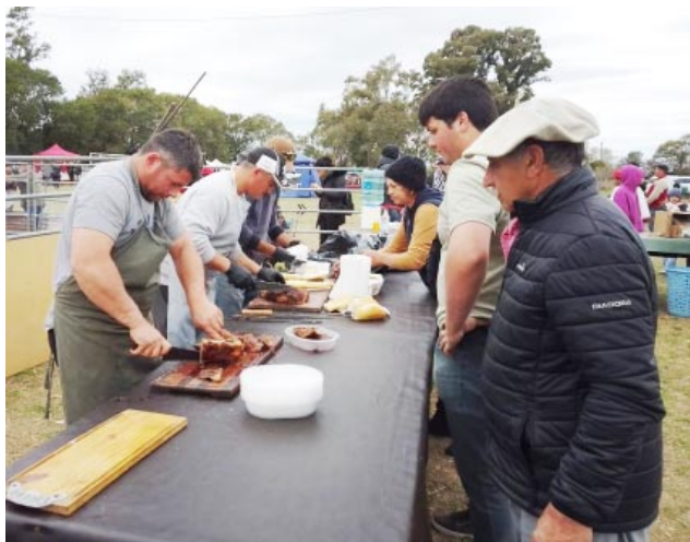
Fue un evento organizado en conjunto por la comisión de

-El día domingo se desarrolló la primera Fiesta del Asado en la Localidad de Dennehy, partido de 9 de Julio. Fue un evento gastronómico y cultural que reunió un gran marco de público y contó con la presentación de artesanos y espectáculos musicales.