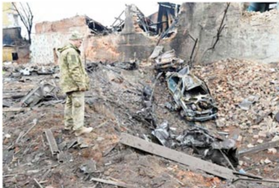
Destrozos en Ucrania donde parece anidar la crueldad.

El Papa Francisco predica cada día el ruego por la Paz en el mundo, en especial después de la invasión de Rusia a Ucrania. La rutina de cada día termina por acostumbrar, que de la destrucción y muerte se puede retornar al día siguiente y no es tan así.