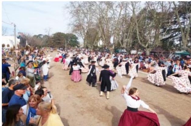
Con bailes tradicionales, en las calles de Comodoro Py se celebró la Fiesta del Chorizo Seco