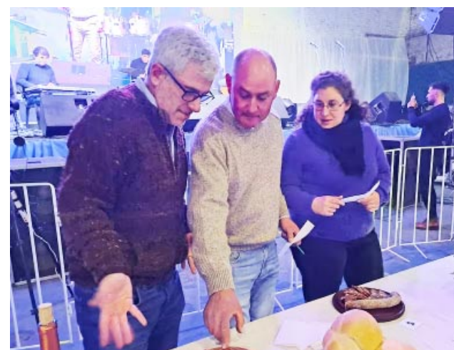
El jurado del concurso del Chorizo Seco, en plena labor