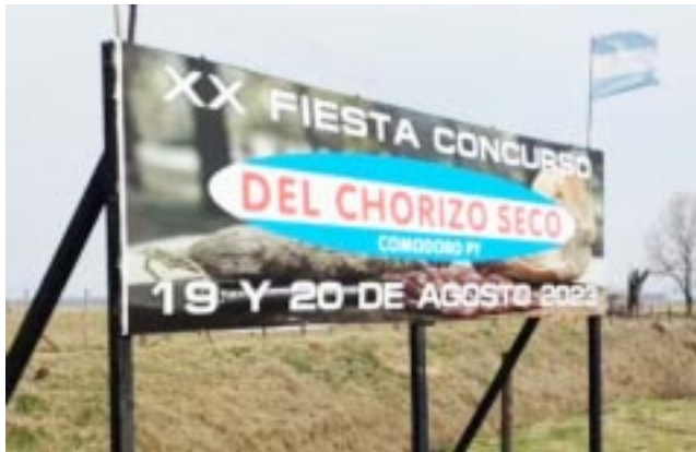
Hace 20 años que en Comodoro Py se celebra la Fiesta del Chorizo Seco

En la localidad bonaerense de Comodoro Py, a unos 30 kilómetros de Bragado, hace más de dos décadas los vecinos del lugar celebran la Fiesta del Chorizo Seco