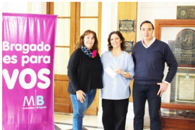
instituciones educativas, respaldando así proyectos y actividades formativas.