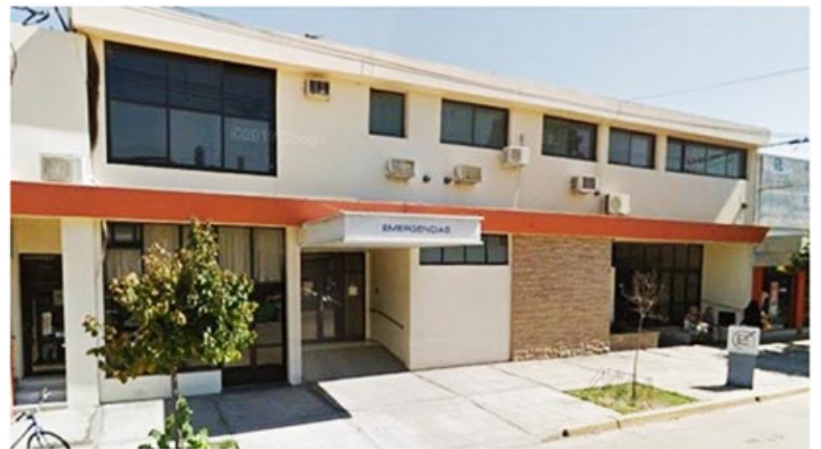
Edificio del antiguo Sanatorio Bragado, ahora vacío y extrañando a la gente que supo darle vida.

En tiempos donde las lluvias visitan seguido a la zona en el fenómeno denominado "Niño" que suele transformar el drama de la sequía, en grandes inundaciones, así pasó por ejemplo, en