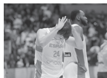
España cayó ante Canadá 88-85.

Por su lado, República Dominicana, dirigida por el DT bahiense Néstor 'Che' García, no pudo con