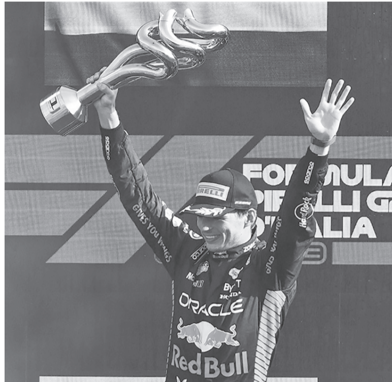
Arruinó la fiesta. Red Bull se impuso sobre Ferrari.

Los "tifosi" asistieron con entusiasmo después de la prestación de Sainz entre viernes y sábado, pero "Mad Max" se hizo dueño de la carrera a partir de la decimoquinta vuelta cuando pasó al frente a pura potencia y expertiz, al volante de su RB-23.