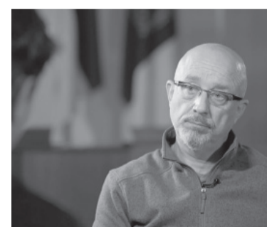
Oleksiy Reznikov, de salida.

Rusia bombardeó con drones varios sitios industriales a orillas del Danubio, en una región del suroeste de Ucrania fronteriza con Rumania, un país miembro de la OTAN que denunció un asalto "injustificado", informaron fuentes oficiales. "El enemigo atacó las infraestructuras industriales civiles de la región del Danubio", dijo la