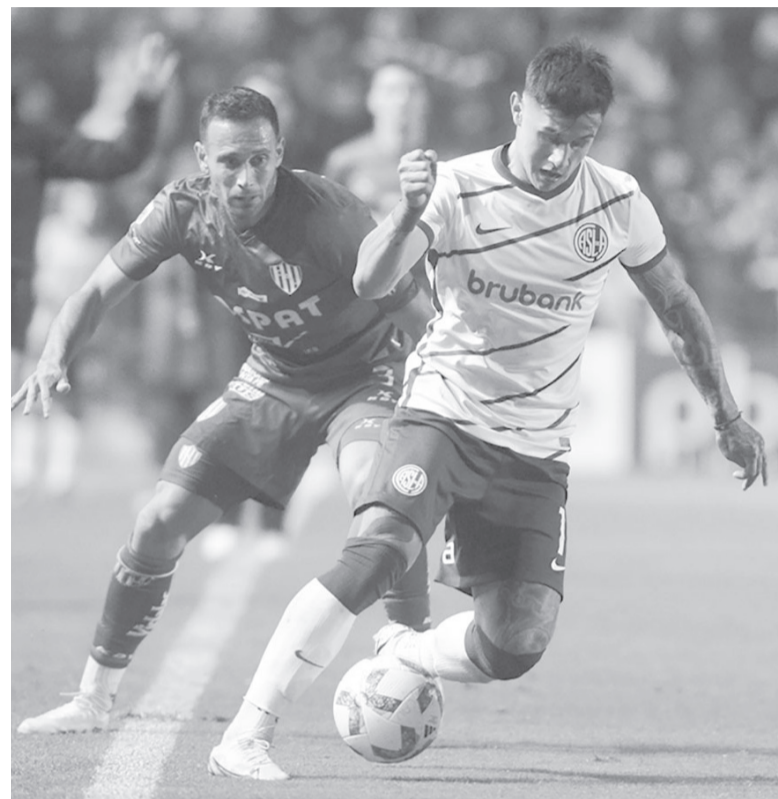
Firmaron tablas. Partido trabado en el 15 de Abril.

En el segundo período, San Lorenzo apostó -decididamente- a