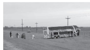
Accidente fatal a la altura del kilómetro 120 de la ruta 3.

En el escrito, el hermano de la actriz denunció que Lotocki implantó en el cuerpo de Luna "un producto de relleno que contenía microesferas de polimetil metacrilato (PMMA) en lugares del cuerpo donde no estaba permitido su uso totalmente prohibido y en cantidades superiores a las sugeridas por la ciencia médica". - DIB -