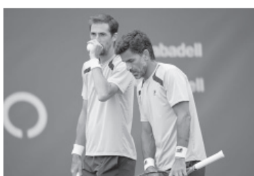
La dupla busca el sexto título del año.

"Machi" González y Molteni fueron convocados por el capitán argentino Guillermo Coria para integrar el equipo albiceleste que se medirá ante Lituania por la Copa del Davis, el 16 y