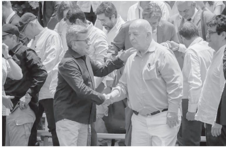
Diálogo. El cuarto ciclo de negociaciones terminó ayer en Caracas.

"Declaración del Bajo Calima y San Juan como zona crítica y avance en el Bajo Cauca, nordeste antioqueño y sur de Bolívar, para su declaración como zona crítica; allí se adelantarán acciones y dinámicas