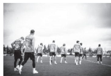
"La Celeste" entrena pensando en Chile.

● Mediocampistas: Mathías Olivera (Napoli), Joaquín Piquez (Palmeiras), Emiliano Martínez (Midtjylland, Dinamarca), Felipe Carballo (Gremio), Federico Valverde (Real Madrid), Manuel Ugarte (PSG), Maximiliano Araujo (Toluca)