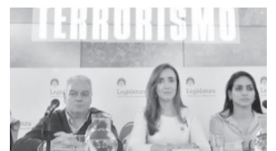
La candidata a vicepresidenta de LLA, Villarruel.

la exposición de quienes fueron invitados en calidad de víctimas de actos terroristas. “Durante 40 años las víctimas del terrorismo fueron barridas bajo la alfombra, se las negó. Ningunas de estas víctimas tiene justicia, no pueden saber la verdad de lo que sufrieron, no pueden tener una reparación, ni siquiera moral, de lo que sufrieron. Lo sufrieron de aquellos que quisieron imponer una tiranía de izquierda”, dijo en otro pasaje de su intervención Villarruel, quien desde hace dos décadas es referente del Centro de Estudios Legales sobre el Terrorismo y sus Víctimas (CELTIVV), que milita en favor de un discurso que contem-