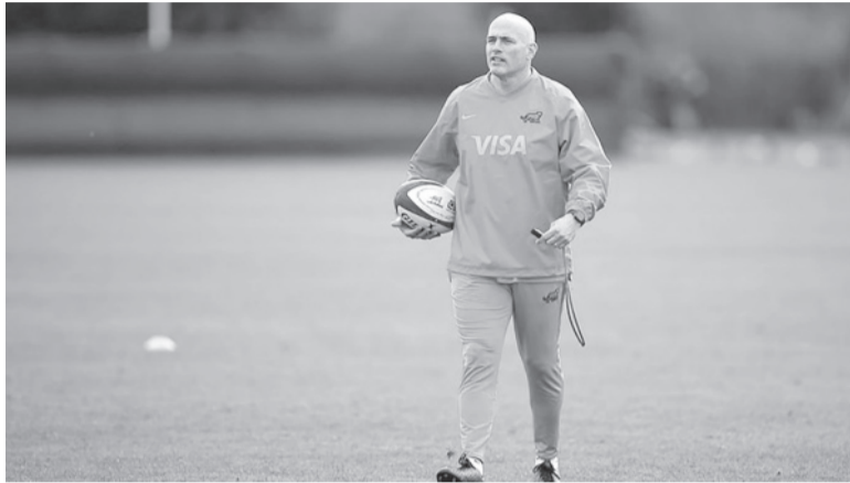
Con confianza. Argentina se entrena para enfrentar a Inglaterra.

El asistente técnico vistió la camiseta de Los Pumas en 87 oportunidades. En su larga carrera jugó en el Bristol de Inglaterra (2003), Leinster de Irlanda (2000-2003), Toulon de Francia (2009-2011) y finalmente en el Stade Français de