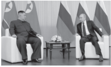
Los líderes norcoreano y ruso.