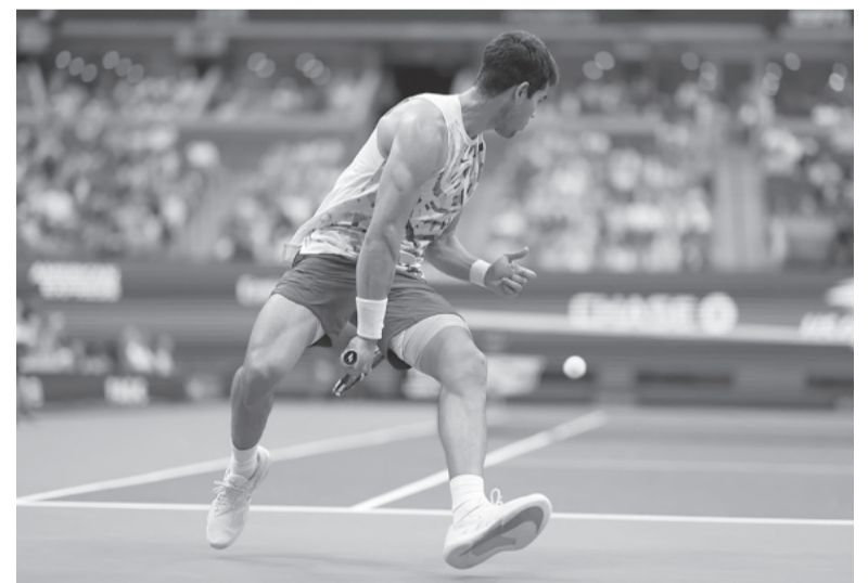
El español brilla en Nueva York. - @cartosalcaraz -

Rublev jugará en los cuartos de final con el triunfador del duelo entre el también ruso Daniil Medvedev (3), quien viene de eliminar