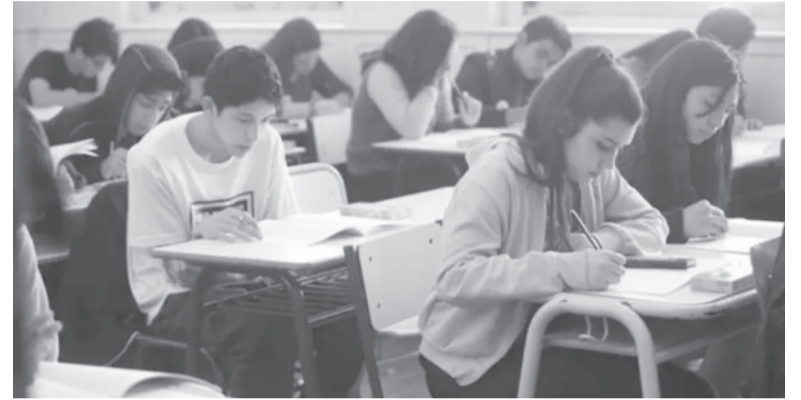
En 2018, el 24,4% de los estudiantes de 17 años habían abandonado la escuela.

El dato surge de comparar las trayectorias de los que tenían 17 años en 2022, con los del 2018.