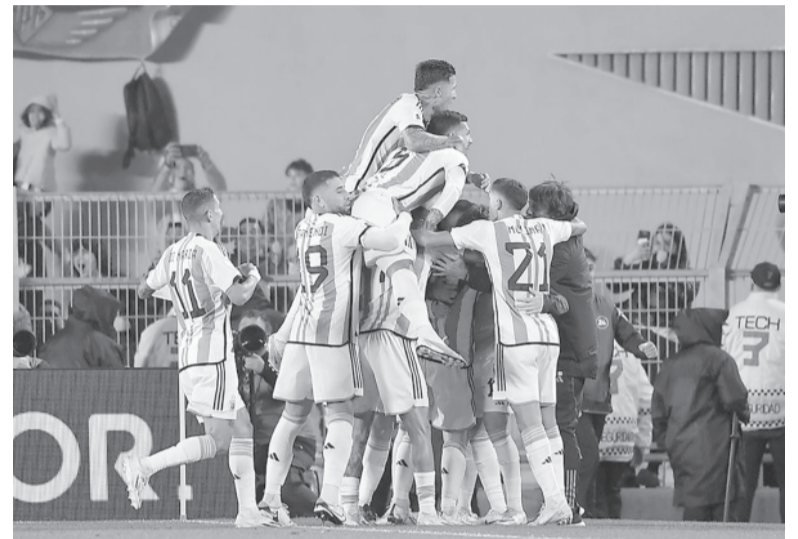
Invisible. En el medio, tapado por abrazos, está Messi tras una nueva genialidad.

Uruguay vs. Chile (20) Brasil vs. Bolivia (21.45)