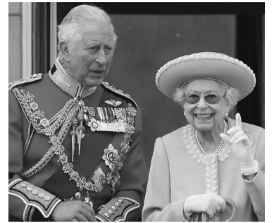
Isabel junto a su hijo, el ahora Carlos III.