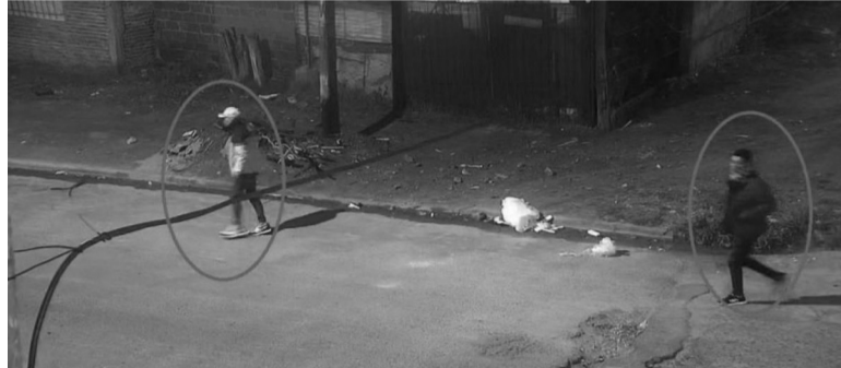
Monitoreo. El delincuente quedó registrado en las cámaras de seguridad de la zona junto a otro hombre. - Captura de video -

con dinero en efectivo, dos teléfonos celulares y las alianzas de la pareja, precisaron las fuentes.