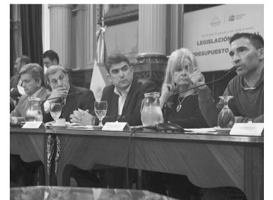
Los inquilinos, representados.

En la jornada de ayer, los representantes de los inquilinos reclamaron hallar una solución a la escasez de ofertas de inmuebles.