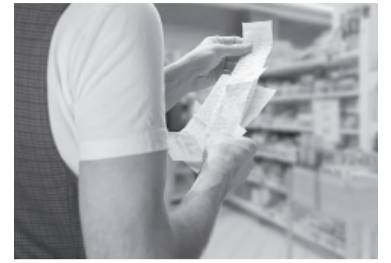
Informe de la Dgeyc. - Archivo -