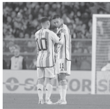
Antes de salir, Messi le coloca la cinta a Di María.

Messi recibió una enorme ovación cuando fue reemplazado por Exequiel Palacios: "Queremos que esto no se termine nunca. Hace poquito que fuimos campeones del mundo y parece que fue hace un montón. Pero hay que seguir