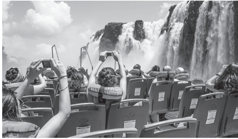
Destino Cataratas. Iguazú, una de las plazas más elegidas por los argentinos en cada edición del PreViaje.

“Hay más de 25 mil millones de pesos cargados en concepto de compras anticipadas, de los cuales más de la mitad corresponden a paquetes turísticos, otro