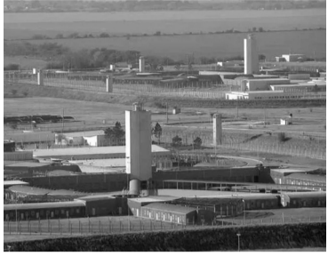
Carcel cordobesa de Bouwer.