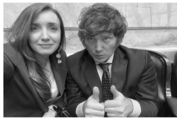
La fórmula de la Libertad Avanza, denigrada por el medio inglés.

La influyente revista británica de economía The Economist se refirió al candidato de La Libertad Avanza (LLA), Javier Milei, con una contundente mirada negativa. Aseveró que como político representa “un riesgo para la