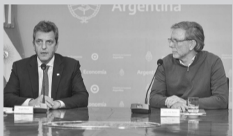
Massa, junto a Bahillo.

El Gobierno Nacional oficializó la eliminación de las retenciones para una serie de productos de las economías regionales como el maní, el arroz, la industria forestal y el vino, formalizando así el reciente anuncio del ministro de Economía, Sergio Massa. “Es una decisión que creemos justa y federal, que tiene un impacto de más de US$ 180 millones que deja de cobrar en impuestos el estado, pero que tiene el foco puesto en más de 1,2 millones de trabajadores que forman parte de este sector económico y en las 17 provincias argentinas que