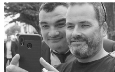
De recuerdo, una selfie con Agustín Creevy.

dremos entre los relevos cuatro forwards y dos centros", finalizó. "Los Pumas" formarán con Thomas Gallo, Julián Montoya (capitán) y Francisco Gómez Kodela; Matías Alemanno y Tomás Lavanini; Pablo Matera, Marcos Kremer y Juan Marín González; Gonzalo Bertranou y Santiago Carreras; Mateo Carreras; Santiago Chocobares, Lucio Cinti y Emiliano Boffelli; Juan Cruz Mallía. El banco de suplentes estará integrado por Agustín Creevy, Joel Sclavi, Eduardo Bello, Guido