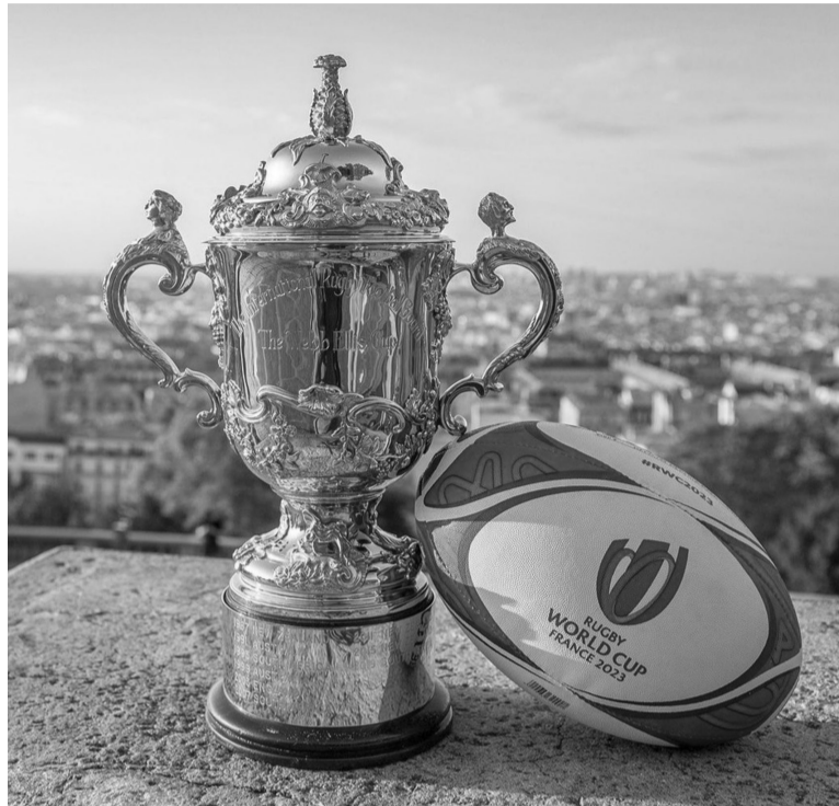
Arranque. Francia-Nueva Zelanda juegan desde las 16.15.- World Rugby -

Zelanda son los favoritos para acceder a la siguiente fase. En el Grupo B aparecen como candidatos Irlanda -que encabeza el ranking oficial actual de la World Rugby- y el campeón