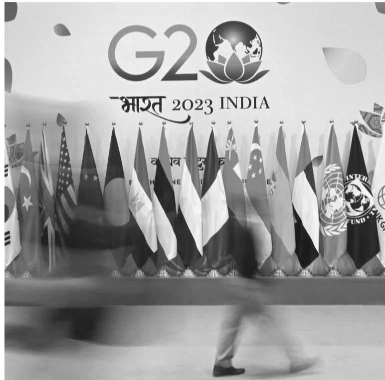
Todo listo. India será sede este fin de semana de la cumbre de líderes.

Como ocurrió en todos los foros internacionales desde la invasión rusa hace más de 18 meses, será el ministro de Relaciones Exteriores, Serguei Lavrov, el que represente a Moscú. Por su parte, China no dio explicaciones sobre la ausencia de Xi Jinping en la cumbre de sábado y domingo en Nueva Delhi y se limitó a decir que el primer ministro Li Qiang encabezará la delegación en la cita de las 20 principales economías, entre ellas Argentina, que en conjunto suman el 85% del PBI mundial. Pero las especulaciones, tanto de diplomáticos occidentales como de la prensa, es que la decisión está vinculada principalmente con la tensión diplomática que generó la publicación de un mapa oficial en el gigante asiático que demarca como propios varios territorios en disputa de soberanía con India.