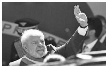
Luiz Inácio Lula da Silva.

El presidente de Brasil, Luiz Inácio Lula da Silva, encabezó ayer el desfile cívico-militar del Día de la Independencia, haciendo gestos para tratar de despolitizar esta fecha conmemorativa tras la gestión de su antecesor, Jair Bolsonaro. Lula encabezó el desfile de cerca de dos horas realizado por las Fuerzas Armadas y varias instituciones civiles en la Explanada de los Ministerios, la avenida monumental de Brasilia en la que se ubican las sedes de los tres poderes. El mandatario estaba acompañado de numerosos ministros, de su mujer y los comandantes de las Fuerzas Armadas, con los que posó para una foto grupal dándose