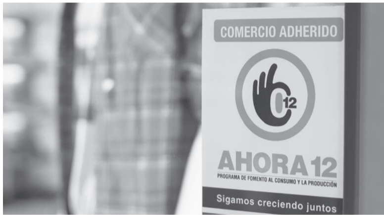
El plan es clave para los comercios.

Las empresas que no acepten suscribir los acuerdos de precios que exige el Gobierno al menos hasta el 31 de octubre no podrán vender a través del plan Ahora 12, según informó la secretaria de Comercio a compañías vinculadas a la indumentaria, calzado y electrodomésticos. Mientras se espera que la inflación llegue a los dos dígitos tras la devaluación tras las PASO y los ingresos se redujeron, comprar en 6 ó 12 cuotas es clave para los comer-