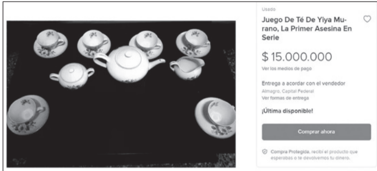
Insólito. La publicación en Mercado Libre de las tazas de Yiya Murano. - Captura de pantalla -

Y agregó: "Esta señora falleció hace un tiempo y hace unos dos meses me llama la hija de la mujer y me dice que tenía algo mío. Me lo manda y cuando abro, veo el juego de té este. Cuando vi una sola tacita, lo volví a guardar, y dije 'lo