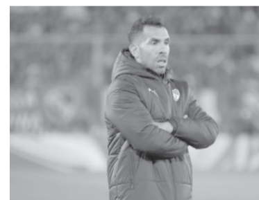
Volverá al Gigante de Arroyito.