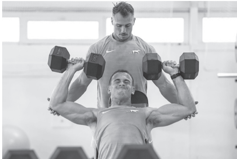
A pura fuerza. El equipo argentino se entrenó en el gimnasio. - @lospumas -

“Tenemos que imponer la manera nuestra de jugar, que empieza en las formaciones fijas, con lo cual el objetivo es dominar la batalla de