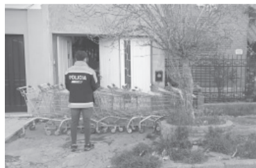
Vivienda allanada.

● ZÁRATE. - Cinco gendarmes fueron procesados, dos de ellos con prisión preventiva, por la desaparición de unos 16 kilos de cocaína que habían sido secuestrados en un procedimiento y estaban en custodia en un depósito de la fuerza. - Télam -