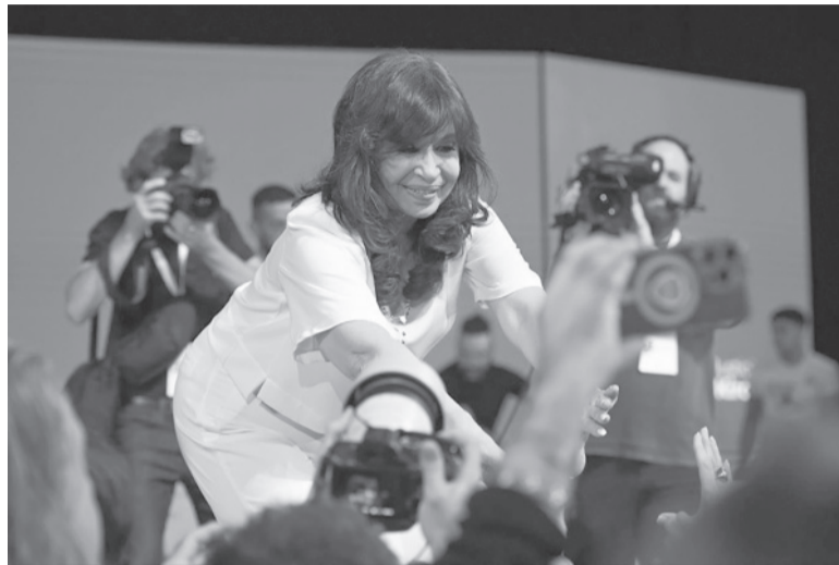
Sin efecto. Cristina Fernández había sido sobreesaída.

La charla titulada "De castas, herencias, derrumbes y futuro" se realizará el sábado desde las 18 en la Universidad Metropolitana para la Educación y el Trabajo (UMET), donde Fernández será la principal oradora.