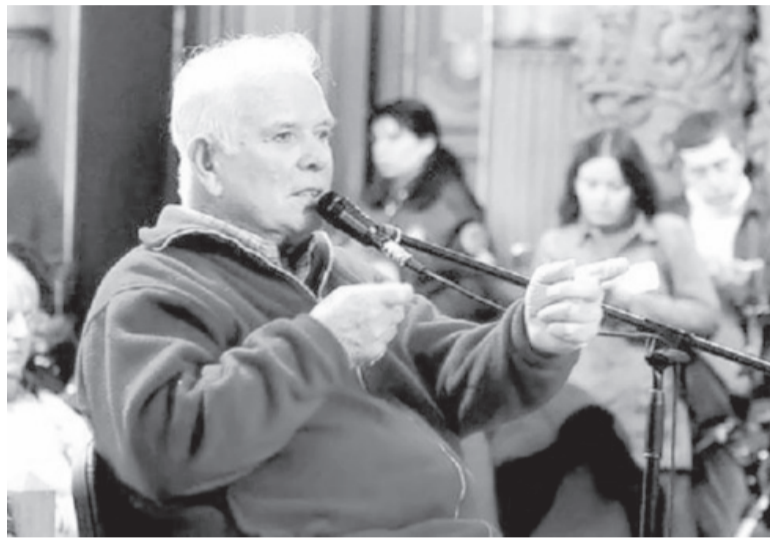
Testigo. Su testimonio fue clave en la causa contra Etchecolatz.

"Hace dos años que fui a hablar con el doctor Hernán Schapiro, que hacía poco tiempo se había puesto a cargo de la Fiscalía de Lesa Humanidad y nos contaba que estaban haciendo un montón de cosas, y en ese montón de cosas yo le fui muy claro: 'Vos me podés mostrar un montón de papeles, pero el problema es que toda esta investigación termina siendo nula', indicó. De cualquier manera, señaló que "la esperanza" de saber qué pasó "no la vamos a perder nunca" y contó que "ya está la generación que va a seguir reclamando". "En algún momento alguien de la familia va a tener la posibilidad de