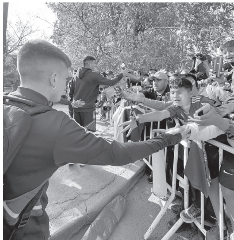
La bienvenida. Los jugadores saludaron a los hinchas santiagueños.