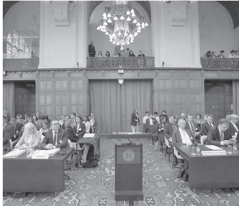
Tensión. Las audiencias se extenderán hasta el 27.

Por otro lado, Kuzmin afirmó que el argumento de Ucrania de que Rusia "abusó" de la Convención de la ONU sobre el Genocidio como motivo para invadir al país