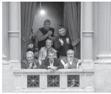
Massa, al momento de la votación.