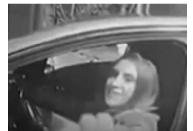
El momento en que quedó registrada.