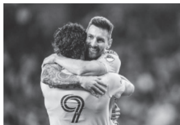
Lionel Messi, capitán del Inter.

Messi volvió a entrenarse ayer con normalidad luego de su ausencia en el último partido del seleccionado argentino contra Bolivia en La Paz, pero todavía no está asegurado su regreso a las canchas. El DT de Inter Miami, Gerardo Martino, informó antes de la práctica de ayer que tanto Messi como Jordi