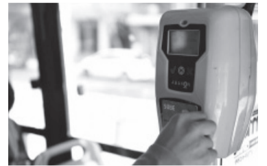
350 instituciones bonaerenses integran la lista de usuarios.

"A partir del 1° de octubre miles de estudiantes bonaerenses van a