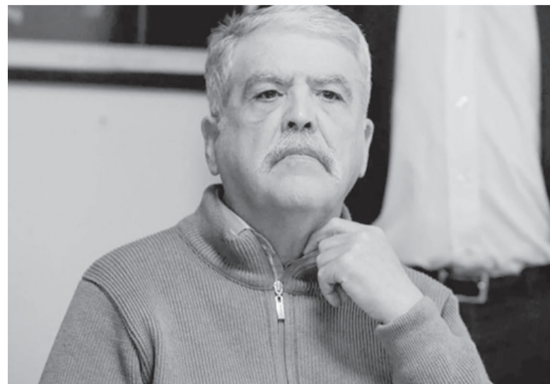
Fallo adverso. El exministro apela desde 2018 contra la figura contemplada en la Ley 27.303.