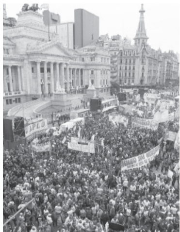
Una marcha para seguir la sesión. - Télam -

La legisladora, al mismo tiempo, cuestionó a los bloques opositores que se oponen a la iniciativa al sostener que “cuando es el bolsillo de los trabajadores les agarran las ganas de cuidar las arcas del Estado”. - Télam -