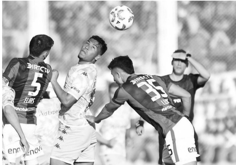
Por separado. La fecha pasada, 1-1 entre San Lorenzo y Racing. - Racing -

Respecto de San Lorenzo, suma seis puntos e intentará volver a la victoria luego de tres empates en fila para meterse entre los cuatro mejores de la zona. En la fecha an-