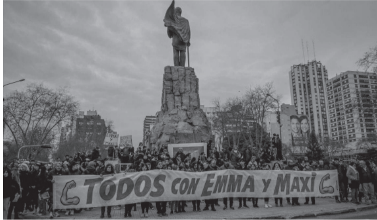
Reclamo desesperado. Familiares, amigos y allegados de los jóvenes se habían movilizado en su Mar del Plata natal.

años, y Soria, de 34, se puso en marcha en la madrugada del lunes 28 de agosto, horas después de que allegados de ambos denunciaran su desaparición, en una dependencia policial en Málaga.