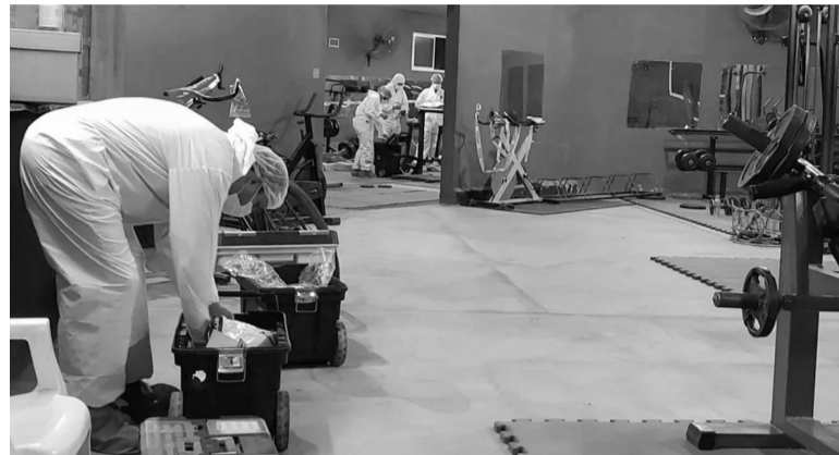
Tragedia. La policía científica recolecta pruebas: la joven de 28 años recibió cuatro disparos.

Tras cometer el femicidio, el hombre huyó hacia la zona del ex “Arsenal Miguel de Azcuénaga”, en donde funcionó un centro clandestino de detención, tortura y exterminio durante la última dictadura cívica