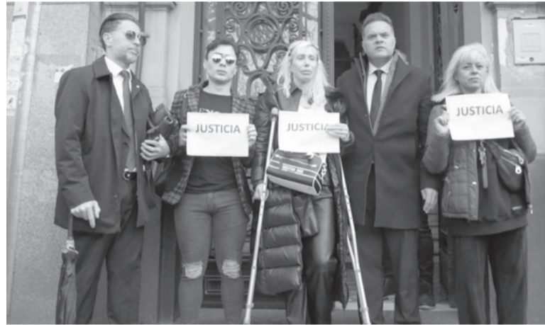
Habló. Trenchi hizo declaraciones televisivas, al salir del tribunal ubicado en Talcahuano 624.

"Sentía ganas de que me expliquen porque son nueve años de