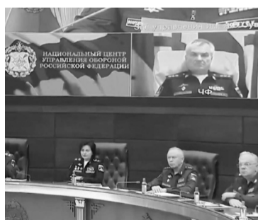
El almirante Sokolov, en pantalla gigante. - Captura de video -

admitieron que según "las fuentes disponibles", el comandante figuraba entre los muertos, pero que la identificación de las víctimas es a veces difícil ya que los cuerpos quedan bastante deteriorados.