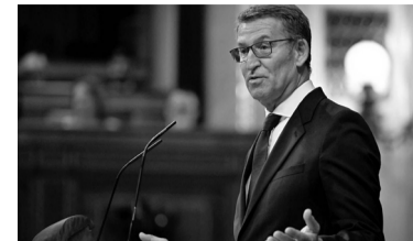
El líder del PP casi reconoce la derrota.