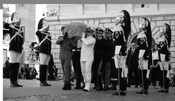
La primera ministra italiana Giorgia Meloni y el presidente francés Emmanuel Macron despidieron ayer en Roma los restos del exmandatario (2006-2015) Giorgio Napolitano, fallecido el viernes a los 98 años. Meloni, Macron, el presidente Sergio Mattarella, su par de Alemania Frank-Walter Steinmeier y el ex titular del Eliseo Francois Hollande encabezan el "funeral laico" con el que, por primera vez en la historia republicana de Italia, se despide a un jefe de Estado en la Cámara de Diputados.