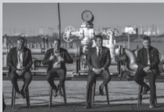
El programa funcionará por los próximos 60 días. - YPF -

El ministro de Economía, Sergio Massa, anunció ayer un programa de incentivo exportador para el sector petrolero, que permitirá a las operadoras ingresar 25% de las divisas a través del contado con liquidación (CCL) por los próximos 60 días para garantizar el aumento de las