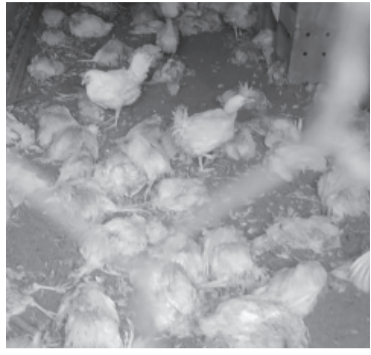
Gallinas muertas con un corte en el cuello. - DIB -