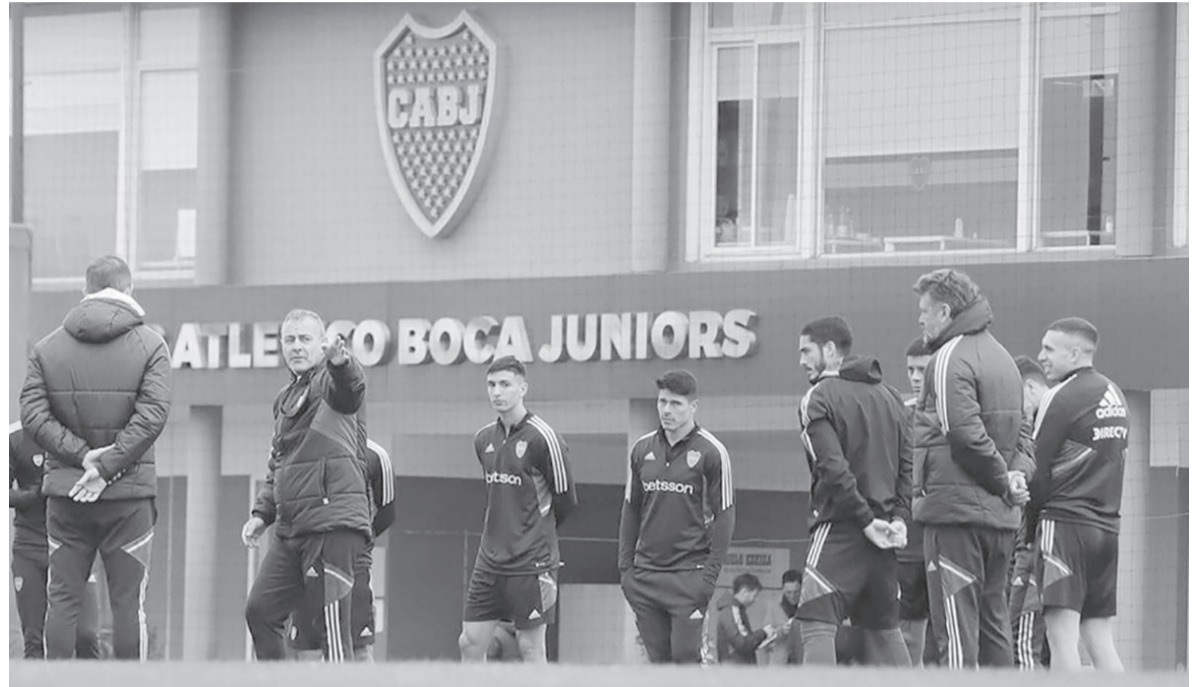
Puesta a punto. Entrenamiento matutino en el predio de Ezeiza.

El plantel volverá a los entrenamientos hoy desde las 9 en Ezeiza y luego a la noche quedará concentrado en un hotel del barrio de Monserrat. Desde ayer a las 14, en el sitio soysocio.com, los socios activos pueden reservar su lugar para el partido ante Palmeiras y hoy desde las 14 lo harán los socios adherentes, ambos con cuotas al día y sin pagar ningún recargo. Abonados y vitalicios ingre-