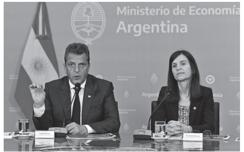
Refuerzo. Los beneficiarios serán aquellas personas entre 18 y 64 años que no reciben otra prestación del Estado.

La medida será compensada a través del cobro de un anticipo extraordinario de ganancias a grandes contribuyentes. El ministro candidato sostuvo que "a los efectos de que esta medida no termine afectando las cuentas públicas y mantengamos el orden fiscal, sin que eso nos imposibilite llegar a los sectores más vulnerables como es este caso, es que hemos tomado la decisión de cobrarle un anticipo extraordinario de ganancias a aquellos sectores que fueron los grandes ganadores de la devaluación impuesta por el FMI, centralmente bancos, compañías financieras y compañías de seguro que serán notificadas en el día de mañana por la AFIP a los efectos de realizar el pago del anticipo de ganancias". "Pretendemos de esta manera mantener el equilibrio en las cuentas públicas, pero llegar a los sectores más vulnerables de nuestra sociedad, a los efectos de cuidar el ingreso de todas y todos los argentinos. Tenemos un objetivo; recuperar el ingreso para mejorar la calidad de vida de la gente