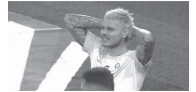
El lamento del argentino. - Captura de video -