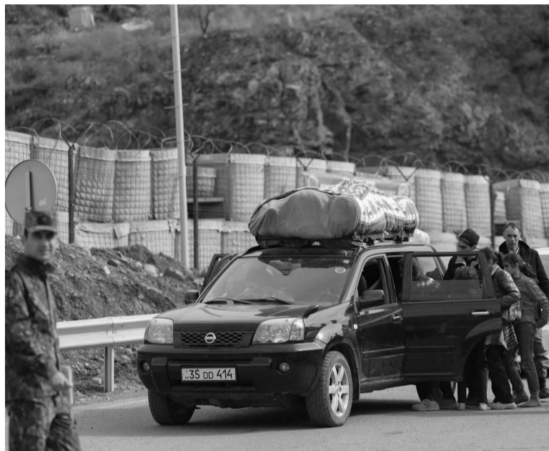
De salida. Las autoridades estiman que unas 28 mil personas huyeron rumbo a Armenia.