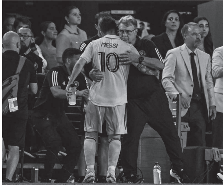
Referentes. Messi, la estrella del equipo de Martino.

Inter Miami inició su camino en la US Open Cup, torneo con 109 años de historia y llamado Lamar Hunt en homenaje a uno de los mayores impulsores del deporte en el país, sin el aporte de Messi. El mejor jugador del Mundial Qatar 2022 solo disputó la semifinal ante Cincinnati que se definió por penales tras un vibrante empate 3-3 que tuvo dos