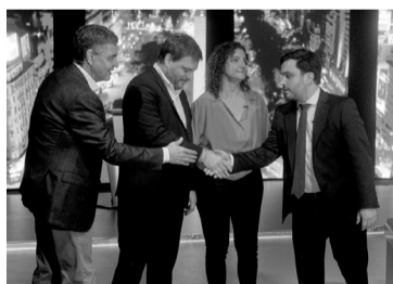
Los cinco candidatos porteños.

En tanto, Marra dijo que representa a una sociedad "cansada, harta y triste por una dirigencia política