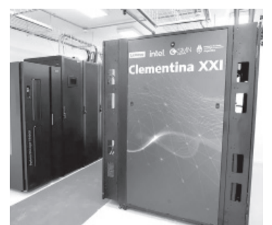
La supercomputadora. - Télam -

“Desde 2019 trabajo en el proyecto ‘Ayuda en 3D’, en el que diseñamos e imprimimos con los estudiantes dispositivos de ayuda para un grupo de personas con artritis reumatoide, una enfermedad discapacitante en la que degeneran las articulaciones y les cuesta mucho hacer fuerza con las manos por la inflamación que tienen”, precisó. - Télam -