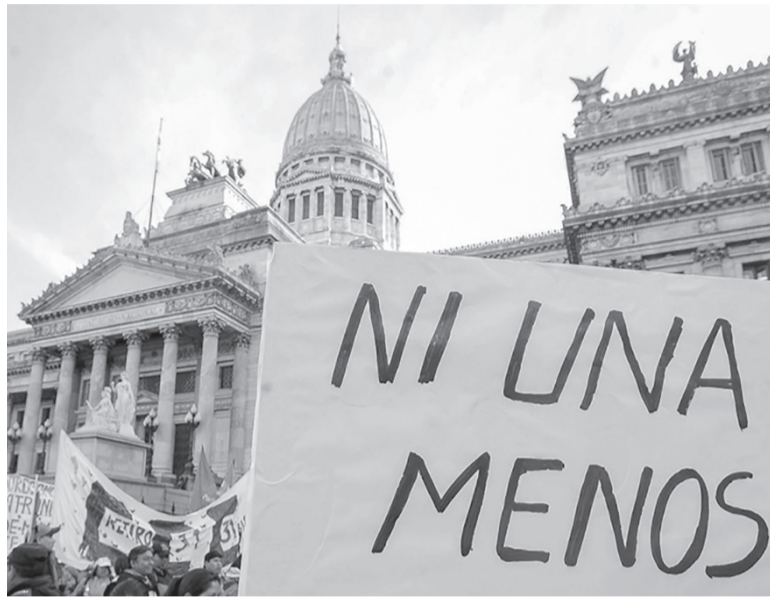
Participación. La movilización tendrá foco en la ciudad de Buenos Aires y réplicas en todo el país.

zará a las 18.30 desde el “kilómetro 0” de la capital provincial –ubicado entre calles Garibaldi y San Martín– hasta la Casa de Gobierno; y en la ciudad de San Luis, el punto de encuentro será en el Correo Argentino, también ubicado en el “kilómetro 0”, a las 18 horas.