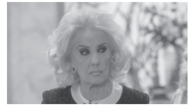
La diva de los almuerzos.