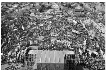
La cancha de Cambaceres, repleta.