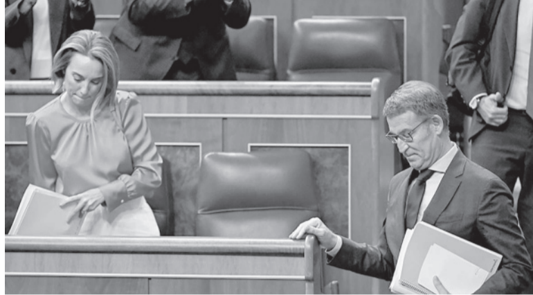
Mal trago. Pese a ser el candidato más votado en las elecciones, el líder del PP cosechó solo 172 sufragios en el Parlamento.

Consciente de una derrota segura, Feijóo, de 62 años, pasó gran parte de su sesión de investidura, que comenzó ayer, atacando a Sánchez y a los independentistas catalanes, de quienes depende el líder del Partido Socialista Obrero Español (PSOE) si quiere volver a ser elegido presidente.