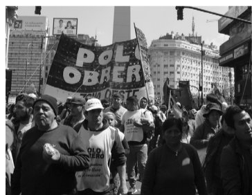
Agrupaciones sociales reclamaron en el Obelisco.

La ministra de Trabajo, Raquel ‘Kelly’ Olmos, había dicho que el objetivo de la reunión del Consejo