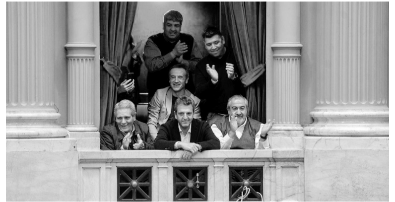
Presente. Como hizo la semana pasada, se espera que Massa esté presente a la hora de la votación.

También como ya pasó la semana pasada en la cámara baja, Massa y los referentes de la CGT y las dos CTA estarán presentes en el Senado para seguir la sesión y cele-