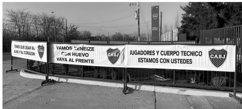
Banderas en apoyo al plantel en el predio de Ezeiza. - Tato Aguilera -

Será un duelo entre dos potencias del continente que saben jugar este tipo de partidos y son conscientes de que si bien el partido en La Boca es importante, no será determinante para una serie que de definirá en el Allianz Arena dentro de ocho días. - Télam -