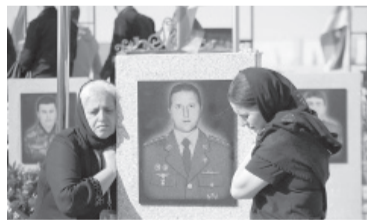
Familiares homenajean a un soldado caído.

Ante el paso de miles de refugiados, la ciudad fronteriza armenia de Goris, donde la mayoría efectúa su primera parada, estaba ayer casi