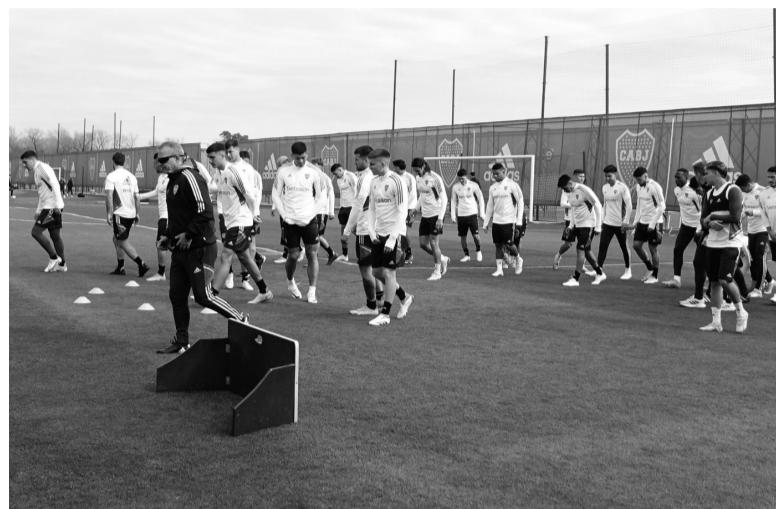
El partido. La cita más importante para el equipo de Almirón.

No obstante, en la última prueba sería de la semana, Almirón le devolvió la titularidad a Barco en el mediocampo, retrasó a Advíncula al lateral derecho (su