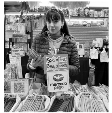
Una usuaria de la billetera desarrollada por Mercado Libre.

La decisión, sin embargo, llega con una serie de condiciones en favor de los comercios pyme. Entre ellas, está la bonificación para cobros con QR de Mercado Pago. En ese sentido, se bonifica el arancel para cobrar con QR usando dinero