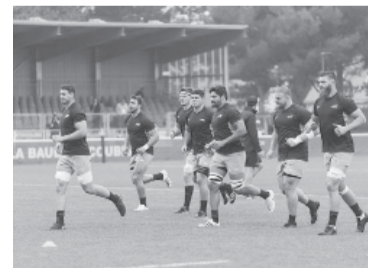
El sábado, frente a Chile. - Los Pumas -

"Los Pumas" se entrenaron con trabajos de alta densidad. En la actividad dirigida por Cheika, el plantel argentino realizó en primer turno una entrada en calor. Posteriormente, el equipo se separó. Los tres cuartos llevaron a cabo distintas destrezas con pelota y con jugadas con el pie y envíos a los