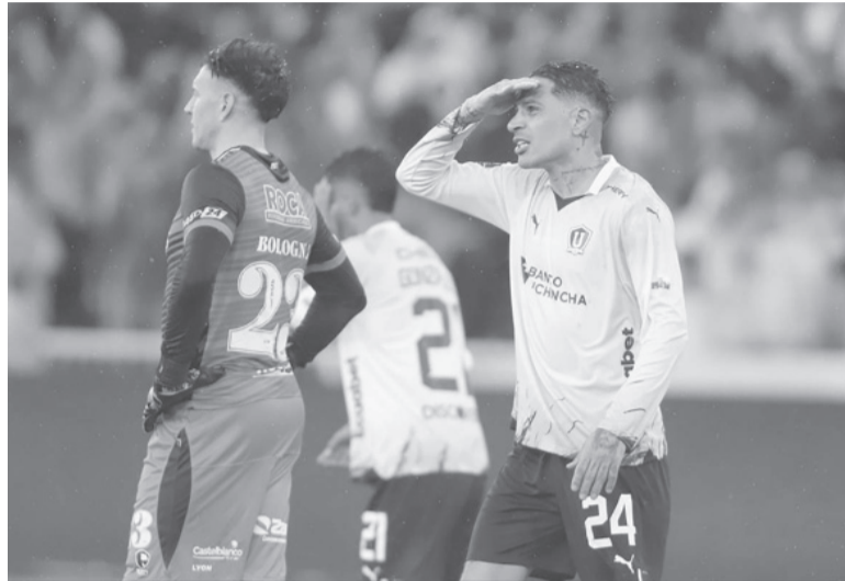
Letal. Paolo Guerrero, una pesadilla para el equipo argentino.

Los dirigidos por Luis Zubeldía se impusieron con dos goles del delantero peruano Paolo Guerrero y el último del argentino Ezequiel Pioví, ex Arsenal, y así el equipo de Florencio Varela dejó atrás una