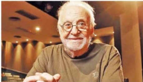
-Pepe Soriano, uno de los artistas más prestigiosos del país.

Cada obra, cada función de cine, cada ficción de la televisión, se convierte en un homenaje merecido. "Pepe" Soriano fue uno de los grandes actores argentinos. Los recuerdos suyos han de perdurar por muchos años.