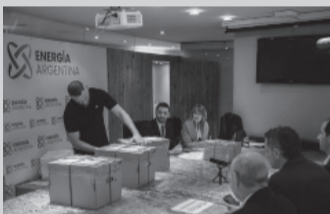
Apertura de sobres.