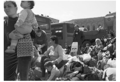
Casi 100 mil personas ya cruzaron la frontera.