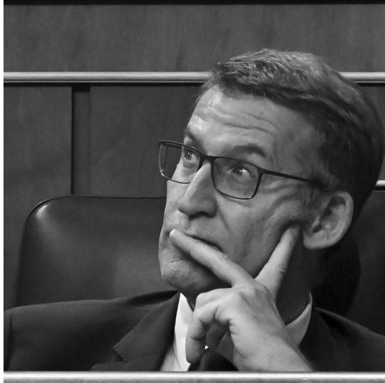
Final. La asociación con el VOX no fue suficiente para la derecha.

Feijóo obtuvo 172 votos a favor sobre 350 -los del PP, Vox y dos pequeños partidos-, mientras que su candidatura fue rechazada por otros 177 diputados del Partido Socialista, la extrema izquierda y formaciones regionalistas, repro-