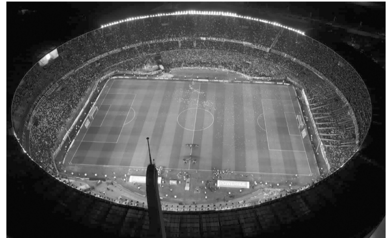
Colmado. Así lucirá el Cilindro tras agotarse las entradas. - Racing -

Rosario Central y Newell's animarán hoy una nueva edición del