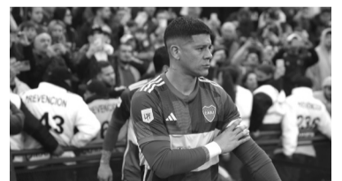
No contra el "Millonario", sí en la vuelta ante Palmeiras.