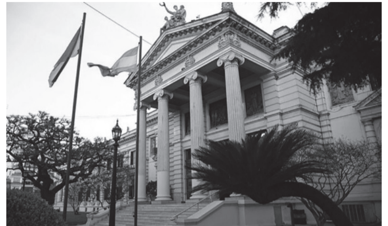
En la mira. La Legislatura, bajo la sospecha de ser una caja de financiamiento ilegal de la política.

La sala de Casación que se sorteará para intervenir y éste Tribunal decidirá finalmente reabre la investigación o coincide con la Cámara de Garantías y la declara nula.