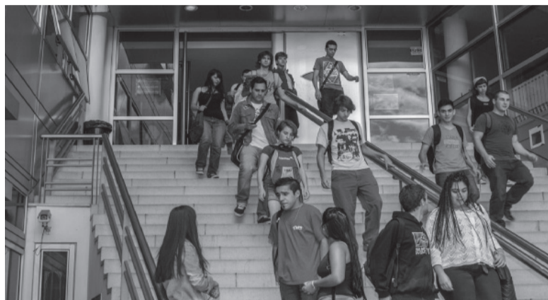
Nuevas universidades. El Senado de la Nación aprobó la ley en sesión especial.