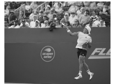
El tenista bonaerense.