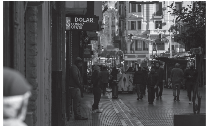
Escalada. El mercado cambiario cierra septiembre con una suba total de 68 pesos, 457 en lo que va del 2023.

El BCRA compró US$ 530 millones de dólares en divisas duran-