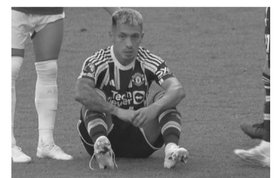
El central argentino.

El problema de Martínez surgió a raíz de la fractura en el quinto metatarsiano del pie derecho, lesión que sufrió a mediados de abril en el duelo ante Sevilla por