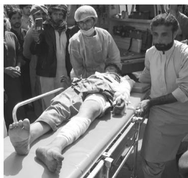
Una fuerte imagen tras la explosión de una bomba.

Cada año, mezquitas y edificios del gobierno se adornan con lu-