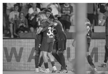
Los nuevos líderes. - Barcelona -

Con la victoria, el conjunto catalán llegó a los 20 puntos y comanda en soledad, aunque hoy puede ser superado o igualado por el sorprendente Girona, que suma 19 unidades y juega desde las 13.30 frente al "Merengue". Precisamente Real Madrid también tiene la chance de subirse a lo más alto, para lo cual debe imponerse sobre la gran revelación del campeonato. En caso de hacerlo, el conjunto blanco