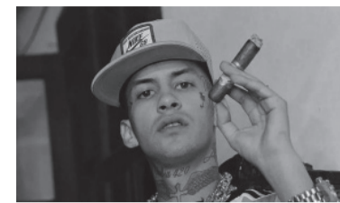
El músico Elián Valenzuela.