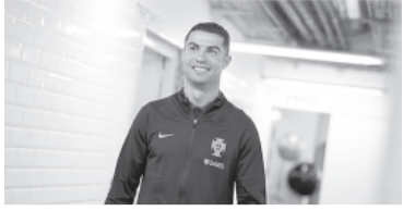
La estrella lusa. - Portugal -