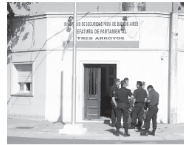
Jefatura Departamental de Tres Arroyos. - LaNoticial -