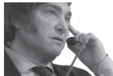
El economista, en el Hotel Alvear.

Ante un auditorio de 700 personas, Milei expresó que la rapidez del proceso