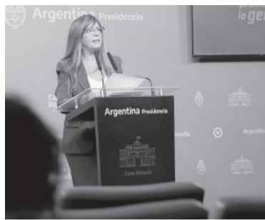
Cerruti anunció la medida en vísperas del 50 aniversario del golpe en Chile.

La portavoz señaló que en el decreto se plantea que "Pinochet no es merecedor de la gratitud de la Nación Argentina, pues es