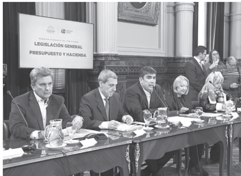
Plenario. Las locaciones temporarias, un punto álgido en un debate de tonos elevados.

En el plenario de las comisiones, cuando exponían delegados de martilleros, los senadores del Frente de Todos (FdT), Anabel Fernández Sagasti, Matías Rodríguez y María Eugenia Duré; y Luis Naidenoff y Juan Carlos Martínez, de Juntos por el Cambio (JxC), cruzaron recriminaciones por la falta de acuerdo sobre algunos