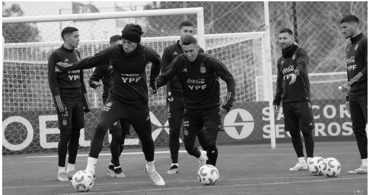
Todo listo. En un Monumental colmado, arranca otro desafío.

La "Tri" tiene en su contra el fallo del Tribunal Arbitral del Deporte (TAS, en sus siglas en francés) por la mala inclusión del futbolista Byron Castillo, que hasta puso en duda su participación en el último Mundial de Qatar 2022.