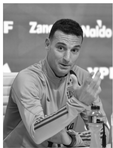
Scaloni, el DT de la Selección.

Lionel Scaloni afirmó ayer que Lionel Messi jugará "todos los minutos que pueda en estos partidos" contra Ecuador y Bolivia