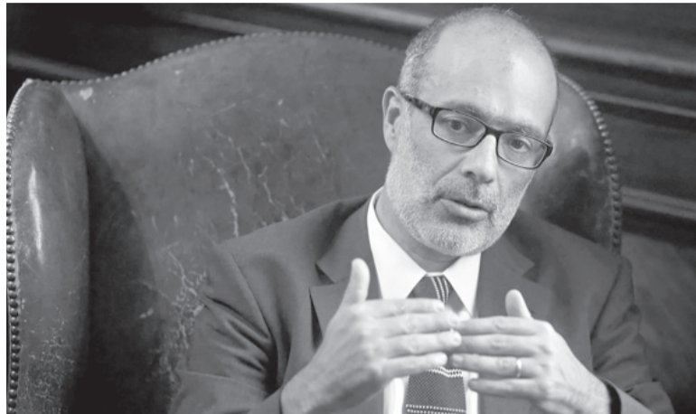
Cauteloso. Para el referente del Fondo en el hemisferio sur, la medida de Milei requiere "mucho apoyo político".

lo fiscal. Todos los países requieren una política fiscal sostenible que lleve a tener deudas no demasiado altas, y dolarizar o no dolarizar no sustituye esa tarea", completó el economista chileno, quien se desempeña en su cargo en el FMI desde marzo de 2023.