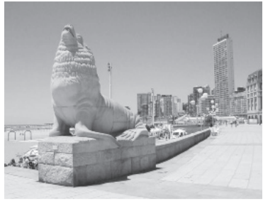
"La Feliz", posible destino.