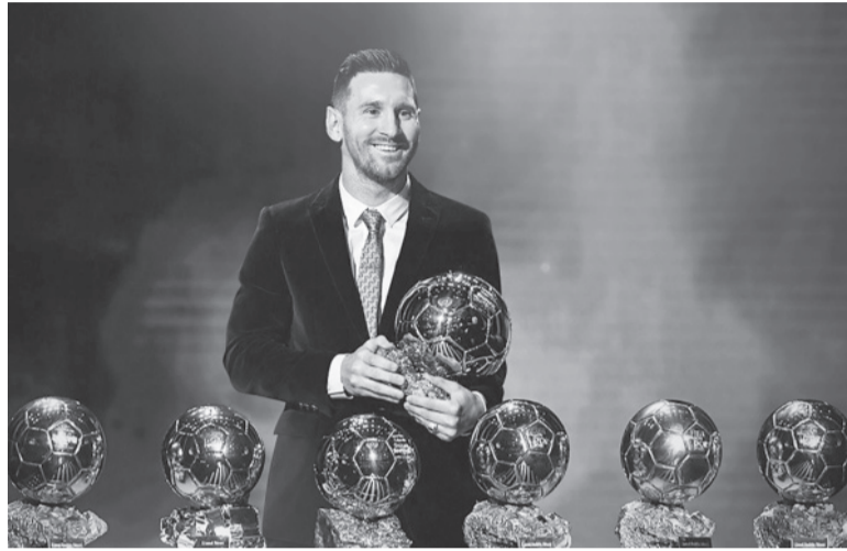
¿Otro más? El mejor de todos va por el octavo.

Otros nombres de peso que integran la nómina de 30 futbolistas que irán en busca del Balón de Oro