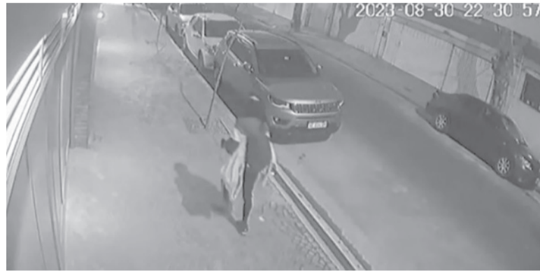
Investigación. Reconstruyen los 56 minutos que hizo el presunto homicida para llegar a la escena del crimen y huir de ella. - Captura de video -

ce de las avenidas Casares y Berro, la esquina del Jardín Japonés, por donde ingresó al parque y a la zona de la Plaza Sicilia, donde según los investigadores pocos minutos después se produjo el crimen cuando Barbieri estaba contemplando la luna y fue asaltado y apuñalado en el pecho por el delincuente que le robó su teléfono celular.