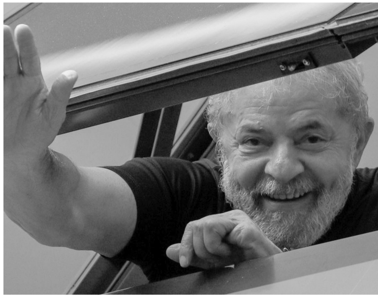
"Algo armado". Así calificó el juez la causa que llevó a Da Silva a la cárcel, proscribiéndolo de las elecciones.

Lula fue preso en abril de ese año acusado de corrupción pasiva y blanqueo de dinero, y salió de la cárcel tras 580 días, en noviembre de 2019, después de que el Supremo decidiera que una persona sólo puede cumplir condena cuando se agotan todos los recursos.