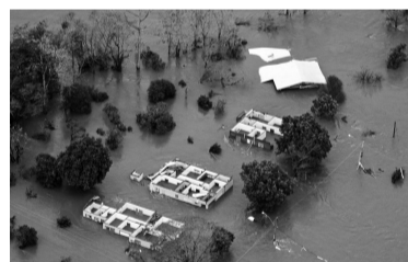
Tragedia en el sur del país.

La cifra de muertos por el paso devastador de un ciclón extratropical en el sur de Brasil llegó a 28 ayer luego del hallazgo de seis cadáveres en una vivienda del estado de Rio Grande do Sul, fronterizo con Argentina y Uruguay, informaron las autoridades. El gobernador de Rio Gran-