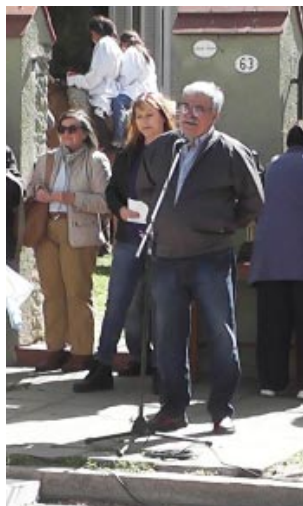
Seguidamente se mencionó a las escuelas que estaban presentes: Jardín de Infantes