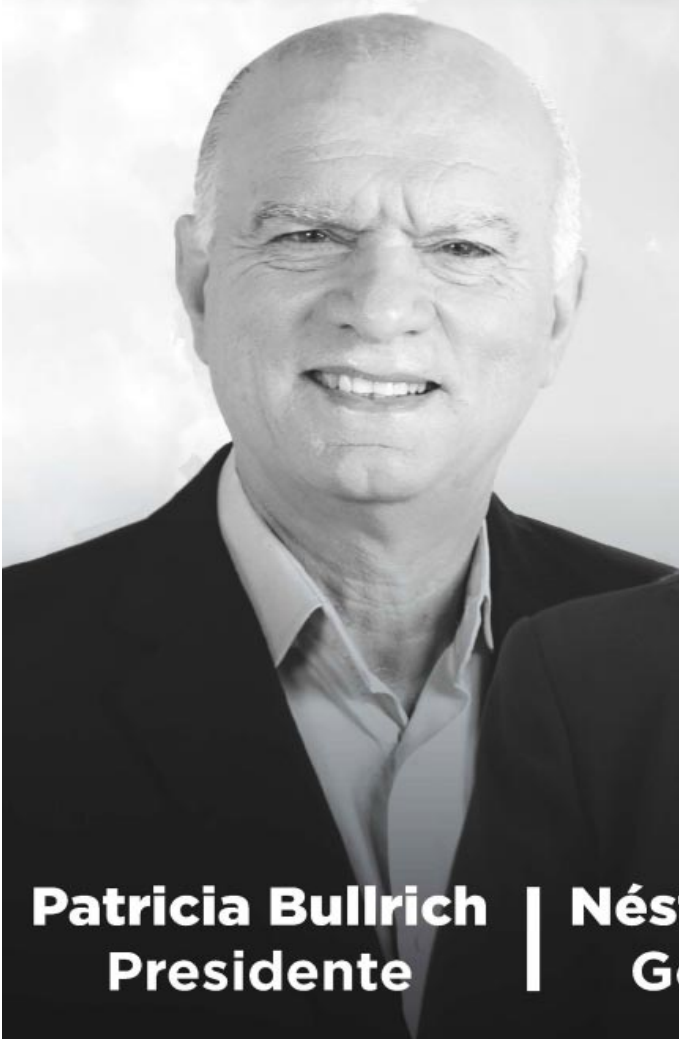
Patricia Bullrich Presidente