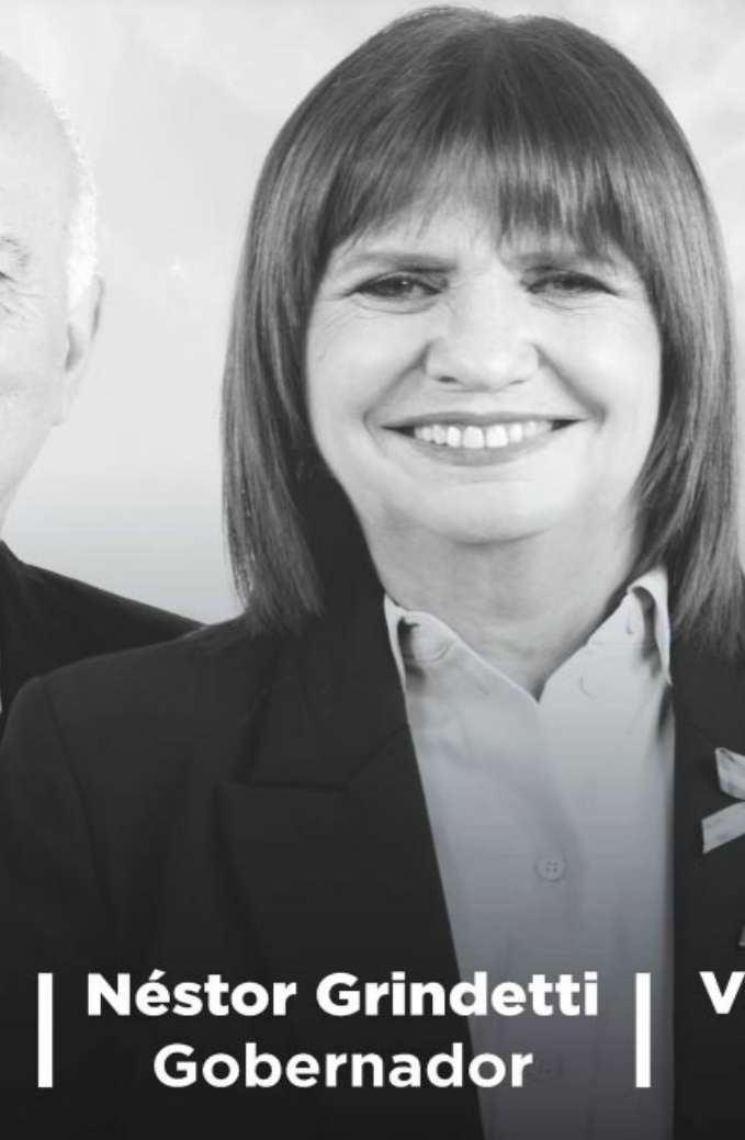
Néstor Grindetti Gobernador