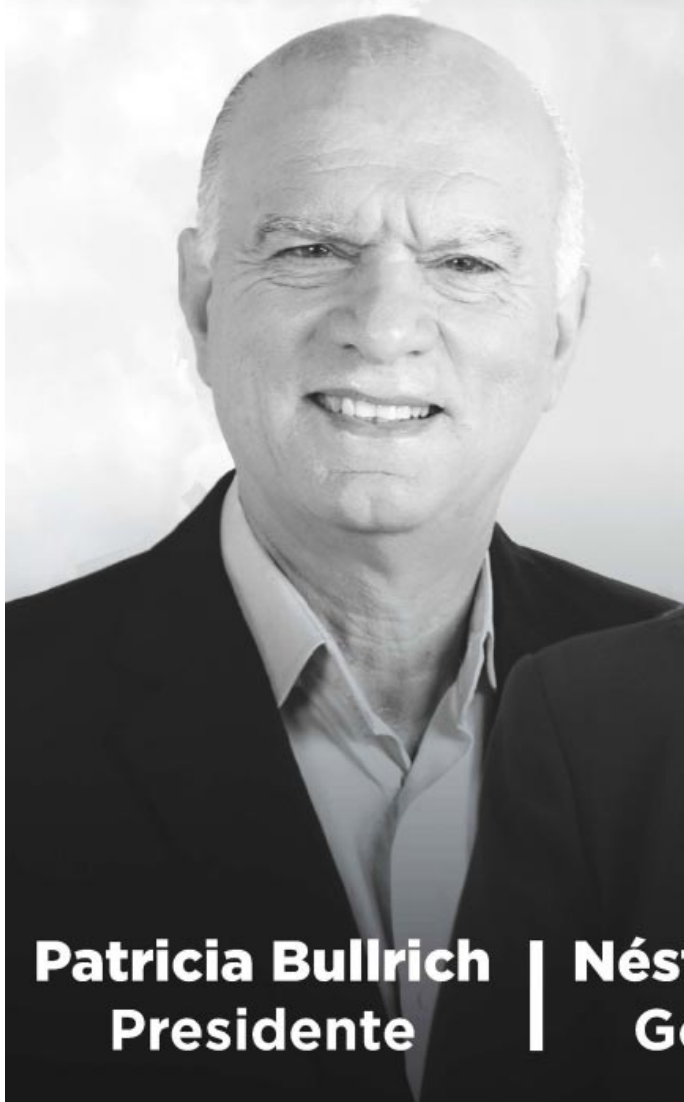
Patricia Bullrich Presidente