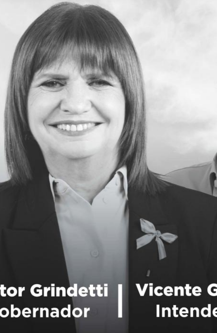
Néstor Grindetti Gobernador