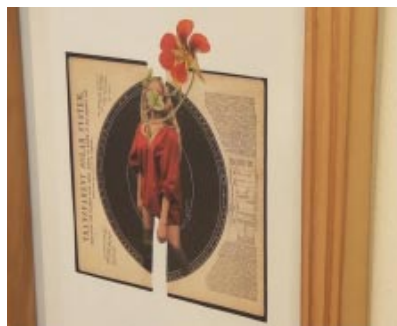
Sosa, quienes nos han ayudado mucho en esto".