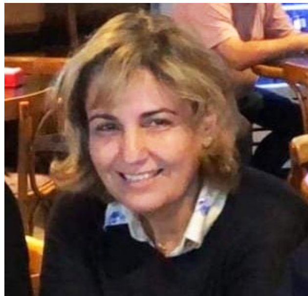
cional Javier Milei referidas al ex Presidente Raúl Alfonsín

Título: Invitación al Concejo Deliberante del Partido de Bragado a repudiar las manifestaciones del Diputado Na-