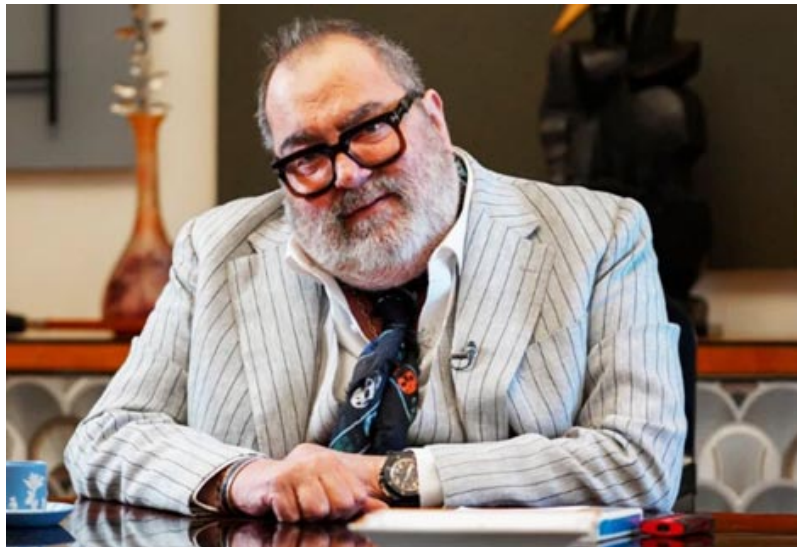
Lanata, un claro analista de la realidad.

La Calle escuchó las declaraciones hechas en estos días con la claridad conceptual de Jorge Lanata "la sociedad Argentina se ha vuelto conservadora", dijo "es que mucha gente ha aceptado que se mantengan las cosas como están".