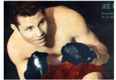
José María Gatica, ídolo boxístico que se apagó pronto.

Terminó su carrera casi en la miseria sin haber podido ahorrar en su tiempo de esplendor. Retirado del boxeo vendía banderines del Club Independiente en Avellaneda. Al final de un partido queriendo subir a un micro, terminó siendo aplastado por las ruedas del vehículo.