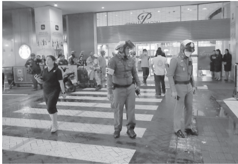
Miedo. Pese al cercano aniversario de un hecho similar, las matanzas no son habituales en el país asiático.

"Dijo que era como si hubiera otro 'él' dentro, diciéndole a quién