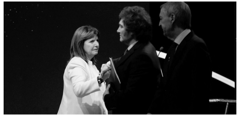
Fuerte. El tono de ambos candidatos subió en la última semana y se intensificó tras el debate. - Captura de video -

Al respecto, Bullrich siempre reconoció haber pertenecido a la Juventud Peronista, pero negó su participación en Montoneros. - DIB -