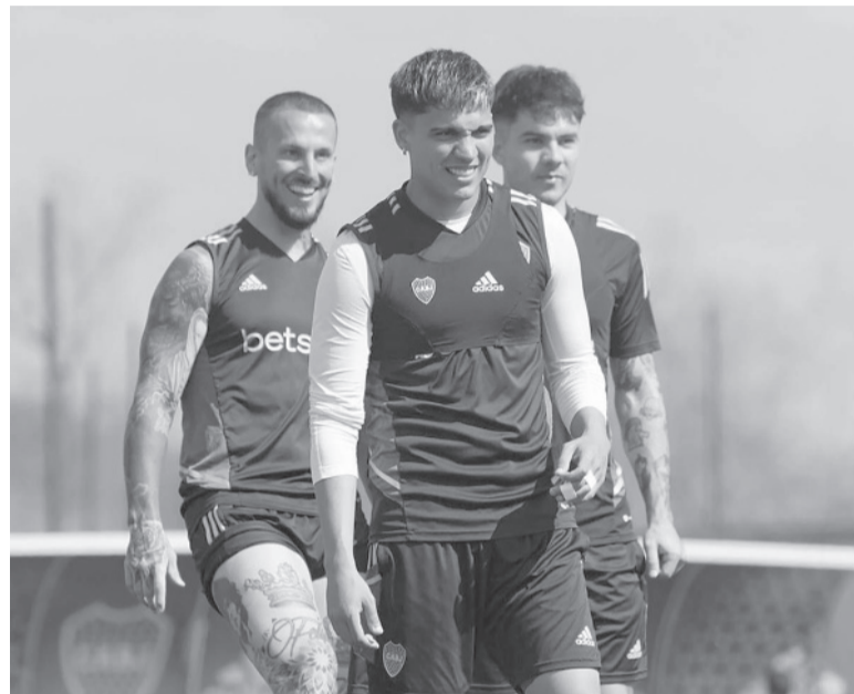
Última práctica. El plantel "xeneize", ayer, entrenamiento matutino en Ezeiza.