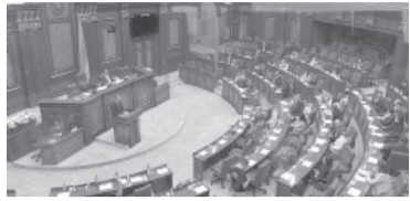
Orden de arresto contra Putin.