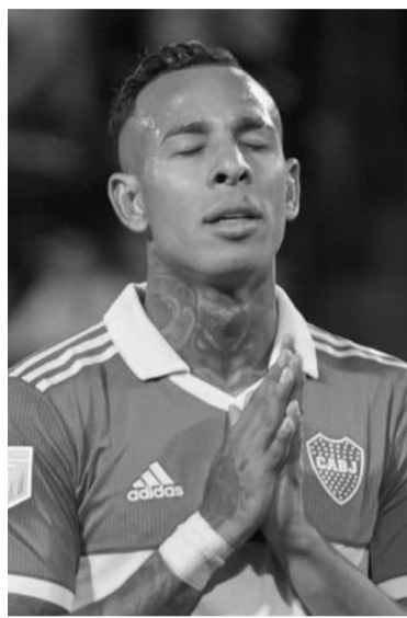
El colombiano está acusado de abuso sexual.

A su vez, la Cámara se refirió a los tratados internacionales firmados por el Estado argentino como el de la Convención de Belem do Pará y la Convención de las Nacio-