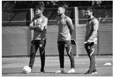
Entrenamiento ya sin Gago. - Racing -