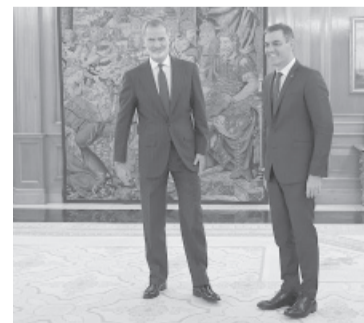
Reunión entre el monarca y el socialista.

Sánchez evitó en principio pronunciar la palabra "amnistía", uno de los principales condicionantes que pusieron los catalanes para acordar, aunque no el único, ya que tanto ERC como JxC sumaron ahora otro reclamo: la convocatoria a