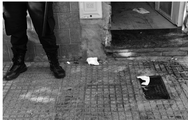
Lugar de los hechos. La mancha de sangre en el ingreso de la casa.

"En plena discusión, el hombre se tornó violento, agarró un cuchillo y los empezó a apuñalar a los dos", dijo una fuente judicial que inter-